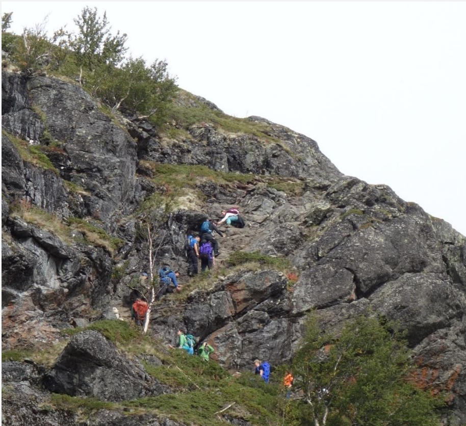
Foto til venstre er frå laurdag 1. september 2018 (det var liknande køer også dei to helgene før)

Reklamen i A-magasinet og i sosiale media kan ha hatt ein effekt. Reklamen om å kunne gå åleine stemmer ikkje heilt; i 2018 såg det ut til at også Knutshøe var innhenta av køa