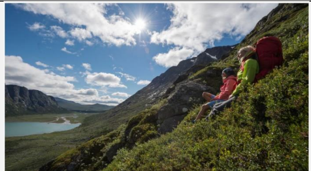
HØYT OPPE: Turen langs Leinungen eller over Knutshøe er vakker og ligger rett i nærheten av Besseggen på Valdresflya.

Vil du unngå kø på Norges mest kjente fjellturer? Her er tipset til nabofjellet