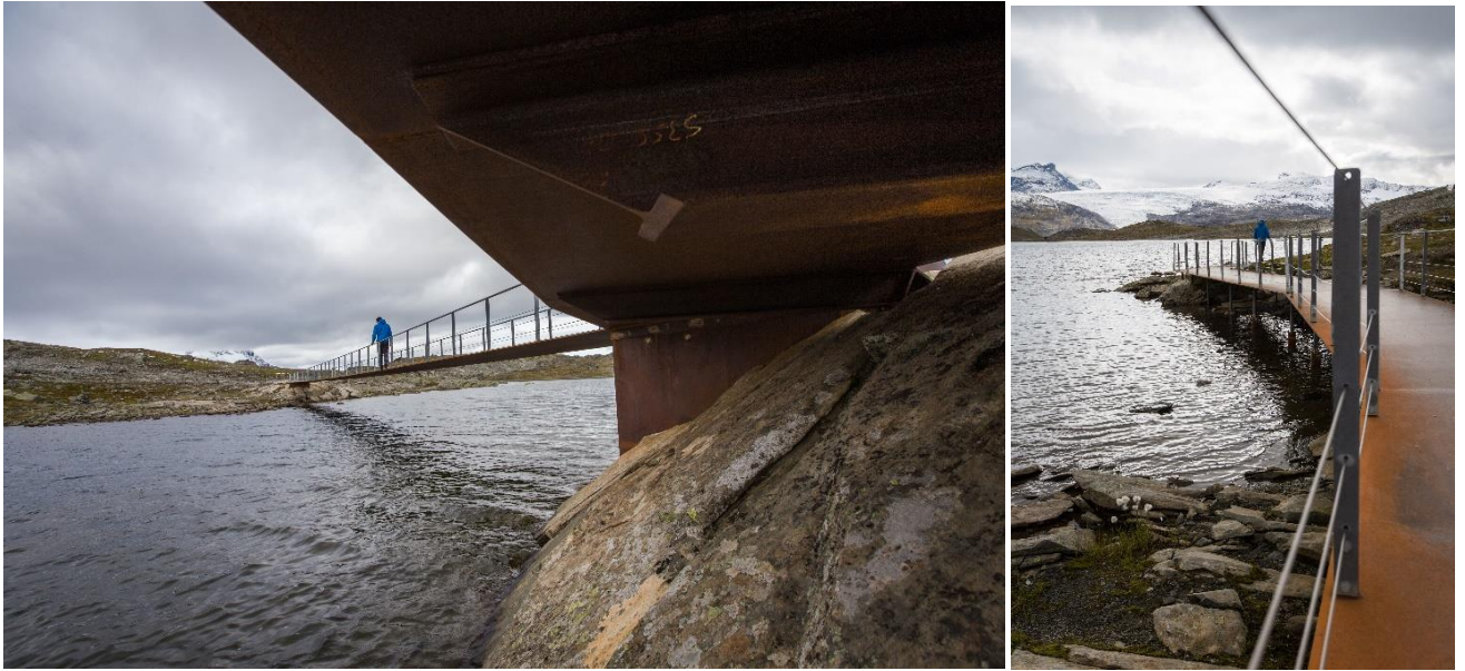
Pilot innfallsport ved Sognefjellshytta vart opna 20.08.2018. Gangbrua fekk Stålkonstruksjonsprisen 2019.