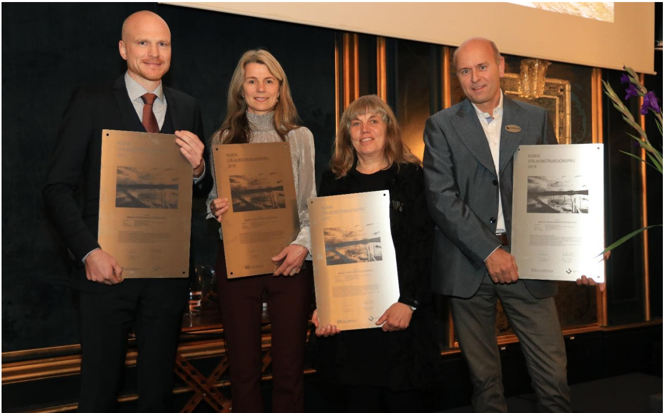
Frå prisutdelinga, Norsk Ståldag 2019.