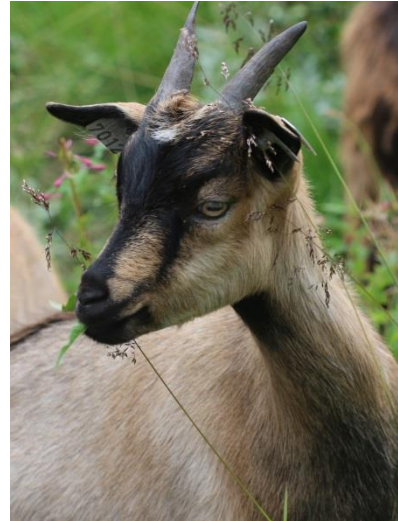
Slåttehelg i Gjendebu august 2017