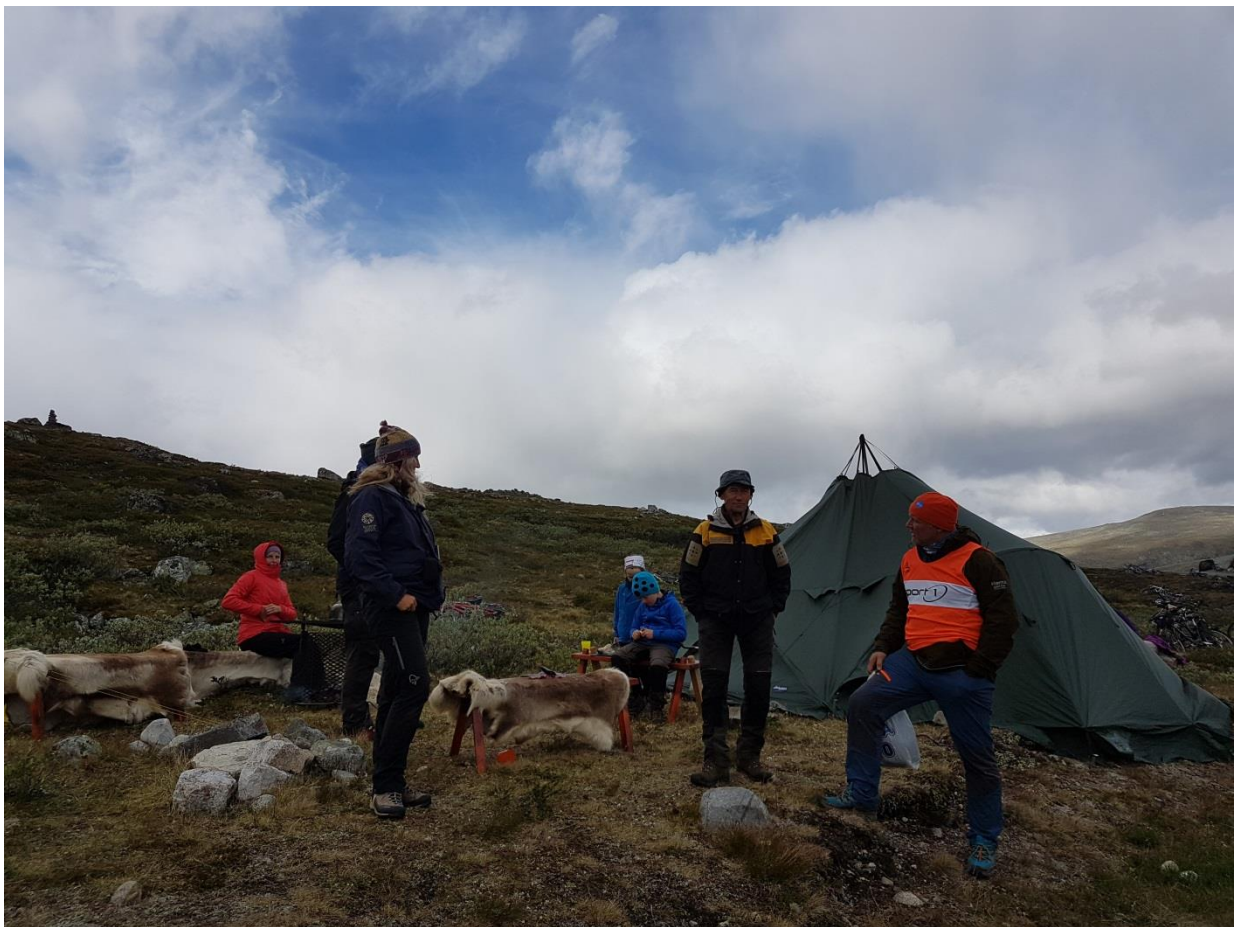
Stand med nasjonalparkinformasjon og natursti i samband med Vamp-konserten i Glitterheim i juli.