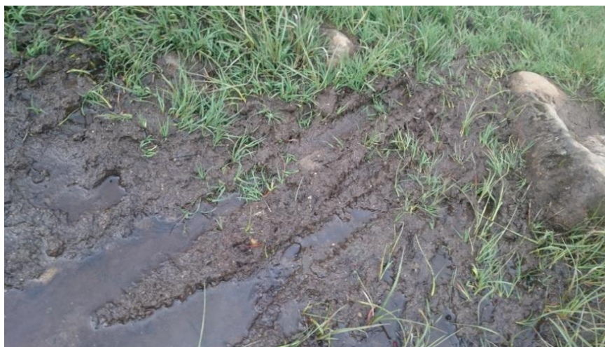
Sykkelspor i Jotunheimen

Dei velbrukte stigane er ofte prega av større steinar som stikk opp der terrenget i traseen elles er trakka ned, og her vil ofte sykklistar finne seg eit spor ved sida av stigen. Dette gjev ein stadig breiare trase, der brukarane sjølv finn seg stadig nye spor på blaute eller steinete parti av stigane. Dette skjer også der det berre er gåande, men problemet synest å auke når også sykklistane kjem på banen. Eit særleg problem knytt til slitasje frå sykklar er sekundær erosjon av vatn, der sykkelspora fungerer som små vasskanalar som lett blir utvida ved kraftige regnbyger.