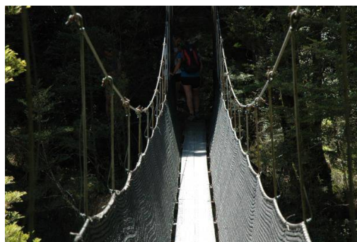
Hengebru med sidesikring

Bygging er planlagt før sommaren 2015. Nødvendig transport er tenkt utført med scooter på slutten av vinteren, og det blir også søkt om godkjenning for slik transport.