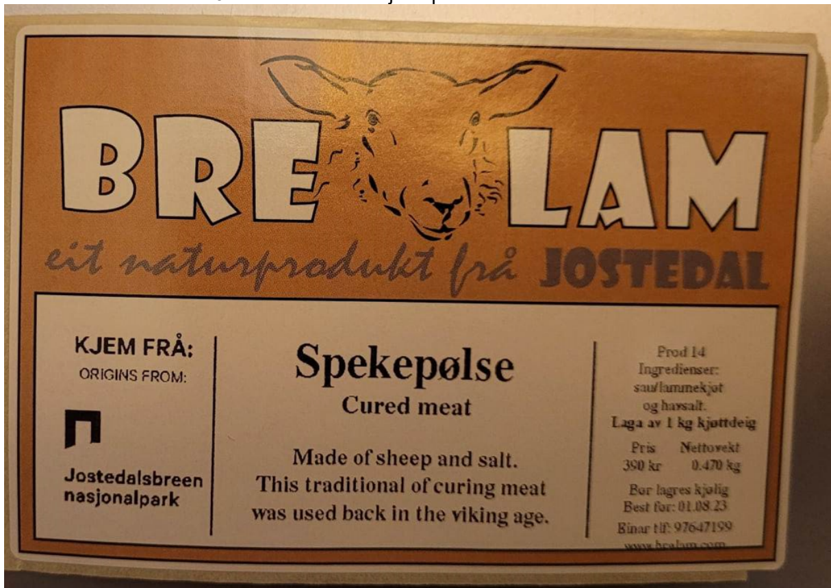
Figur 1: Forslag til bruk av det kommersielle merket saman med eigen logo.

Verksemda representerer utmarksbruk i eit krevjande terreng, gamle tradisjonar og naturlege produkt kring Jostedalsbreen nasjonalpark, og vil såleis vere ein god kandidat til å nytte det kommersielle merket til Jostedalsbreen nasjonalpark.