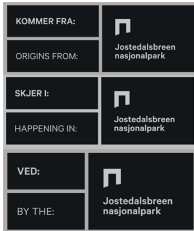
Figur 1 Døme på merke dei tre kategoriane som kan søkjast om: Kategori opphav, kategori aktivitet og kategori lokalisering.

I designmanualen for Noregs nasjonalparkar er lagt til rette for at verksemder som geografisk kan knytast til ein nasjonalpark kan søkje om løyve frå nasjonalparkstyra om å nytte eit spesiallaga merke. Det kommersielle merket/logoen frå nasjonalparken skal nyttast saman med verksemda sin eigen logo i marknadsføring av eit produkt, teneste eller aktivitet. Nasjonalparkstyret skal handsame søknader om kommersiell bruk av merkevara Noregs nasjonalparkar og er dei som kan gje tillating. Nasjonalparken må ha godkjent besøksstrategi før løyve til bruk av kommersielt merke/logo kan gjevast.