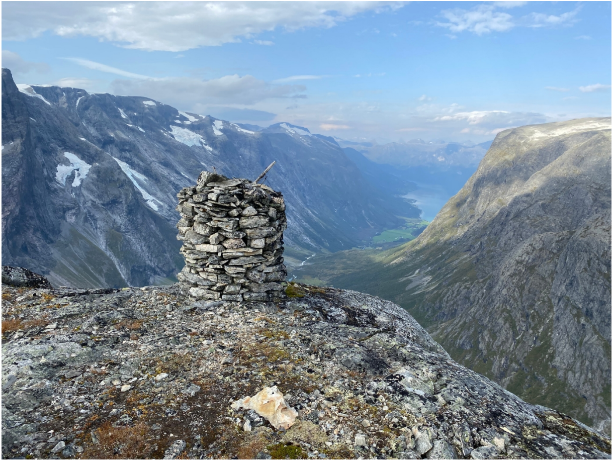
Figur 7: Toppen av Strynekåpa, utsikt ned i Erdalen.