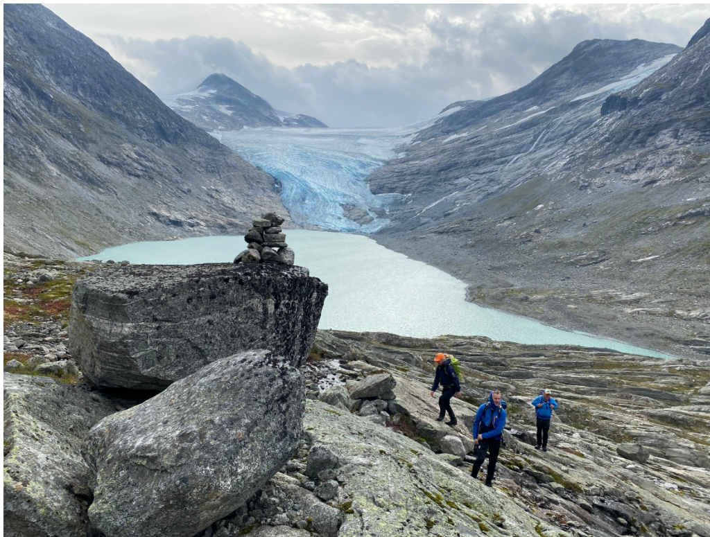
Figur 5: Første varden på veg mot Strynekåpa. Denne ligg kring 170 meter i luftlinje over stien til Infimus.