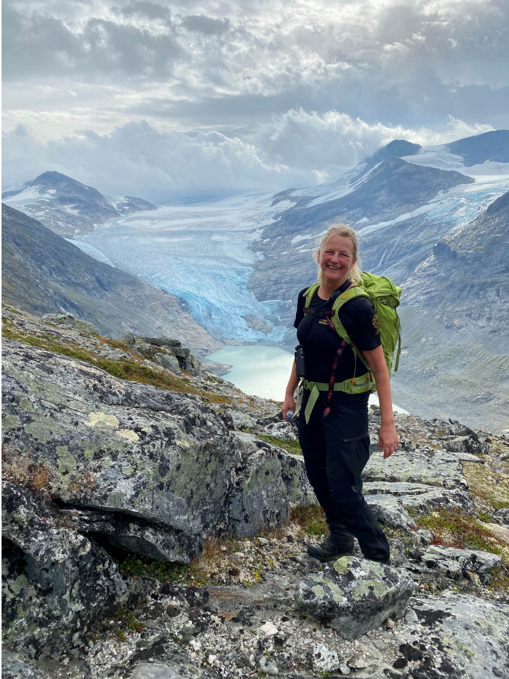
Figur 6: Fin utsikt på veg opp.