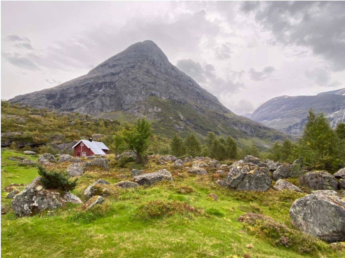
Figur 2: Bilete av Vetledalsseter med Strynekåpa bak.