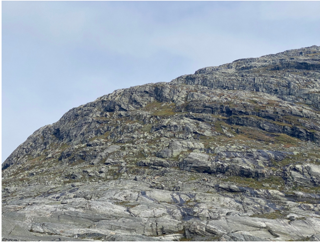
Figur 4: Bilete frå Infimus mot Strynekåpa.