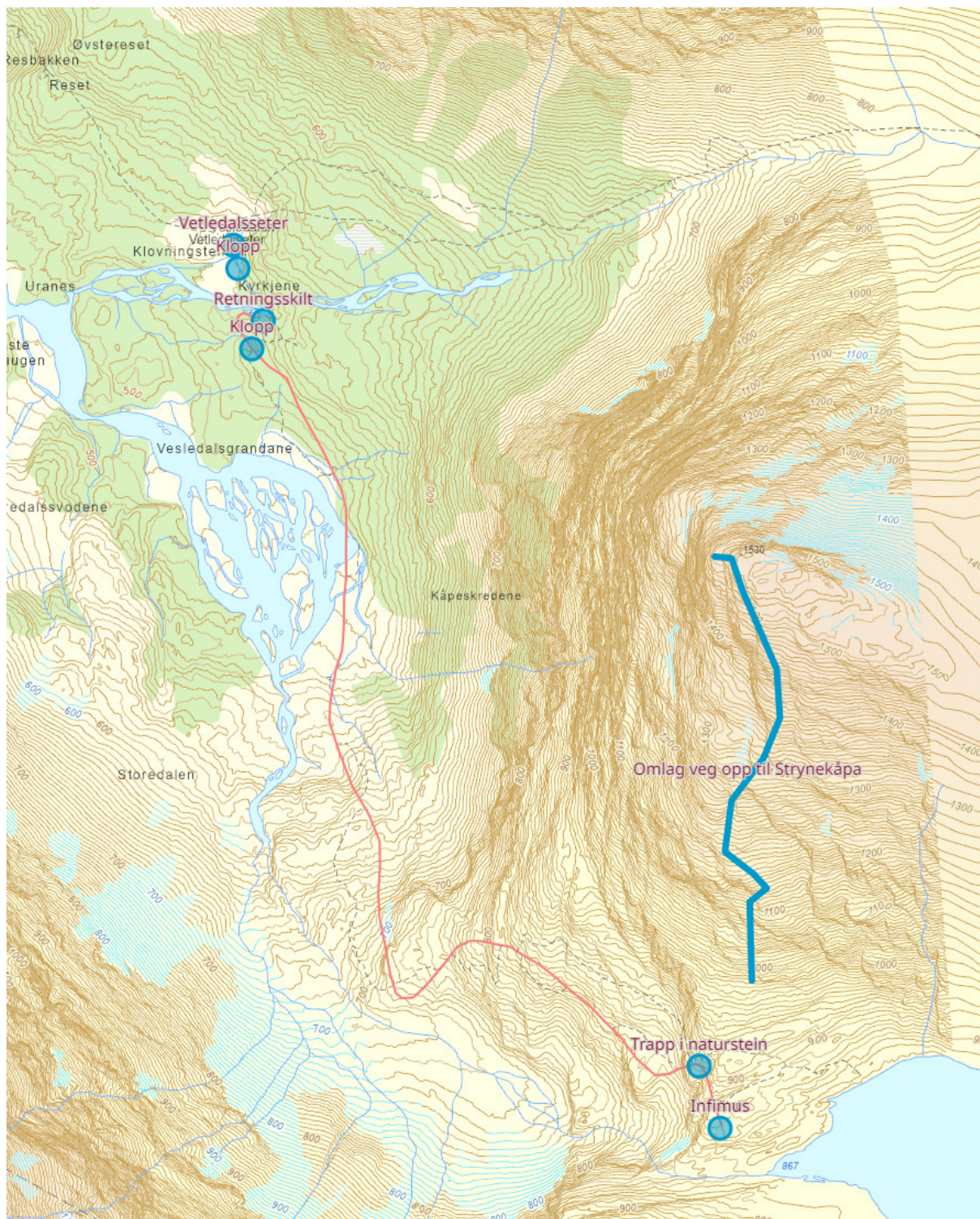
Figur 1: Kart som viser omlag kor ulike tiltak er planlagt.

Søknaden er vurdert i samsvar med - Forskrift om vern av Jostedalsbreen nasjonalpark.