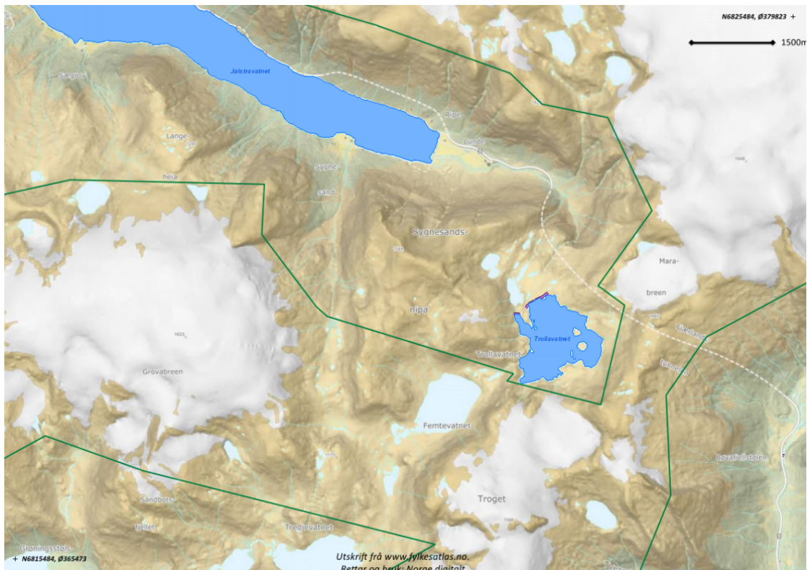
Kart 2: Trollavatnet og omkringliggjande områder med justerte grenser av 2017 for samanlikning av plassering av bekkeinntak i høve nasjonalparkgrenser. Legg merke til grensejusteringar i nordaustre del av nasjonalparkgrense og Syngnesands-området for justeringar.