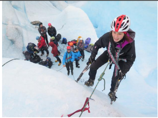
Breisen er fasinerende å bruke til leik og mestring under trygg rettleiing