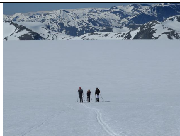
Den sentrale høgrepolitikaren Nikolai Astrup, i lag med foreldra sin, var tre av ei gruppe på 20 som kryssa nasjonalparken frå Befringsstøylen i Jølster til Flatbrehytta og Fjærland som SNO fekk vere turleiar for denne vakre junidagen.

Formidling om vern, naturforhold og liknande er ein viktig del av arbeidet til SNO. Vi synast att med SNO-logo på klede og bil noko som gjer at publikum har høve til å ta kontakt. Stateistikken i Feltdagboka viser at til saman 747 personar er «informert» (snakka med om nasjonalparken og liknande) gjennom tilfeldig møte ute på oppsynsturar og 188 personar gjennom føredrag og informasjonsmøte mm. Fleire av oppsynsturane og mange av turane knytt til oppfølging av tiltak er gjerne i lag med grunneigarar eller andre «brukarar» av nasjonalparken.