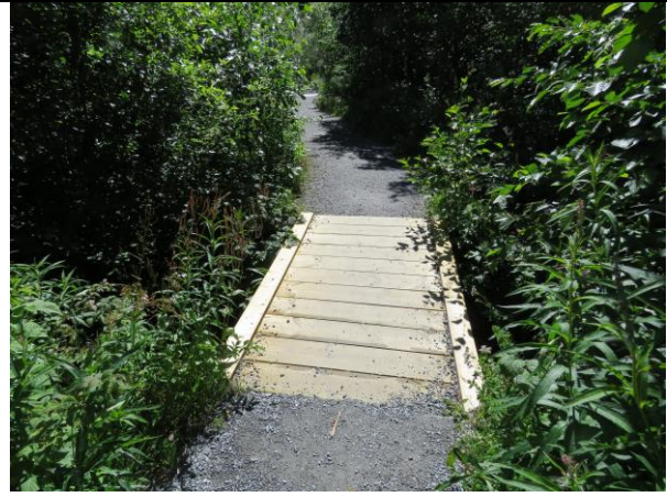
Brua er reparert med nye bord og held seg godt i ein del sesongar til.