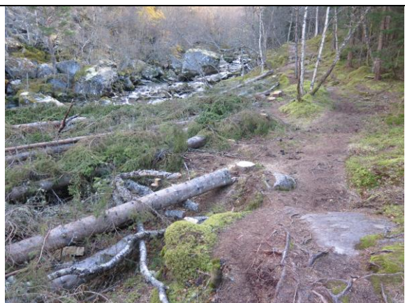
Tiltaket for å fjerne gran er starta opp langs stien mot Sunndalsetra