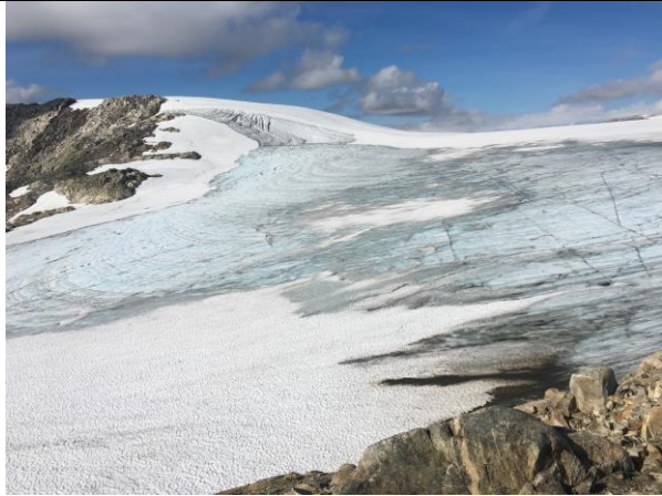
Steindalsbreen, i Sogndal kommune, er ein av mange små og "bortgøynde" brear i nasjonalparken.