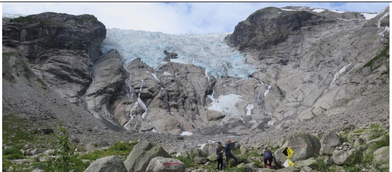
Turistane gjekk ikkje lengre inn mot Bergsetbreen og Baklibreen enn til informasjonskiltet om steinsprangfare og israsfare då SNO var på oppsynstur.

Alle breinformasjonsskilta har stått ute heile vinteren utan å ha tatt vesentleg skade av det. Det vil vere for arbeidskrevjande å ta ned alle slik ein ser seg nødt til å gjere ved Nigardsbreen.