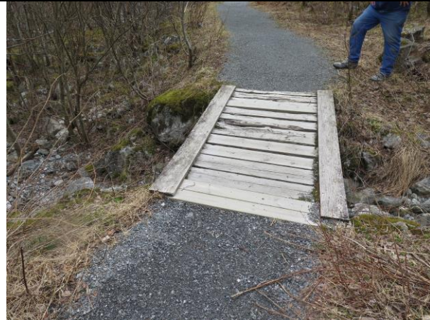
Den vesle brua på den universelt utforma stien i Kjenndalen trengte å bli vøla før turistsesongen.

Den kring 300 meter lange stien inst i Kjenndalen er utforma slik at det er mogleg å kome fram med rullestol og barnevogn. Område er mykje besøkt både av bussgrupper og andre. Tilrettelegginga her er i all hovudsak utført med midlar frå forvaltninga for ein del år tilbake og med innsats frå grunneigar og drivar av Kjenndalsstova. I år vart ei mindre bru og sittebenken på utsiktspunktet restaurert.