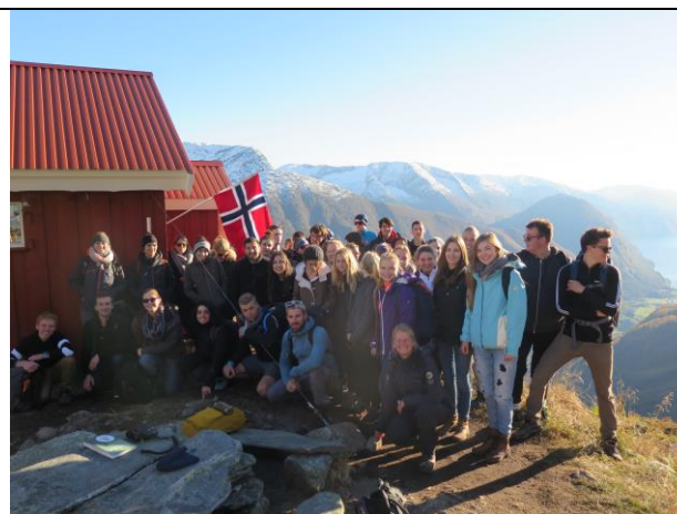
Studentar på internasjonale studiar ved ulike universitet i Noreg og Sverige fekk eit natursterkt inntrykk av nasjonalparken og Flatbrehytta denne oktoberdagen.

Andre arenaer for formidling og informasjon om Jostedalsbreen nasjonalpark i år har m.a. vore representasjon på Bremuseet si 25-årsjubileum og turleiar over breen dagen etter, formidling om natur og stirestauring for studentar frå Høgskulen i Sogndal og ein gjeng med internasjonale studentar og strategimøte for vidareutvikling av Jostedalsbreen nasjonalparksenter.