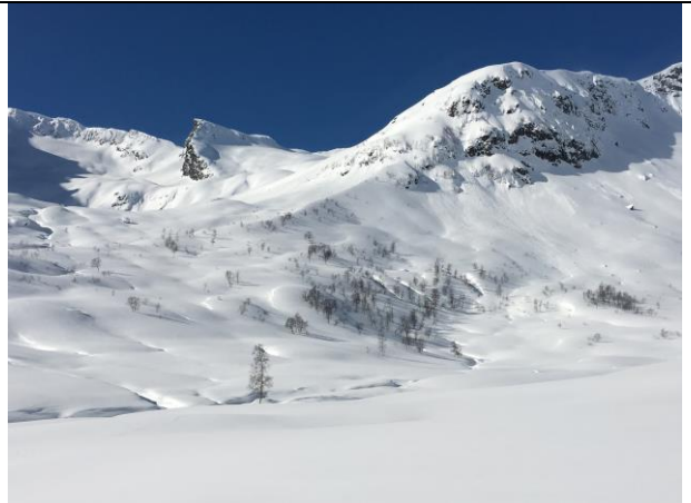
Gode sporingsforhold denne dagen innafor Anestølen i Sogndal kommune

SNO er også med i program for nasjonal overvaking av kongørn. Nokre aktuelle område er plukka ut for intensiv overvaking. For nokre kjente reirlokaltetar er SNO-lokal involvert og desse ligg alle utanfor nasjonalparkgrensa.