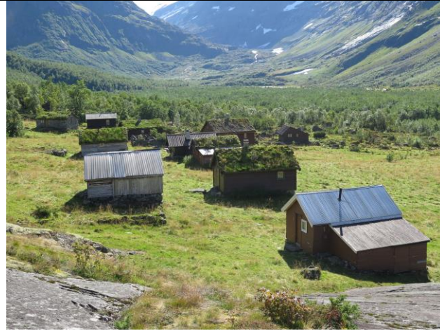
Alle bygningar på Erdalsetra er fotografert og registrert i år.