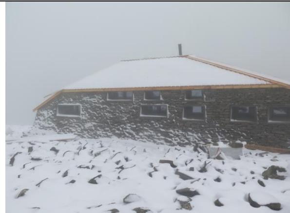
Den nye sikringshytta, Skålabu, ligg fint til i terrenget litt lågare enn tårnet.