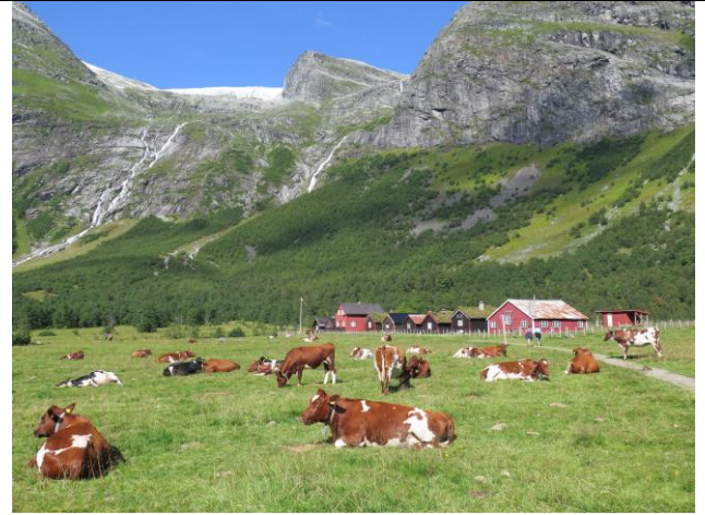
Også seterrekka på Bødalsetra og bygningar og bruar elles i området er lagt inn i verneområdeloggen.