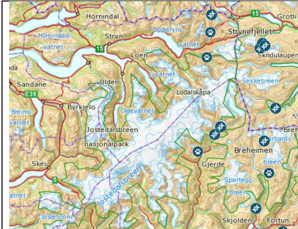
Kartutsnitt frå rovbasen: Sporsymbol viser dokumentert jervespor og dna-symbol viser dna-analysert møkk-prøve frå jerv