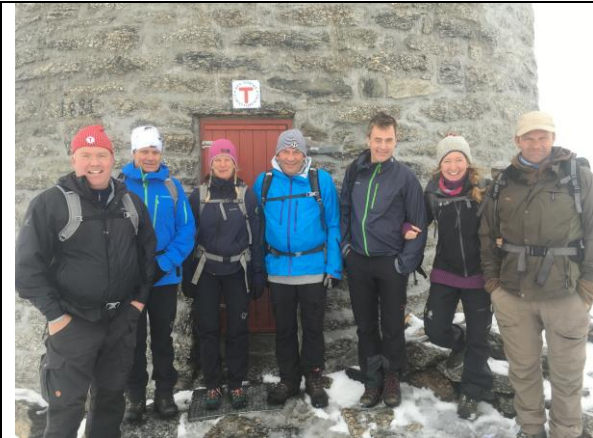
Delar av nasjonalparkstyre på synfaring på Skålastien og heilt opp til Skålatårnet i nysnøen 2.september.