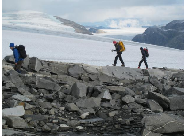
Ei gruppe på fire personar gjekk "manngard" langs breane kring Fåbergstølsnosi i Jostedalen for å leite etter framsmelte spor.