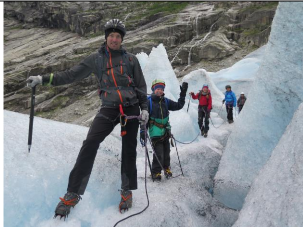
"Fotomodellane" under filming på Nigardsbreen