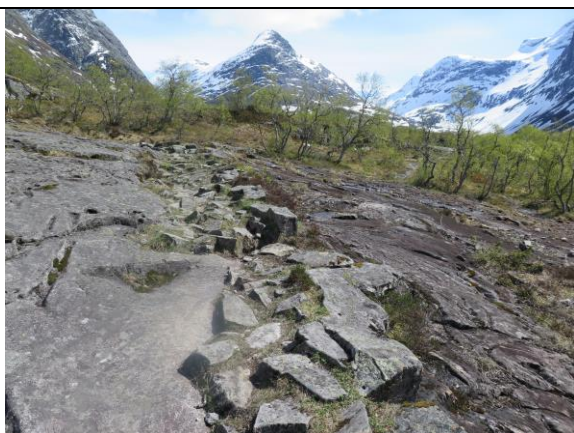
Den gamle oppbygde stien inn mot Erdalsetra har trong for restaurering

Gjennom sommaren var det synfaringar på begge bufarsvegane/kuråsene inn både Sunndalen og Erdalen. Desse stiane har tidlegare begge vore meir eller mindre tilrettelagt for å føre fram storfe. Delar av strekinga treng omfattande restaurering, medan det på andre parti er naudsynt med nye tiltak ettersom storfe i dag er tyngre og dårlegare til beins enn tidlegare. Utmarksressurs as har laga til rapportar med tilråding for tiltak og kostnadsoverslag. SNO har bistått noko undervegs.