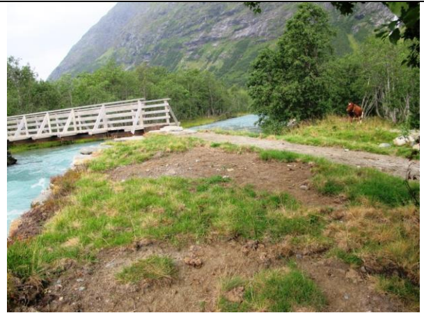
Revegetering litt over to månader etter att arbeidet var utført