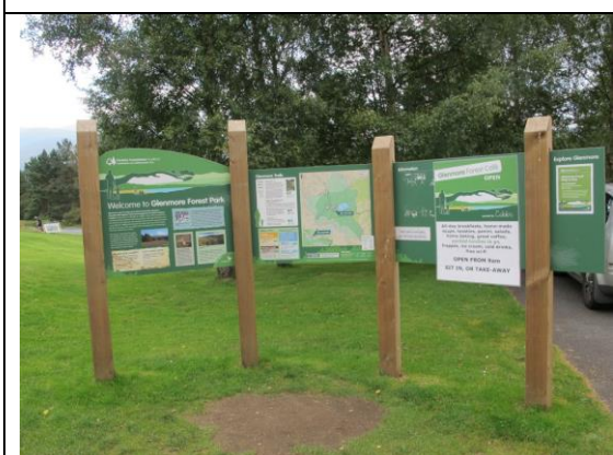
Informasjon som skogforvaltninga har sett opp i nasjonalparken