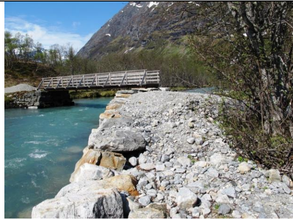
Det vart laga til ny og lenger mur i samband med oppattbygging av brua. Frå før revegetering.

Seint på hausten i 2010 vart den store brua over elva ved Bødalseter teken av flaum. Forvaltning og SNO hadde høve til å bistå med oppattbygging same hausten og det vart gitt løyve på naturskademidlar til arbeidet. På grunn av feil tolking av lovverk vart det eit overskjønn på tiltaket og slutføringa av arbeidet med å sette terrenget godt i stand igjen vart difor utsatt. Dette arbeidet bistod SNO med i sommar i lag med ein grunneigar. Det vart henta inn torv på ein stad der det raskt gror til og steinmuring og nærområdet ved brua er revegetert.