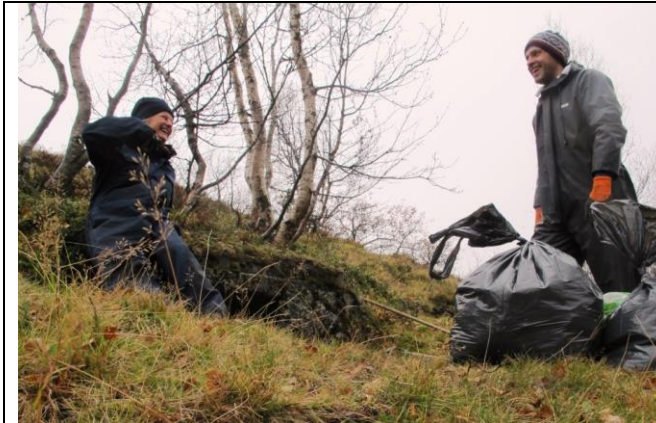
Litt av "fangsten" av dei 180 kg søppel frå jordkjellaren