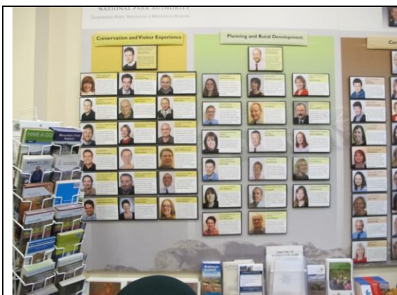
Over 60 tilsette i Cairngorm nasjonalpark

I september reiste nasjonalparkstyret på studietur til Cairngorm nasjonalpark i Skottland. Det gav mykje inspirasjon og gode høve til diskusjon om heimlege utfordringar kring nasjonalparkforvaltning. SNO fekk vere med og skreiv eit referat frå turen som er tilgjengeleg på heimesida til nasjonalparkstyret.