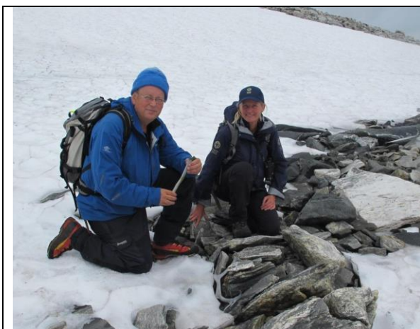
Figur 1 1800-metes høgd vart det funne gevir som er 2100 år gamle

Det er ikkje kjennskap til at det har gått rein i dette området i nyare tid. Difor vil òg gevira bli DNA-analysert for å finne ut kvar reinen kom frå.