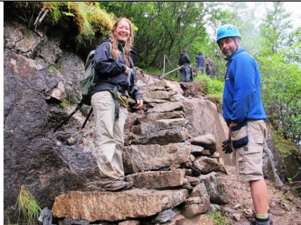
Ei stor forbedring på denne delen av stien opp Oldeskaret