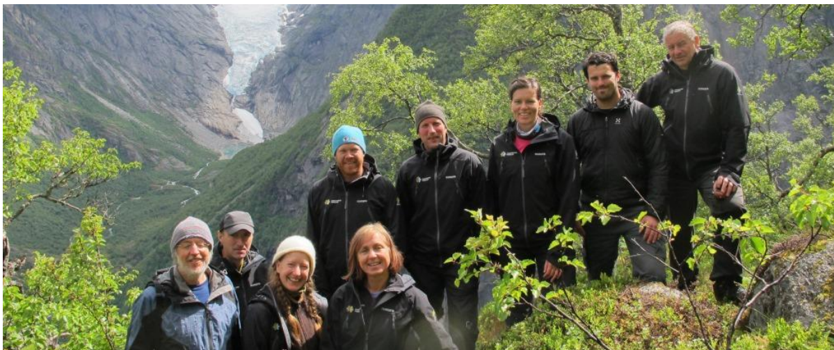
Her er alle forvaltarane samla på stien mot Oldeskaret med Briksdalsbreen i bakgrunnen.