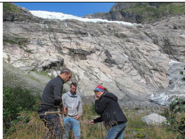
Både kommune, reiselivsaktørar, politi og nasjonalparken var med i flytting av informasjonsskilt og oppsetting av sperregjerde ved Bøyabreen i sommar

I fleire samanhengar var det difor viktig å formidle at vi har allemannsretten i Noreg noko som gjer at alle har eit eige ansvar for tryggleik når ein ferdast i utmark og at ferdsla der er fri når ein viser omsyn til landbruket og dyrelivet elles. Berre politiet kan difor juridisk nekte folk tilgang til natur viss det er fare for liv og helse. Likevel kjenner både reiselivet, kommunene og statleg forvaltning eit ansvar for å informere publikum om farane nær breane. SNO har i ei årrekke bidrege med utplassering og ettersyn av brefareskilt og sperringar. Dette bør vi sjå på som ei årleg oppgåve bestilt av nasjonalparkstyret. Ettersom det er fleire aktørar som er med «å trekker publikum» til breen, er det naturleg at alle bidreg i dette informasjonsarbeidet.