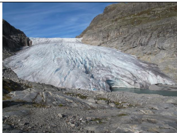
Haugabreen er i stadig meir i bruk til brevandring. Framføre denne brearmen har det ikkje vore noko informasjonsskilt om farane på/ved breen