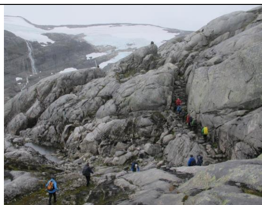
På toppen av Kamperhamrane er det frå gammalt av murt opp ei steintrapp i ei naturleg passasje i terrenget. Denne vart reparert i fjor