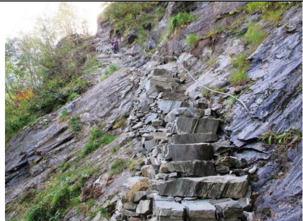
I nedre del av Oldeskaret er dette arbeidet utført i år