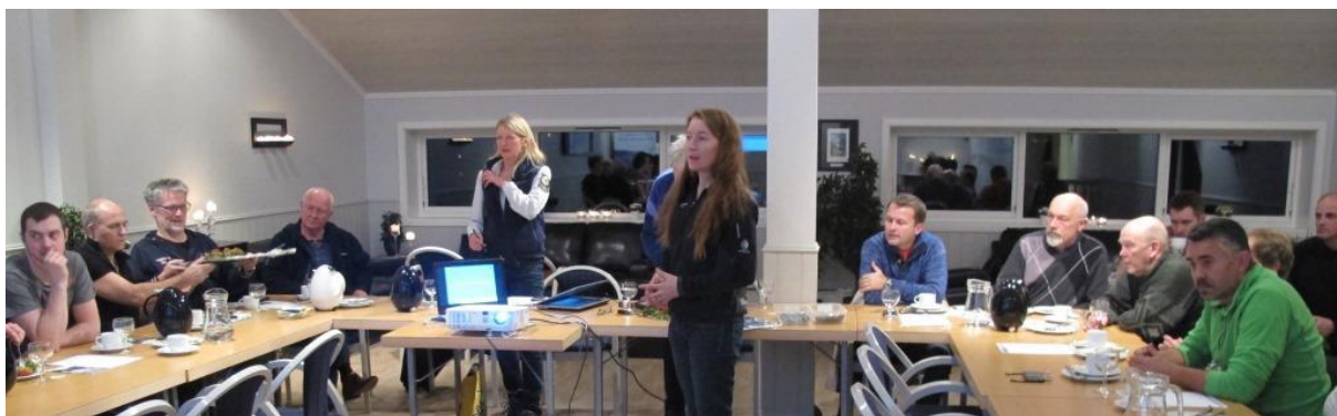
Bra frammøte på bygdemøte om forvaltningsplanen i Olden.

SNO har vore med på dei aller fleste bygdemøtene som vart haldne i samband med revidering av forvaltningsplan for nasjonalparken. Då har vi vist bilde og fortalt om tiltak som er utført. Dette var gode møte der mange fekk høve til å kome med innspel.