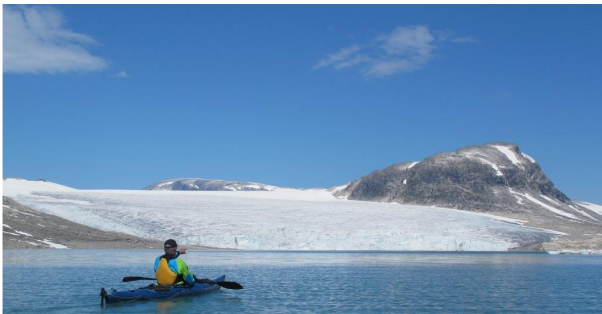
Styggevatnet er innfallsport til Austdalsbreen og Rundeggi i nasjonalparken - inst i Jostedalen

Bestillingsdialogen er formalisert gjennom eit skjemasystem (A,B og C-skjema), sjå vedlegg. Dette blir sendt til DN/SNO sentralt som prioriterer tiltaksdelen utifrå statsbudsjettet og nasjonale politiske føringar. Nokre større prosjekt bruker å bli løfta fram for å få fram ”fyrtårn-prosjekt” som kan vare over fleire år. Skålastiprosjektet har vore eit slikt. Trongen for midlar er ulike i verneområda og kan variere frå år til år.