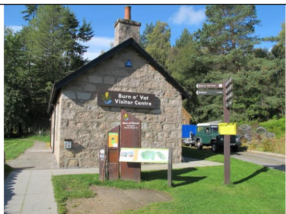
Ingen store men mange små nasjonalparksenter i denne nasjonalparken