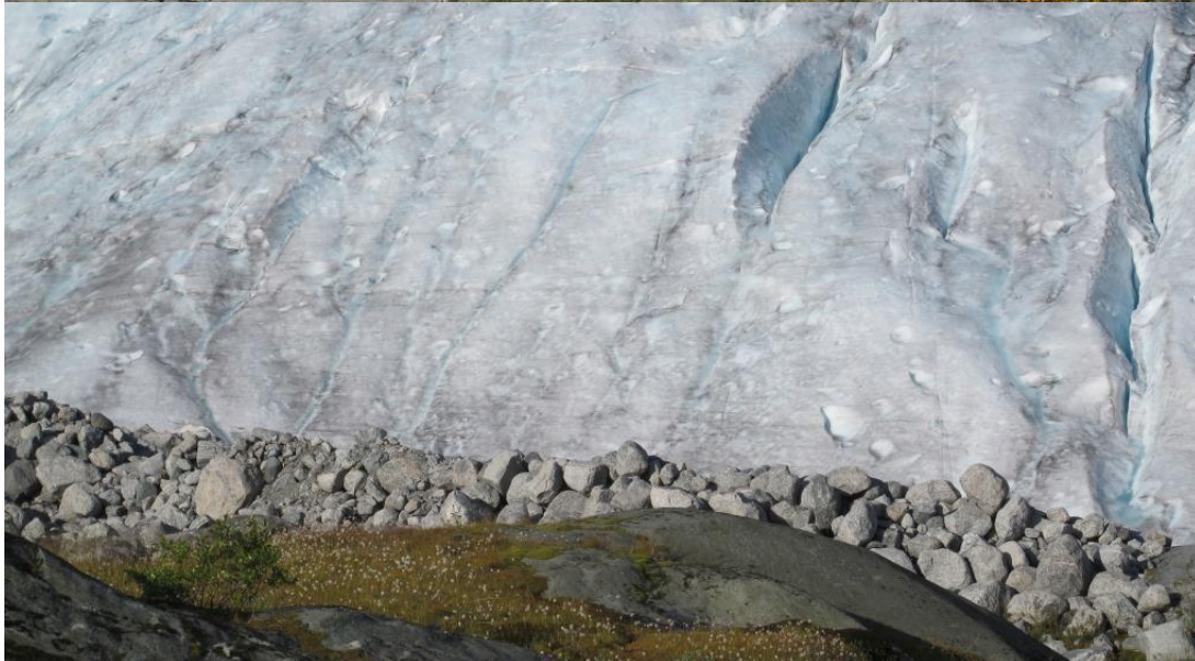
Brenndalsbreen, Briksdalsbreen, Tuftebreen og Brenndalsbreen