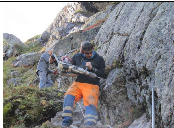
Ein god del gammel streng er bytta ut med wire i Lundeskaret