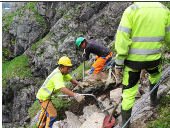
Arbeid i bratt terreng i Lundeskaret