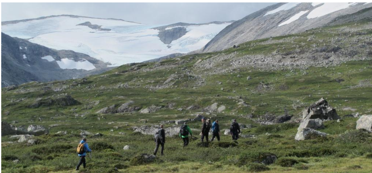
Turfølgje på veg vestover. Her frå strekninga mellom Nedre og Ytste Leirvatnet, med utsikt sørover mot Sekkebreen

Den gamle ferdsleveggen mellom Raudalen i Skjåk og Sunndalen i Stryn er plukka ut av Riksantikvaren og DNT for å synleggjerast som eit ferdsels-kulturminne. Kamperhamrane er ein del av denne strekninga og denne vart utbetra og reparert i fjor. SNO arrangerte difor i år ein fellestur på heile strekninga der alle aktuelle parter var invitert. Me hadde båtskyss over Raudalsvatnet og gjekk så nærare 30 km før vi var nede i Sunndalen. Alle fekk gode høve til å oppleve dette flotte område og diskutere utfordringar kring villrein, ferdsel, merking, hytte, vedlikehald av kulturminne mm.