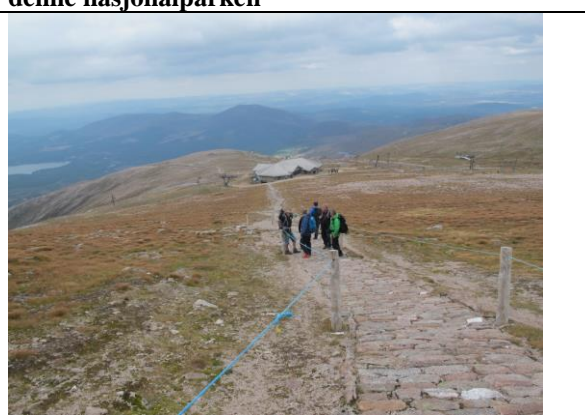
Kraftig tilrettelagt sti i mykje besøkt fjellområde av nasjonalparken