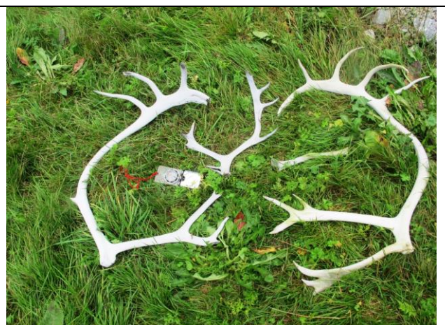
Dei gamle gevira som vart funnen ved framsmelta bre mellom Kjenndalen og Nesdalen.