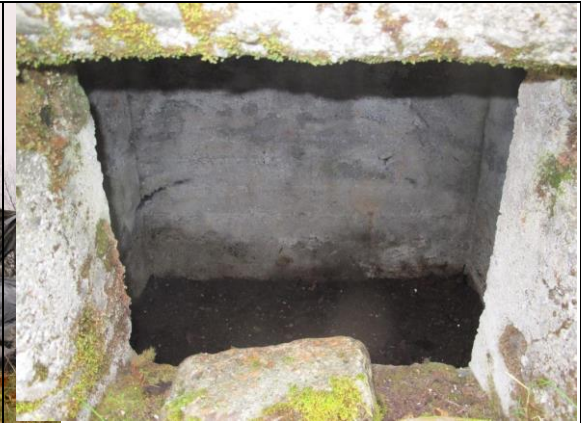
Tom jordkjellar etter utført arbeid