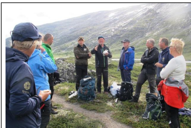
Mykje å lære undervegs på turen frå Raudalen til Sunndalen. Her høyrer turfølgje på kva ordføreren i Skjåk har å fortelja.