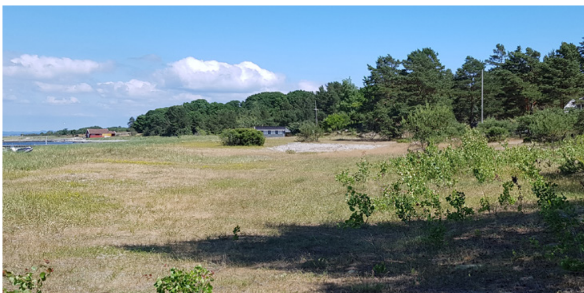
Figur 36. Sandbakken, Jomfruland, 13. juni 2018. Bildet er tatt noe mer fra venstre enn bildet over.