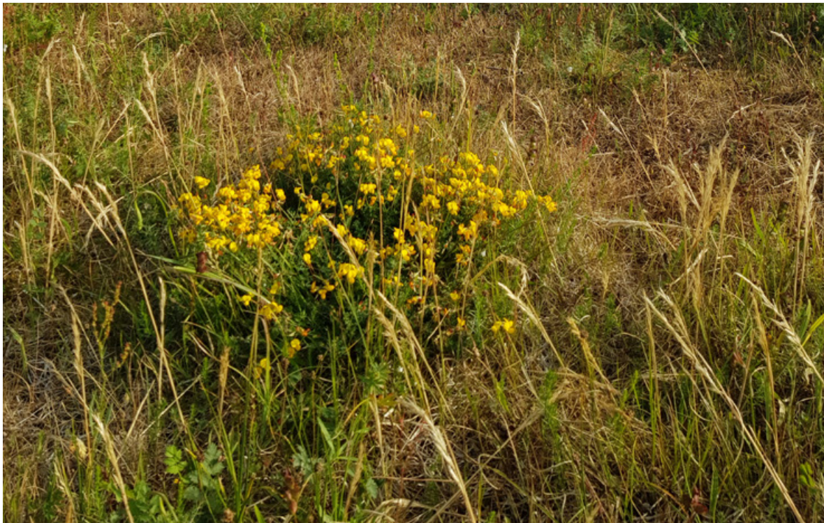
Figur 42. Det vil være viktig for strandmurerbie at det er en rik flora av nektarplanter. Tiriltunge (bildet) er en av de artene som er nevnt som viktige for arten.

Forslag til bevaringsmål: Strandmurerbie skal kunne påvises i området med minst ti voksne individer. Trolig er ikke dette nok for å ha en bærekraftig populasjon totalt sett, men dersom man legger til at man ikke finner alle individene og at de har noe varierende flyvetid, kan trolig dette være et greit utgangspunkt.