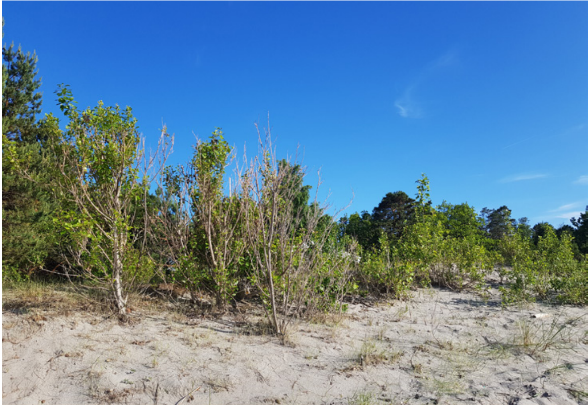
Figur 39. Balsampoppel i spredning ved 32V 534995 6526896. Dette er en art som har svært høy risiko (SE) på fremmedartslista 2018. Denne bør fjernes.