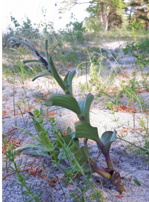
Figur 30. Rødflangre er en art som på Sandbakken, Jomfruland, også kan finnes i skogkanten og ut mot dyneheia.