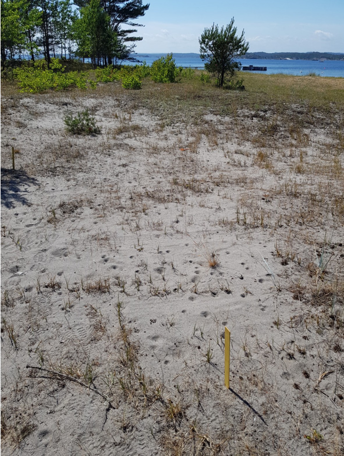
Figur 38. Dette bildet fra Sandbakken, Jomfruland, 13. juni 2018 illustrer flere ting. 1) Osperøninger er i ferd med å krype utover dyneheia i toppen av bildet. Det er de samme man ser på figurene 33–34, slik at dette trolig er en prosess som går nokså seint. 2) kjørespor og tråkk i sanden. 3) Mye strandstarr, men først og fremst mange fangstgroper av strandmaurløve.