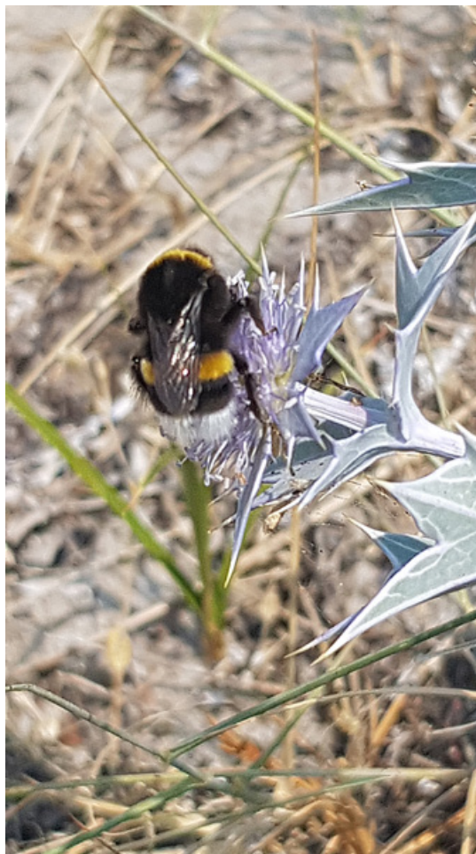
Figur 47. Jordhumle på strandtorn, her fra Danmark. En rekke ulike insekter kan bidra i pollineringen av strandtorn (se Isermann & Rooney 1992).

Vi anbefaler ingen konkrete tiltak for strandmaurløve på det nåværende tidspunkt, siden situasjonen for denne arten nå må anses som meget bra på Sandbakken. Derimot er det spesielt viktig å få avklart situasjonen for strandmurerbie, og gjort både tiltak og kartlegging av denne arten. Videre er det viktig å fortsette overvåkingen av strandtorn, samt å gjøre ytterligere tiltak for å sikre denne artens overlevelse på Sandbakken.