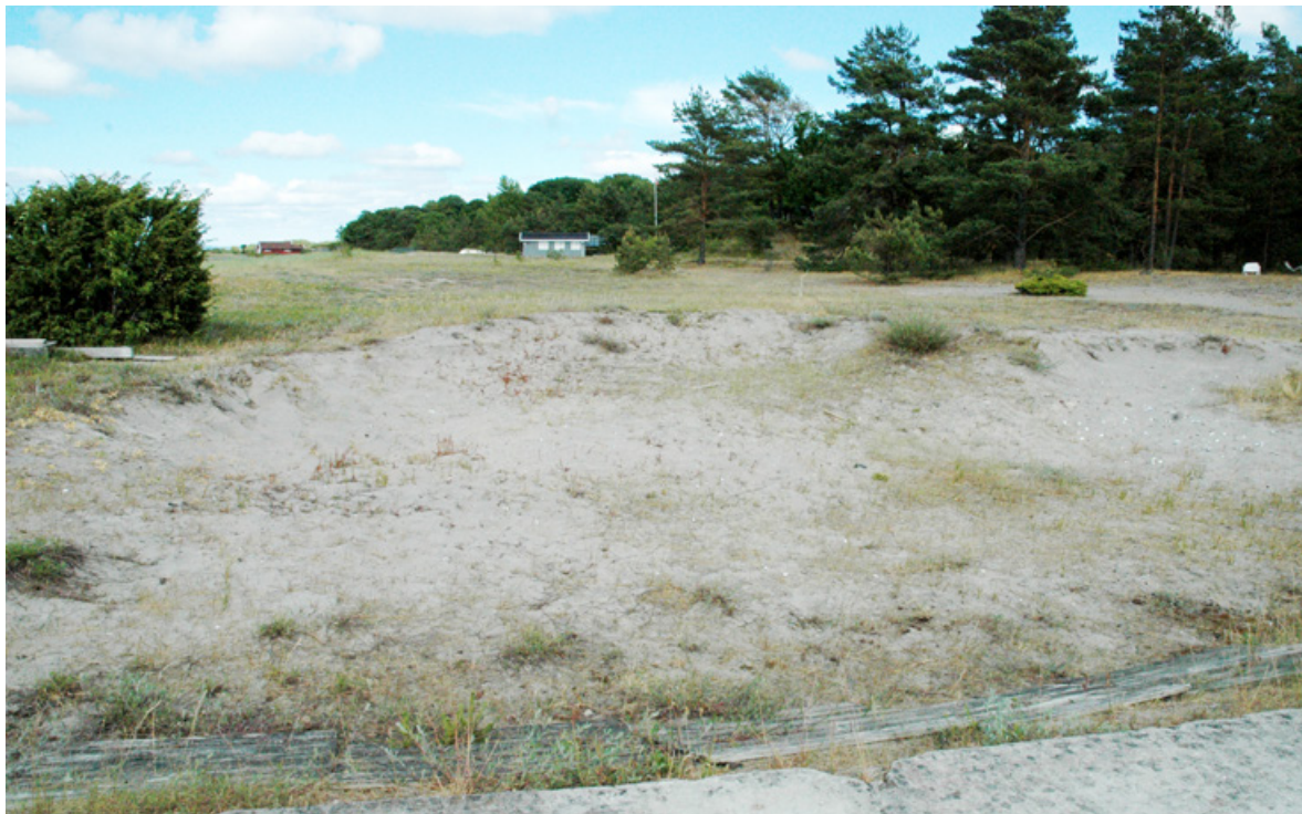
Figur 33. Et gammelt sandtak sentralt på Sandbakken, Jomfruland 14. juni 2008.

Innenfor det aktuelle området finnes flere fritidseiendommer. Det er tre brygger i området (i tillegg til hovedbrygga på Øytangen). To av disse var innenfor tidligere Sandbakken naturreservat (Silsand 2010). Det er noe motorferdsel i området i forbindelse med vedlikehold av brygger og opptak/utlegging av båter (se retningslinjer i Styret for Jomfruland nasjonalpark 2018).