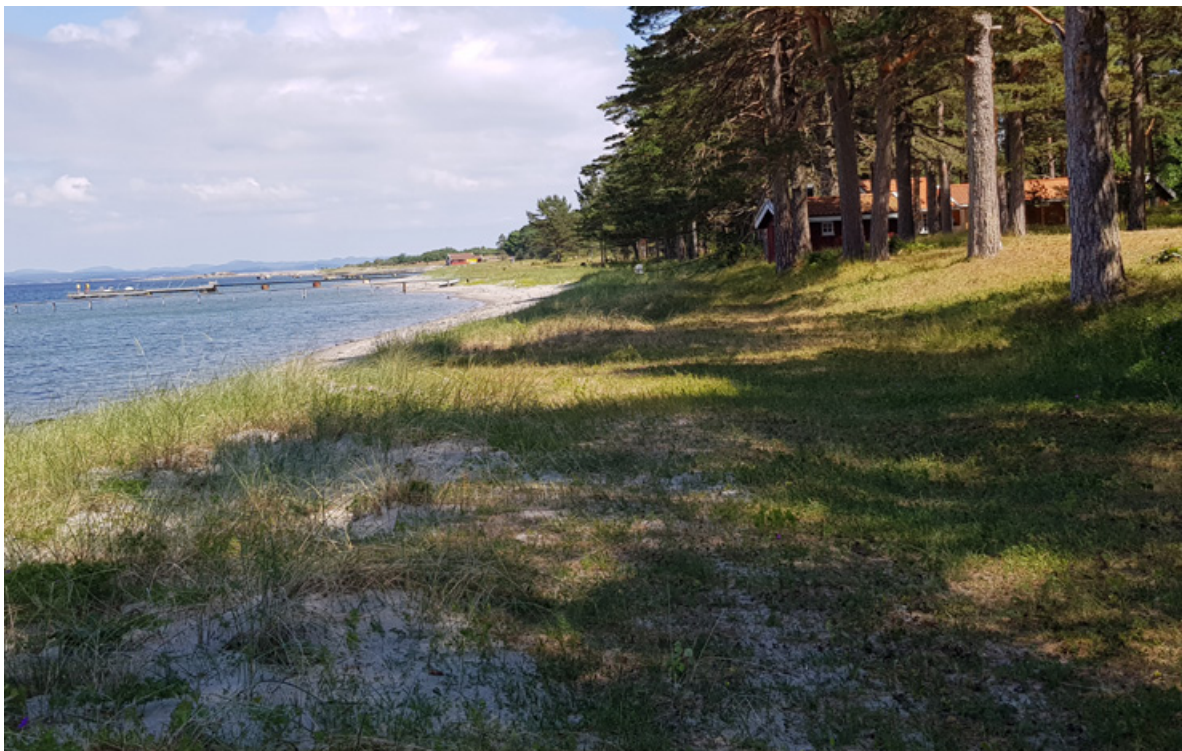
Figur 31. Sør på Sandbakken er sanddynemarka nokså smal mot furuskogen, delvis grensende til fritidsbebyggelse. Skogen gir skygge på sanddynemarka som trolig gjør den mindre attraktiv for solelskende insekter.