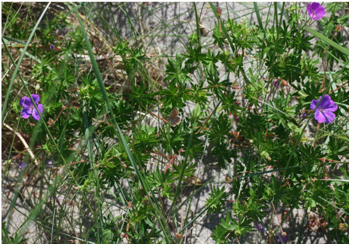
Figur 28. Blodstorknebb og sankthansblåvinge Aricia artaxerxes er to arter som forekommer nokså tallrike på dyneheia på Sandbakken, Jomfruland.