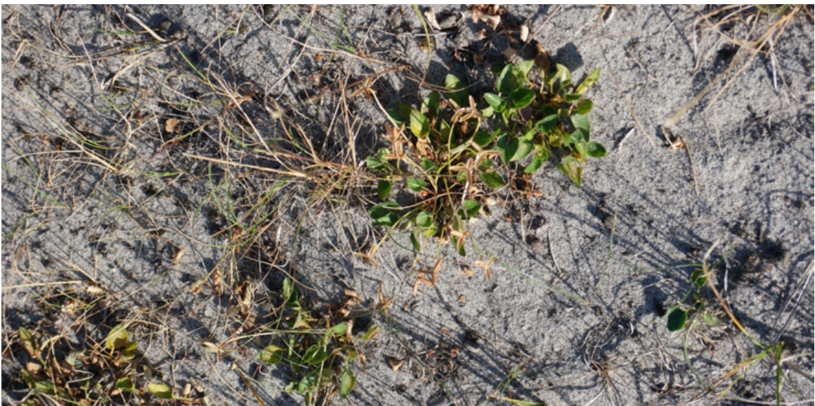
Figur 12. Det er stedvis en del engfiol på Sandbakken, Jomfruland, en plante som trolig kan utgjøre materialet til ynglekammer for strandmurerbie.