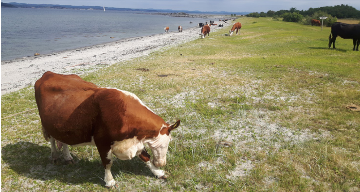
Figur 37. Helt nord på Øytangen, Jomfruland, er det beite av storfe. Dette er utenfor området som undersøkt. For forvaltningen av strandtorn må området derimot ses i sammenheng med områdene lengre sør, siden det her også er påvist strandtorn (etter utplanting).