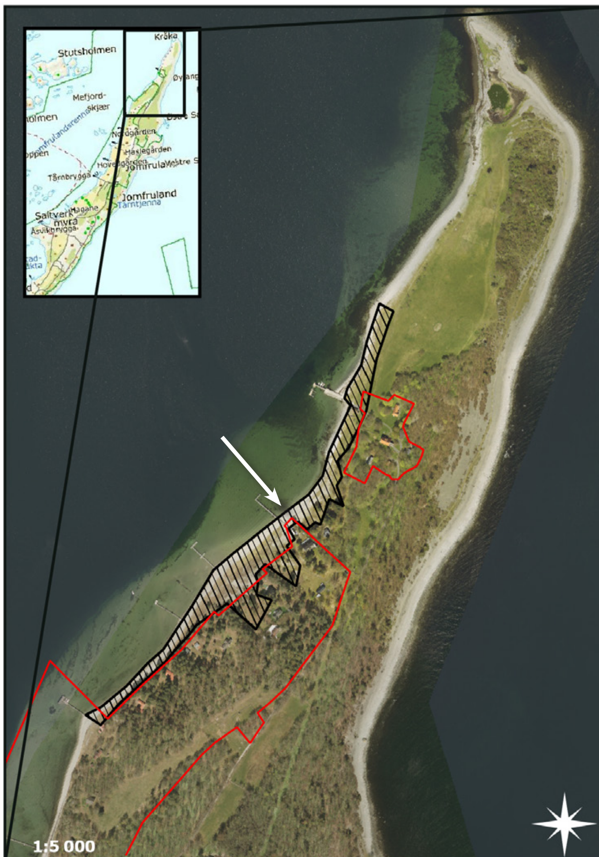
Figur 6. Øytangen på Jomfruland i Kragerø kommune. Det svarte skraverte området illustrerer området som ble kartlagt i denne undersøkelsen. Hovedfokuset ble gitt på det sørvestre området som tidligere var Sandbakken naturreservat (sørvest for hvit pil), mens området i nord ble undersøkt noe mer overfladisk. Kart: Anders Endrestøl, kartgrunnlag: Norge digitalt, Nedre Telemark jordskifterett.