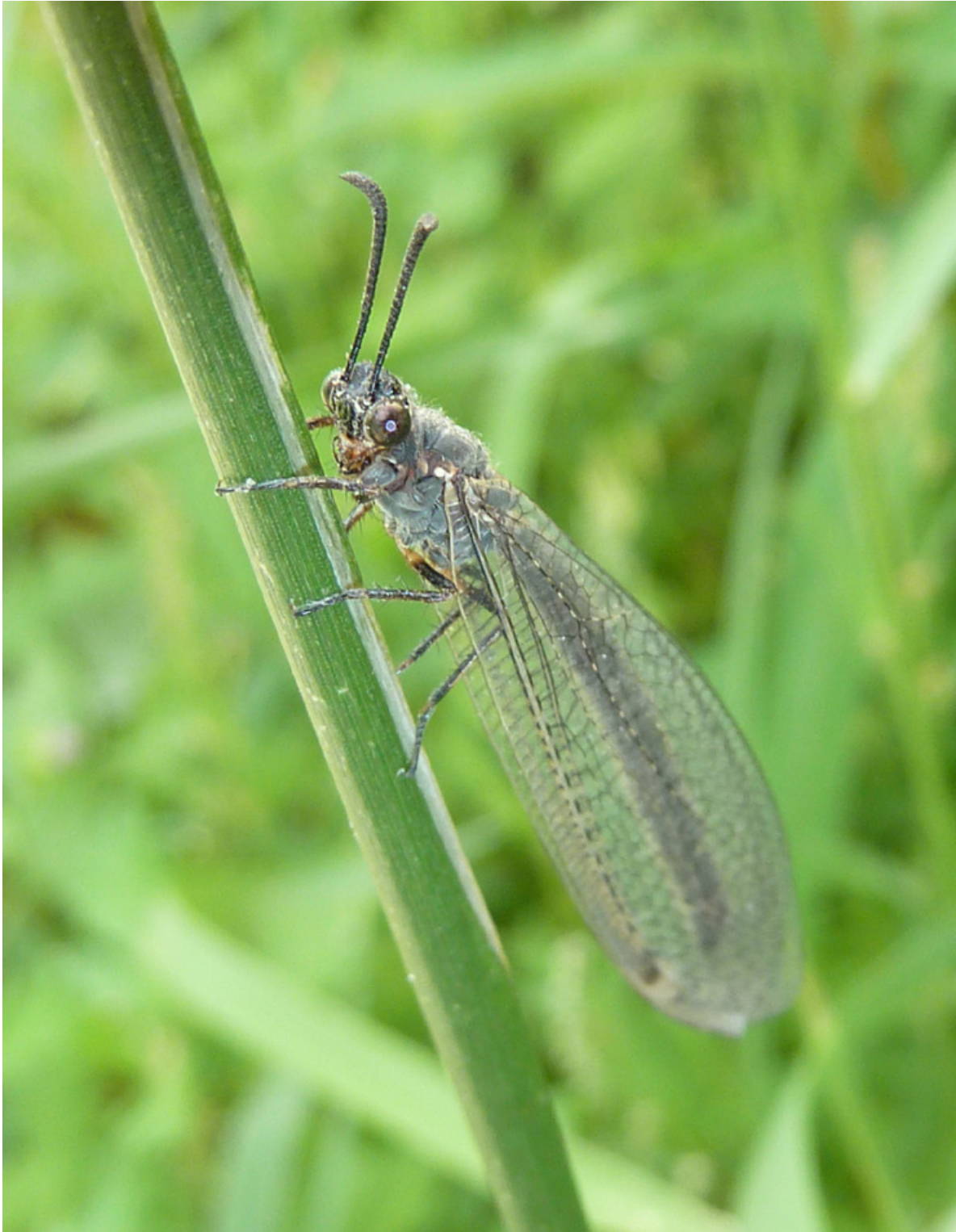
Figur 2. Et voksent individ av strandmaurløve Myrmeleon bore . Strandmaurløve er en nettvinge som finnes på omkring 20 strandlokaliteter i Norge fra Jomfruland til Hvaler.