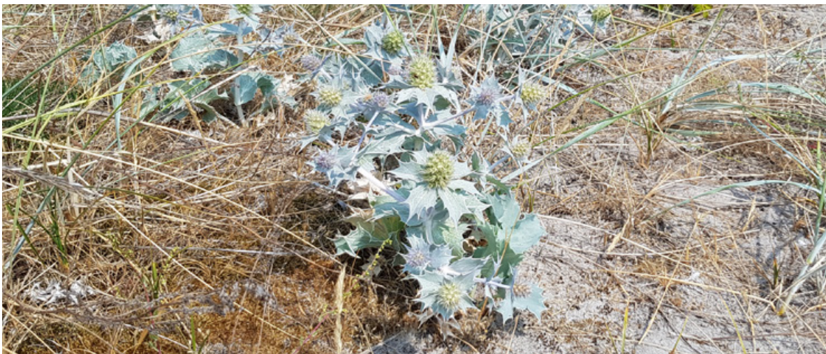
Figur 4. Blomstrende individer av strandtorn Eryngium maritimum .

Strandtorn er vurdert som sterkt truet (EN) på grunn av tilbakegang, fragmentering, sårbare og truede voksesteder, og lavt individtall (B2a(i)b(i,ii,iii,iv,v); C1+2a(i,ii)) (Henriksen og Hilmo 2015).