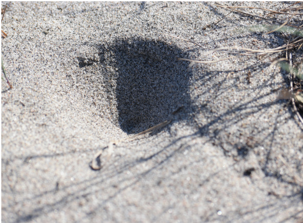
Figur 8. En aktiv fangstgrop av strandmaurløve er nesten perfekt konisk, med bratte vegger og et klart definert endepunkt. Rett under overflaten sitter maurløvelarven og venter på et tilfeldig bytte.