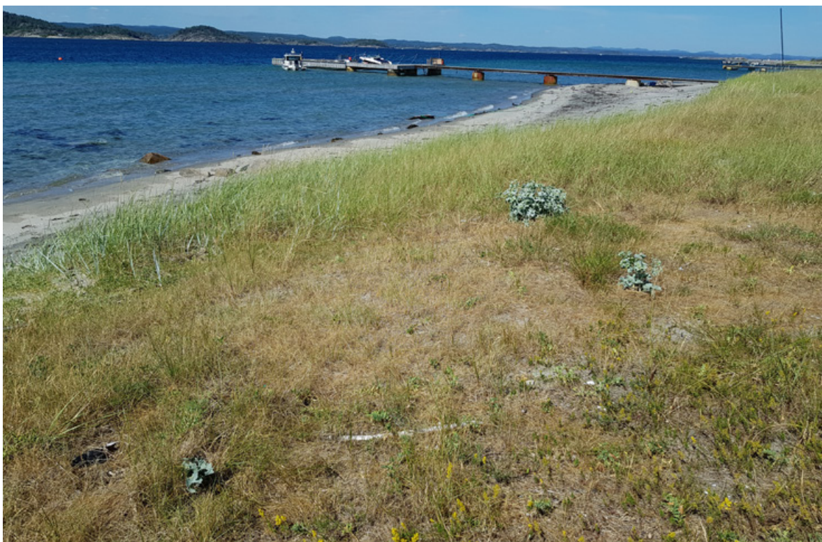
Figur 17. Tre strandtorn sentralt på Sandbakken, Jomfruland den 8. juli 2018.