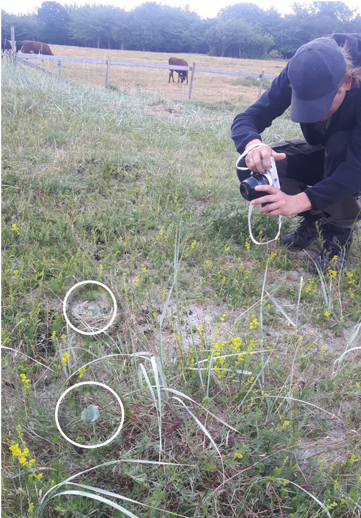
Figur 14. Strandtorn påvist helt nord ved det inngjerdede beitet (i hvite ringer) ved Øytangen, Jomfruland. Alle fire påvist der 13. juni var små. Den 8. juli ble kun tre av individene gjenfunnet.