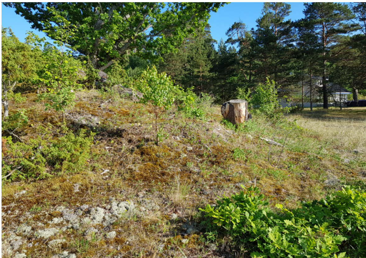
Figur 44. Samme kolle som over. Det burde være nok å skrape lett i overflaten av denne kollen for å skape åpne sandflekker. Dette kan gjøres manuelt uten bruk av maskiner.