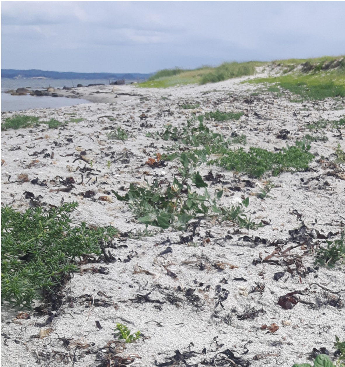
Figur 22. På selve forstranda ved Øytangen og Sandbakken, Jomfruland, finnes et spredt vegetasjonsdekke av strandarve (bildet), og noen forekomster av arter som strandreddik, tangmelde, strandmelde, sølvmelde og sodaurt.

Forstrand og primærdyner (T21-C-1): På den ytterste delen av sandynemarka, ovenfor bølgeslagsonen mot annen vegetasjon og erosjonskanten, finnes det et samfunn av arter som er hardføre mot saltpåvirkning ( Figur 22 ). Her finnes først og fremst strandarve Honckenya peploides jevnt spredt, men også hist og her arter som tangmelde Atriplex prostrata , strandmelde Atriplex littoralis , strandkål Crambe maritima og strandreddik Cakile maritima . Her finnes også et par sjeldenheter som sodaurt Kali turida (VU) og sølvmelde Atriplex laciniata ( Figur 23 ). Forekomsten av sodaurt har trolig variert på Jomfruland, men er observert tidvis der de senere år. Vi fant kun to relativt små forekomster. Sølvmelde ble meldt som ny for Jomfruland av Odland (1999), og er siden registrert sporadisk. Den har sin hovedutbredelse på Lista og Jæren, og ellers funnet spredt langs kysten fra Hordaland til Østfold (men ikke i Aust-Agder). På grunn av sjeldne planter i denne sonen, bør man forvalte denne hensynsfullt. Av samme grunn er det hensiktsmessig at rekreasjon (hovedsakelig badegjester), som i dag, konsentreres på området nord for hovedbrygga til Øytangen, mens man i tidligere Sandbakken naturreservat i mindre grad bør tilrettelegge/tillate rekreasjon. Sporadisk ferdsel av turgåere o.l. vil være et mindre problem.