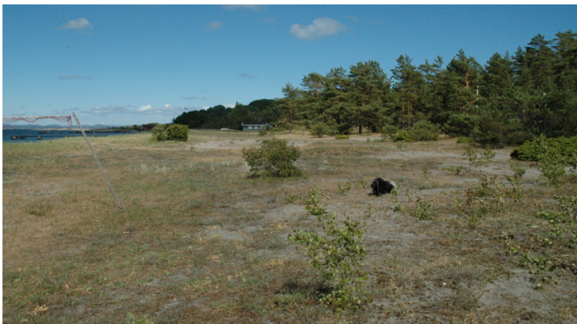
Figur 35. Sandbakken, Jomfruland, 14. juni 2008.

Friluftsliv og allmenn ferdsel er nokså begrenset i området. Hovedsakelig skyldes slitasjen aktiviteten til brukere av fritidseiendommene. Også dette er totalt sett begrenset, siden det er delvis faste opparbeidede stier mot bryggene og ellers på området. Historisk har det dessuten vært et lite sanduttak der ( Figur 33–34 ). Dette har i ettertid vist seg å være et viktig område for en rekke sjeldne insektarter, som strandmaurløve og strandmurerbie. Sammenligner man Figur 33 med 34 , og 35 med 36 , som er bilder av samme områder tatt med nøyaktig 10 års mellomrom, ser man dessuten at endringen har vært nokså liten og at gjengroing ser ut til å gå sakte (gitt at det ikke er holdt åpent av andre årsaker). På området har det gjennom tidene også vært forskjellig sporadiske slitasje som følge av volleyballbaner, trampoline osv. Det antas at dette totalt sett har begrenset negativ effekt, og kanskje snarere positiv effekt. Slitasjen er dessuten trolig noe begrenset gjennom året og antagelig størst i juli. Det kan nevnes at det nord for hovedbrygga ved Øytangen er et helt annet slitasjeregime som følge av beite ( Figur 37 ) og badeturister.