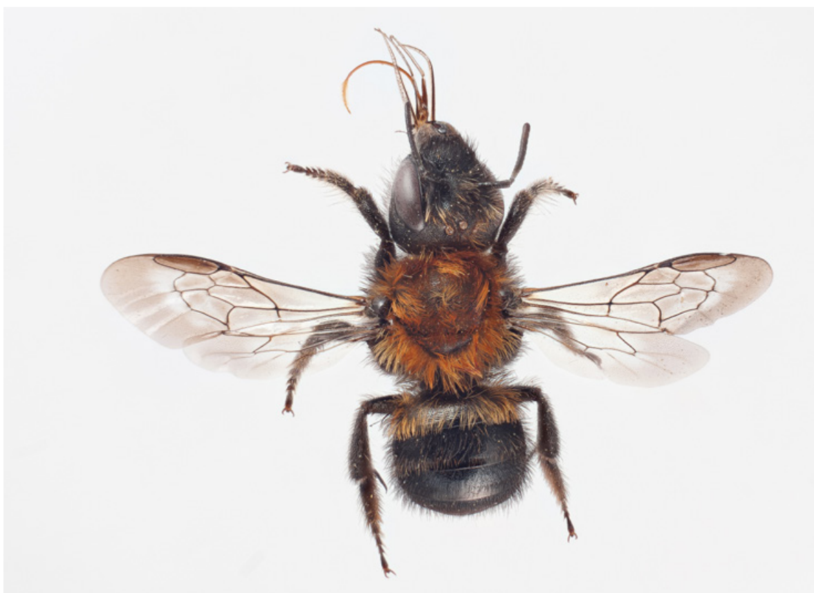
Figur 3. Hunn av strandmurerbie Osmia maritima . Strandmurerbie er en 10–12 mm lang solitær bieart som lever i sandynemark på et fåtalls strender i Sør-Norge.

Strandmurerbie er rødlistet som sterkt truet (EN) som følge av kraftig fragmentering, få lokaliteter og reduksjon av habitatkvalitet (B2a(i,ii)b(iii)) (Henriksen og Hilmo 2015).