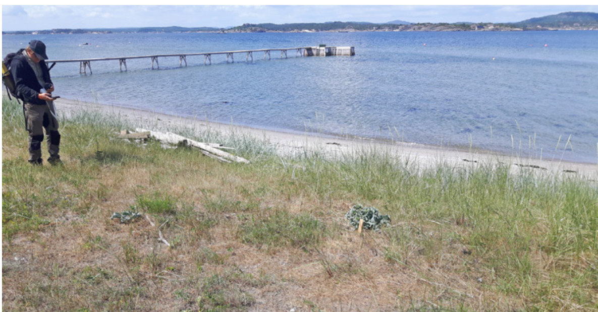
Figur 5. Plotting av strandtorn med Qfield (for Android) på Sandbakken, Jomfruland 13. juni 2018.

Det ble søkt etter strandmurerbie på ulike blomstrende planter og på tidligere angitte lokaliteter for arten. Det ble ellers utarbeidet kryssliste av samtlige planter, der interessante arter er kommentert videre. Det ble samtidig gjort en vurdering av aktuelle habitatforbedrende tiltak for de tre artene.