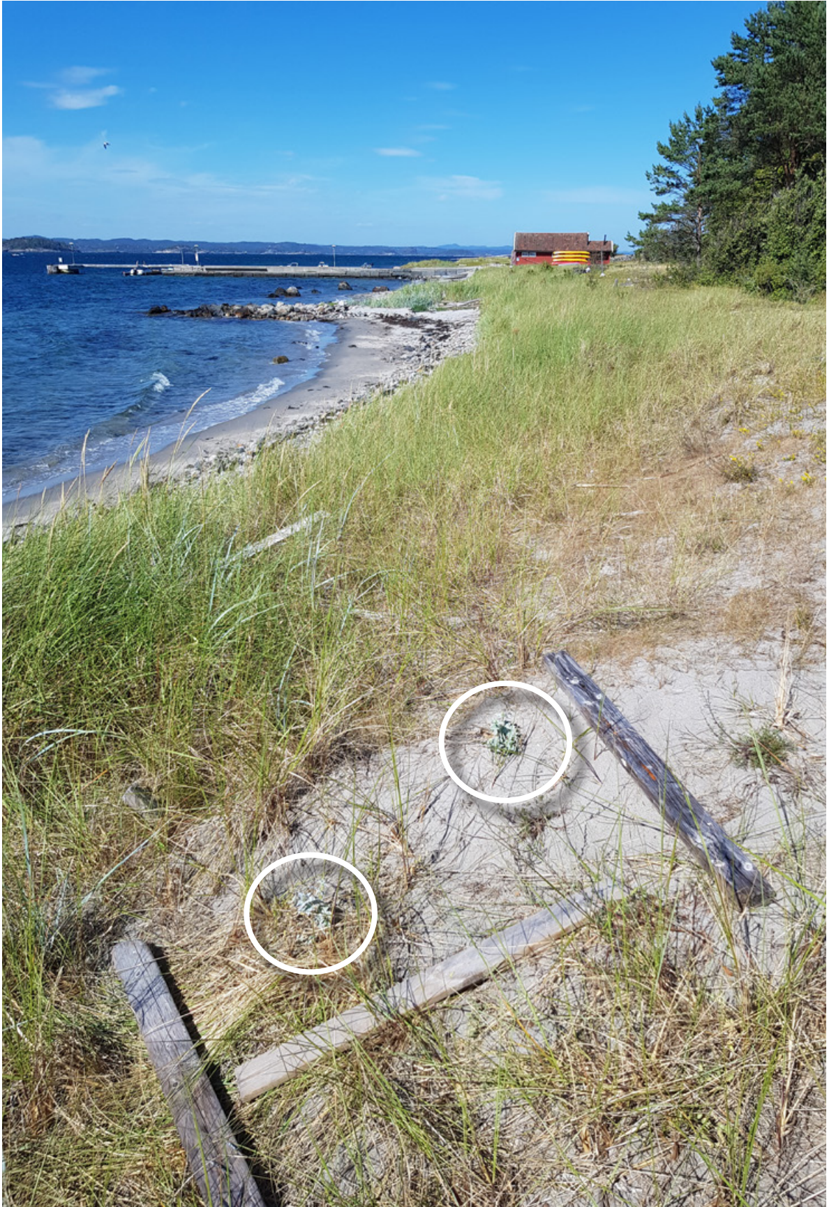
Figur 15. Strandtorn påvist litt sør for hovedbrygga til Øytangen, Jomfruland. Her ble det funnet tre planter både 13. juni og 8. juli 2018. På bildet ses to individer (hvite ringer).