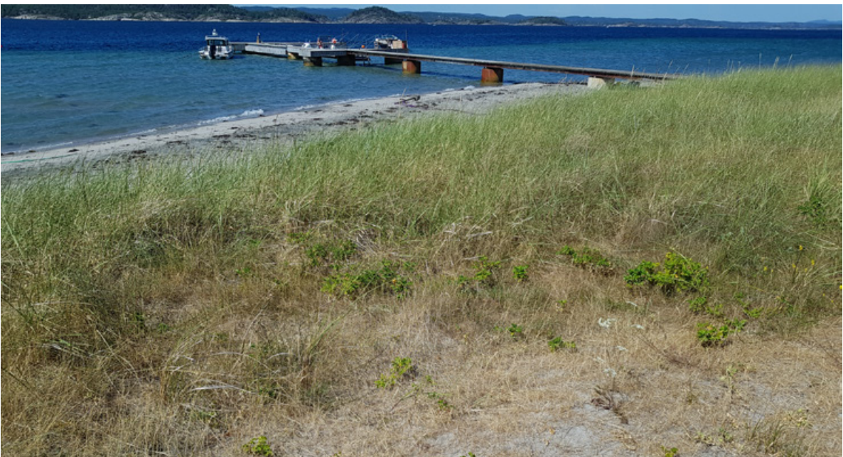
Figur 25. Rynkerose i etablering i brundyne og i overgangen til dyneheia innenfor på Sandbakken, Jomfruland 13. juni 2018. Det er også der man finner strandtorn, slik at det er viktig å overvåke spredning av rynkerose og fjerne denne med jevne mellomrom.