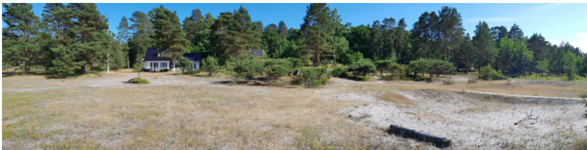
Figur 32. Panorama over sentrale deler av dyneheia på Sandbakken, Jomfruland. Denne naturtypen er ansett som sterkt truet (EN) i Norge.