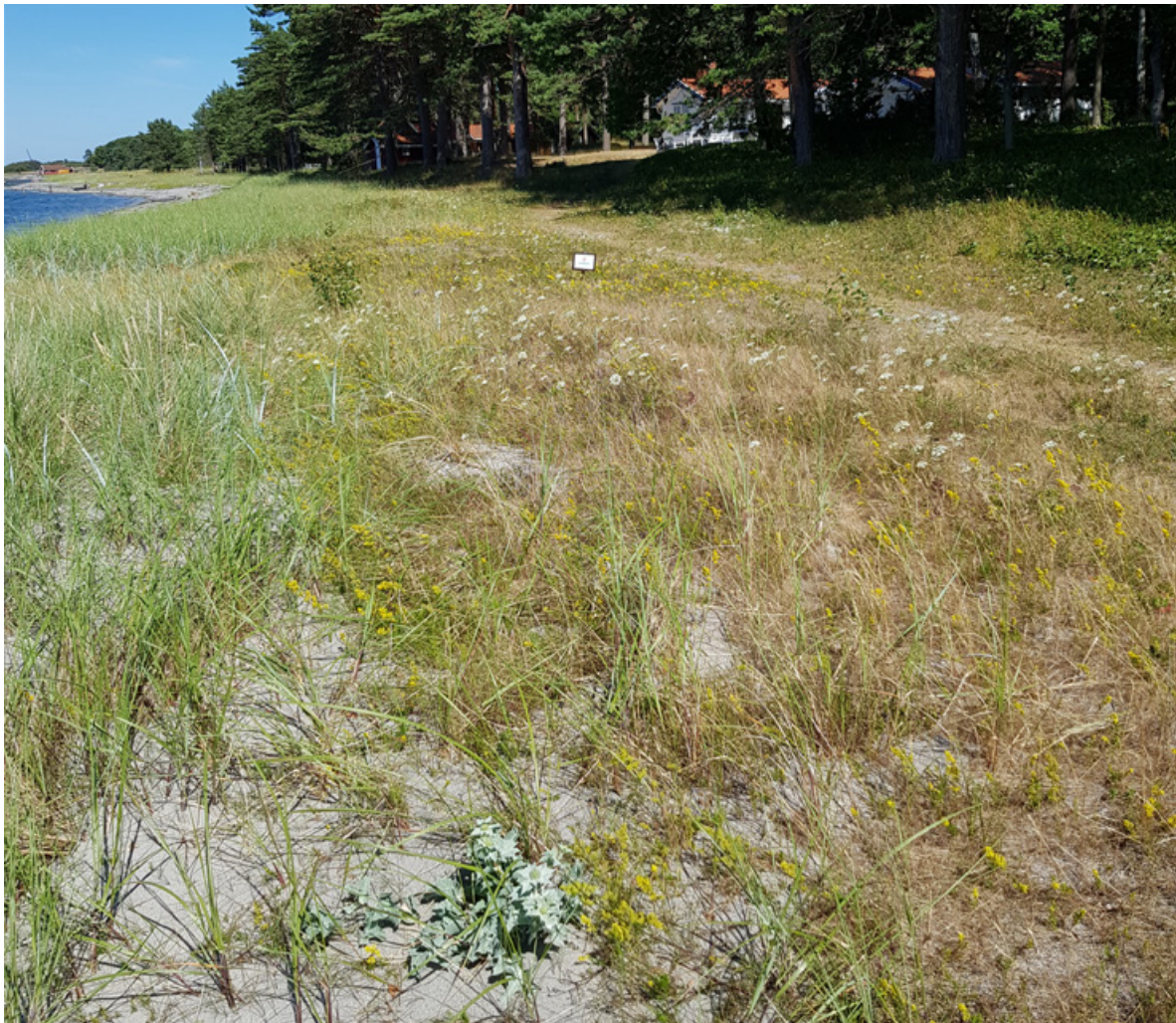
Figur 19. Strandtorn helt sør på tidligere Sandbakken naturreservat, Jomfruland (skiltet for vern ses som en hvit firkant midt i bildet).

Oppsummert kan man si at dette er påfallende få planter gitt de historiske fakta som er knyttet til denne arten på denne lokaliteten. Dessuten er mange av de påviste plantene små (unge sterile), hvilket vil si at en relativt stor andel av dem har stor sannsynlighet for å dø ut (Curle et al. 2007). En tørr forsommer og generelt ekstreme temperaturer kan dessuten forhindre blomstring hos tidligere blomstrende planter (Isermann & Rooney 1992).