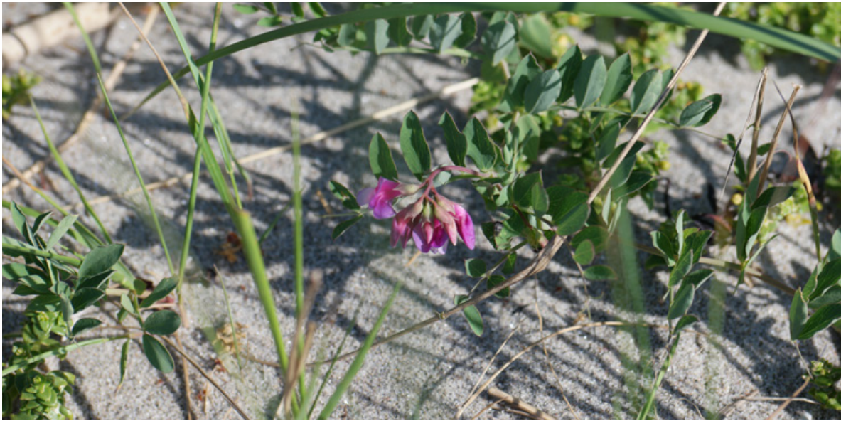
Figur 11. Det ble funnet relativt mye strandflatbelg på Sandbakken, Jomfruland, 13. juni 2018. Dette antas å være en viktig næringsplante for strandmurerbie.

Det er flere forhold som kan forklare hvorfor arten ikke ble funnet. Siden det var en spesielt varm og tørr forsommer i 2018, kan det være at arten var tidlig på vingene og slik sett var ferdig med flyveperioden da vi besøkte lokaliteten. Videre, gitt at bestanden der er begrenset, kan man anta å måtte bruke mye tid kun på søk etter denne arten for å påvise den. For vår del ble mye tid brukt på søk etter de andre artene, noe som nok gikk på bekostning av søk etter strandmurerbie.