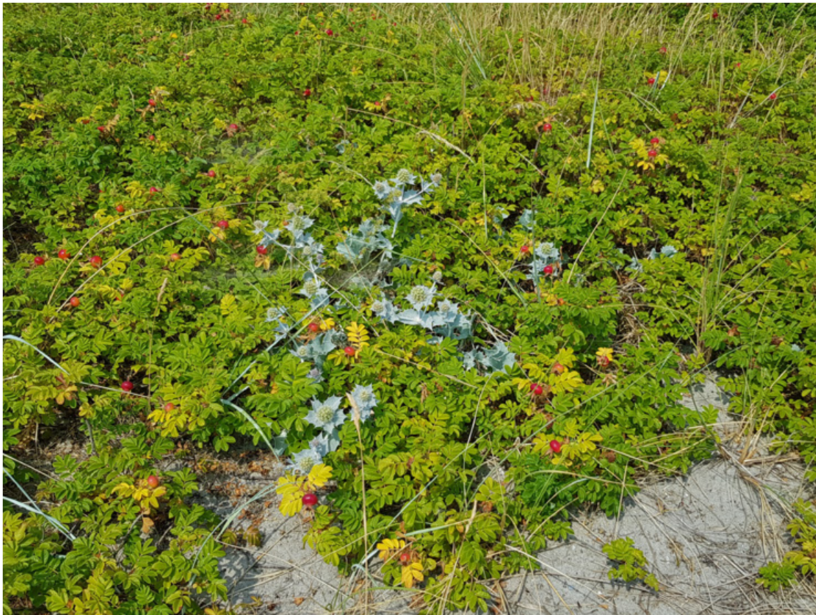
Figur 45. Individer av strandtorn kan bli gamle, og kan tåle gjengroing og fremmedarter en stund, men i lengden vil den bli kvalt. Bildet er tatt i Fuglsø Vig i Danmark 25. juli 2018.

Hvorfor de utplantede individene ikke overlever, er usikkert. Det kan skyldes en rekke forhold med plasseringen, og trolig kan også individer få problemer med væskebalansen (galt forhold av bladmasse/rotmasse) dersom oppvekstforholdene under oppdyrking skiller seg mye fra forholdene på lokalitetene. Både utplanting av frøplanter og rotbiter er forsøkt eksempelvis i Spania (C. Ley Vega de Seoane pers. medd.). Der har de også nokså god suksess med å plante ut frøplanter (omkring 60 % overlevelse), mens utplanting av rotbiter trolig gir en overlevelse på omkring 90 % (C. Ley Vega de Seoane pers. medd.).