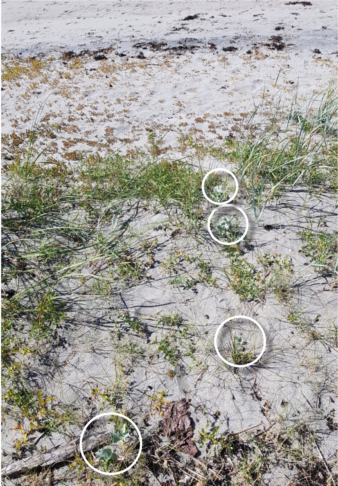
Figur 18. Omkring 32V 534840 6526751 sentralt på Sandbakken, Jomfruland, ble det innenfor en radius på 15 meter funnet 10 strandtorn. På bildet ser man fire planter (hvite ringer).