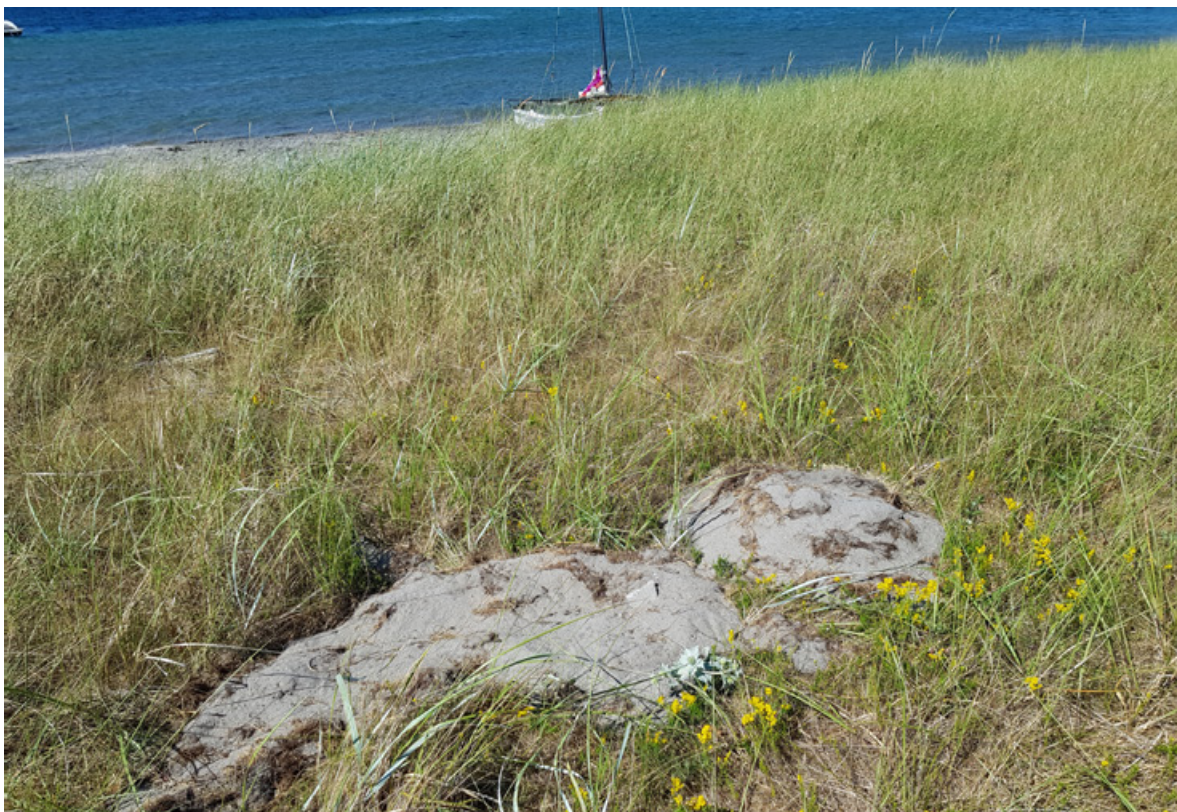
Figur 16. En strandtornplante sentralt på Sandbakken, Jomfruland (ved 32V 534896 6526819) den 8. juli 2018. Hvorfor det er en sandhaug ved siden av dette individet, er usikkert, og verken sandhaugen eller strandtornplanten ble funnet i juni.