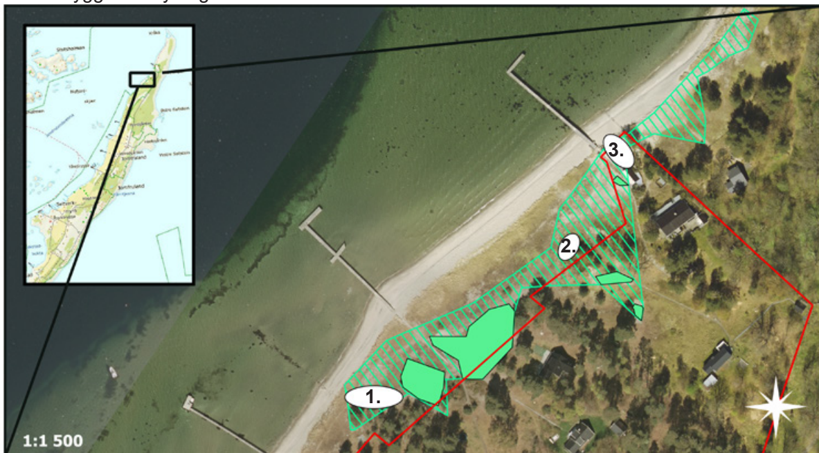
Figur 41. Sandbakken på Jomfruland. De grønne fylte polygonene er områder med høy tetthet av strandmaurløve, mens det grønne skraverte området er artens totalutbredelse. De hvite områdene representerer følgende: 1) gjengroing av osp, 2) område for habitatforbedrende tiltak for strandmurerbie, 3) gjengroing med balsampoppel. Den røde linjen er grensen for Jomfruland nasjonalpark. Kart: Anders Endrestøl, kartgrunnlag: Norge digitalt, Nedre Telemark jordskifterett.

Forslag til bevaringsmål: Når det gjelder bevaringsmålet, bør dette knyttes til den totale utbredelse og fordeling av fangstgroper innenfor denne, heller enn til tetthet innenfor delområder. En høy tetthet av larver av strandmaurløve vil kunne gi en økning i kannibalisme, samt at fødetilgangen vil bli lavere pr. fangstgrop. Gitt at fødetilgangen er jevnt fordelt på området, vil det dermed være en fordel å heller ha en stor utbredelse med jevn fordeling av fangstgroper enn en klumpvis fordeling. Det er for øvrig mangelfull kunnskap om hva som styrer preferansen for eggleggingslokaliteter for hunnene og hvordan en potensiell næringstilgang kan være en av faktorene som er involvert i dette. Eventuelle skjøtselstiltak for denne arten bør i så fall gjøres så langt unna dagens kjente utbredelse som mulig, for å få en god spredning av arten. Bevaringsmålet foreslås som minst 1000 fangstgroper av strandmaurløve på Jomfruland ved Sandbakken innenfor Jomfruland nasjonalpark i sør til hovedbrygga for Øytangen i nord.