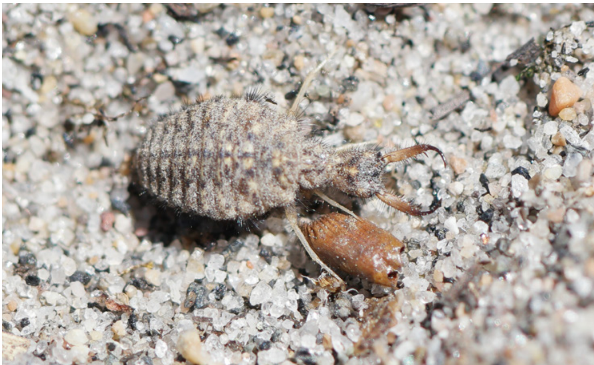
Figur 7. Larve av strandmaurløve på Sandbakken, Jomfruland 13. juni 2018. Det ble i liten grad gjort undersøkelser av fangstgroper for å se hvorvidt det var larver tilstede. Erfaringsmessig er aktive fangstgroper karakteristiske nok til å bekrefte arten.

Det tørre og varme været forsommeren 2018 har nok vært til strandmaurløvens fordel, siden dette er en art som prefererer varme og tørre lokaliteter. Hyppig regnvær gjør dessuten at maurløvene må bruke mye energi på å lage nye fangstgroper. Vi kan derfor anta at 2018 var et godt år for strandmaurløven.