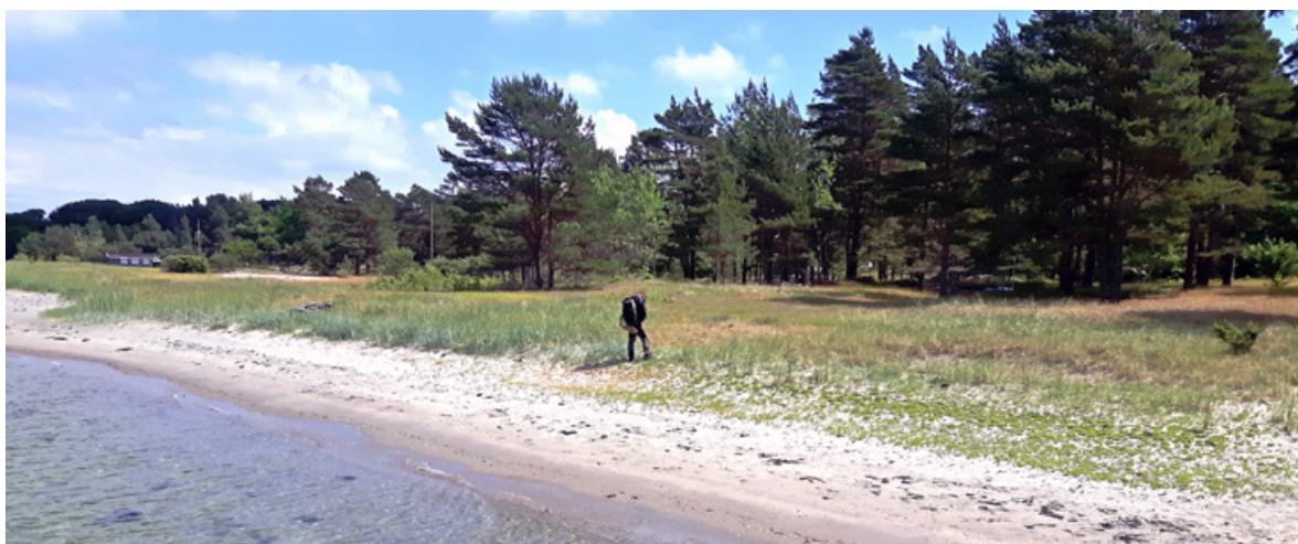
Figur 1. Sentrale deler av tidligere Sandbakken naturreservat. Her ser man den relativt korte erosjonskanten med fordyne/primærdyne. Innenfor finner man brune dyner og dynehei med mer eller mindre sammenhengende vegetasjonsdekke. Deretter overtar den furudominerte skogen.

Sandbakken ble, delvis av overnevnte grunner, vernet som naturreservat i 2006. Naturreservatet er senere opphevet, da området ble innlemmet i Jomfruland nasjonalpark i 2016. Det henvises for øvrig til Forvaltningsplan for Sandbakken naturreservat, Kragerø kommune (Silsand 2010) og Forvaltningsplan Jomfruland nasjonalpark, etter høring juni 2018 (Styret for Jomfruland nasjonalpark 2018) for ytterligere informasjon om Sandbakken og naturverdier i Jomfruland nasjonalpark.