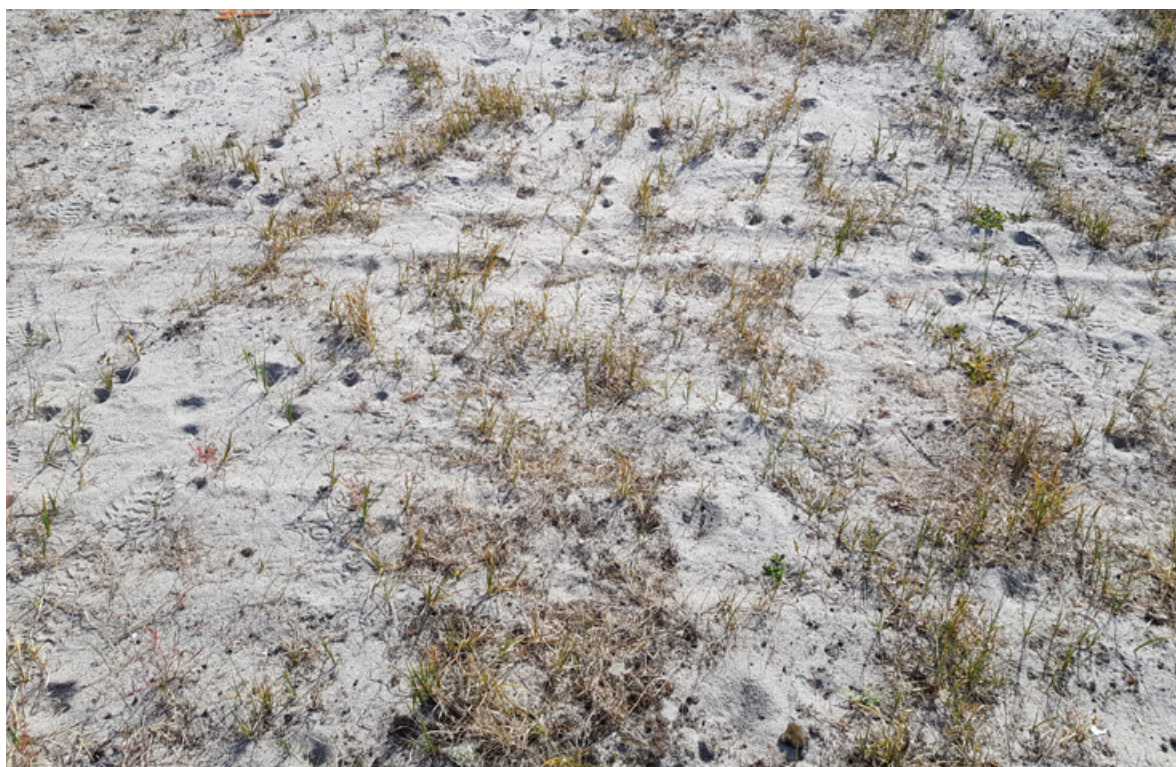
Figur 9. Tettheten av fangstgroper av strandmaurløve på Sandbakken, Jomfruland, 13. juni 2018 var stedvis høy, noe som vanskeliggjorde en detaljert optelling.