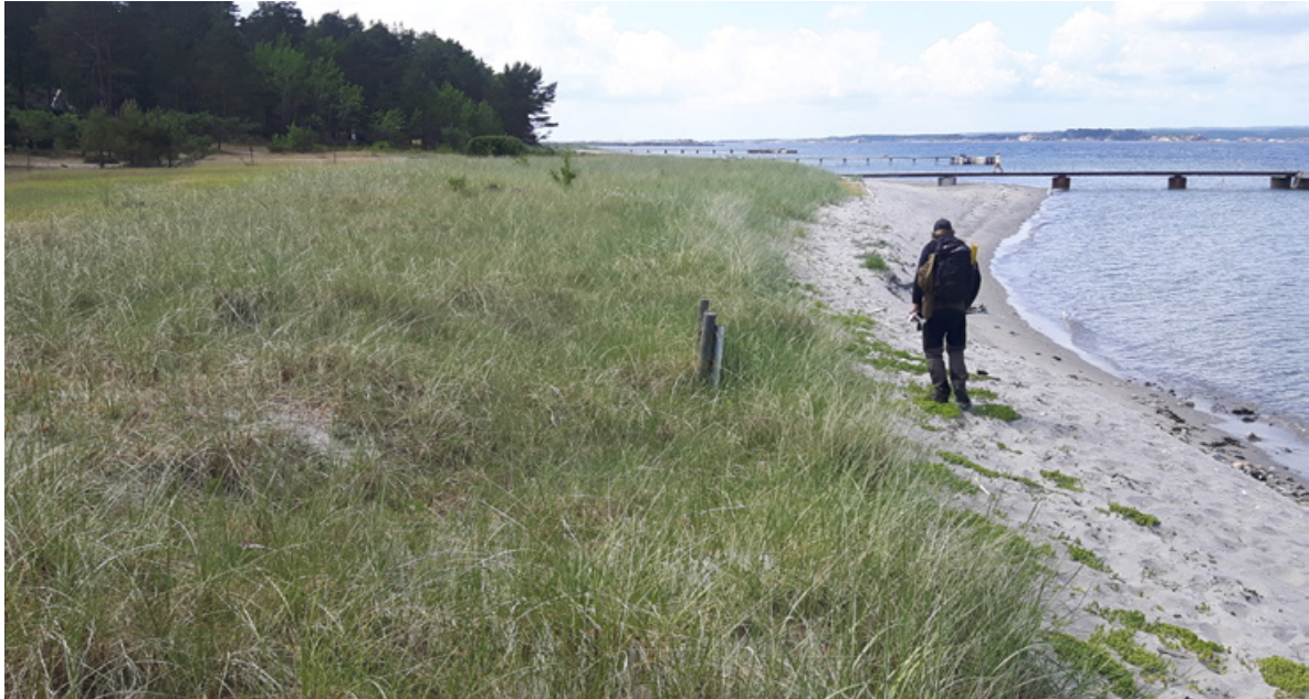
Figur 24. Fra selve forstranda på Sandbakken, Jomfruland, og innover er det en sone (brundyne) dominert av ulike grasarter.

Brune dyner (T21-C-3) : I beltet fra erosjonskanten og noen meter innover herfra, er det spredt vegetasjon dominert av grasarter som strandrug Leymus arenarius , kveke Elytrigia repens , marehalm Ammophila arenaria og rødsvingel Festuca rubra ( Figur 24 ). I denne sonen vokser også andre plantearter som strandflatbelg Lathyrus japonicus og åkerdylle Sonchus arvensis . Det er også i denne sonen, gjerne i overgangen til dyneheia på innsiden, man finner de fleste strandtornplantene. Strandtorn vil her trolig være sårbar for gjengroing og konkurranse, spesielt fra grasartene. Plantesamfunnet er nokså ordinært, slik at man gjerne kan fjerne flekker av denne vegetasjonen for å fremme strandtorn. En ulempe er at rynkerose Rosa rugosa kan etablere seg i denne sonen og i overgangen til dyneheia bak. Det ble ikke påvist mye rynkerose, kun noen småplanter ( Figur 25 ). Det er igangsatt bekjempelse av rynkerose på Jomfruland (med Glyfosat) som vil bli gjentatt, da noen av plantene har nye skudd i 2018 (M. Johannessen pers. medd.).