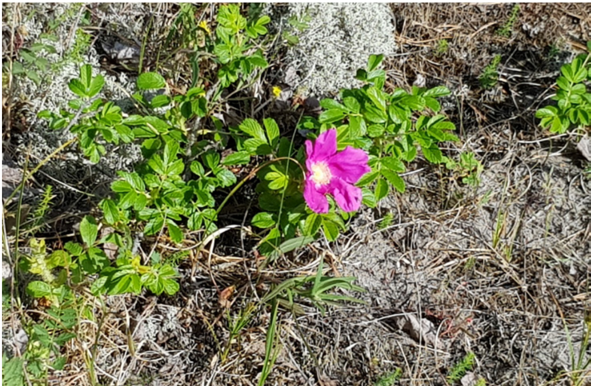
Figur 40. Rynkerose i blomst. Det er lite rynkerose ved Sandbakken, men noen småplanter, hvorav noen i blomst. Dette er en art som bør fjernes før den tar overhånd.