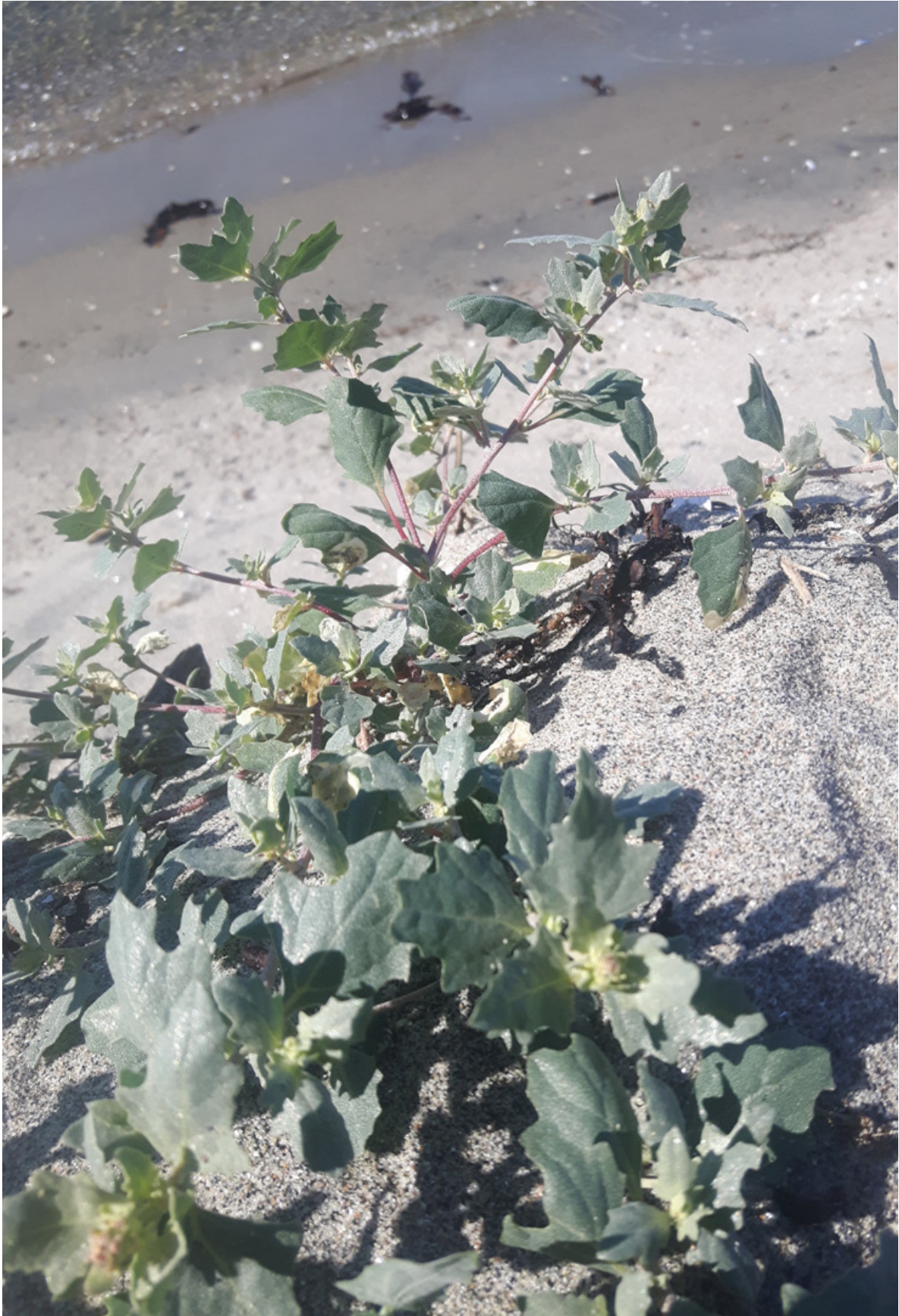
Figur 23. Det ble funnet noe få individer av sølvmelde på Sandbakken, Jomfruland, 13. juni 2018. Dette er en relativt sjelden plante i Norge, og har sin hovedutbredelse på Jæren og Lista i Norge.