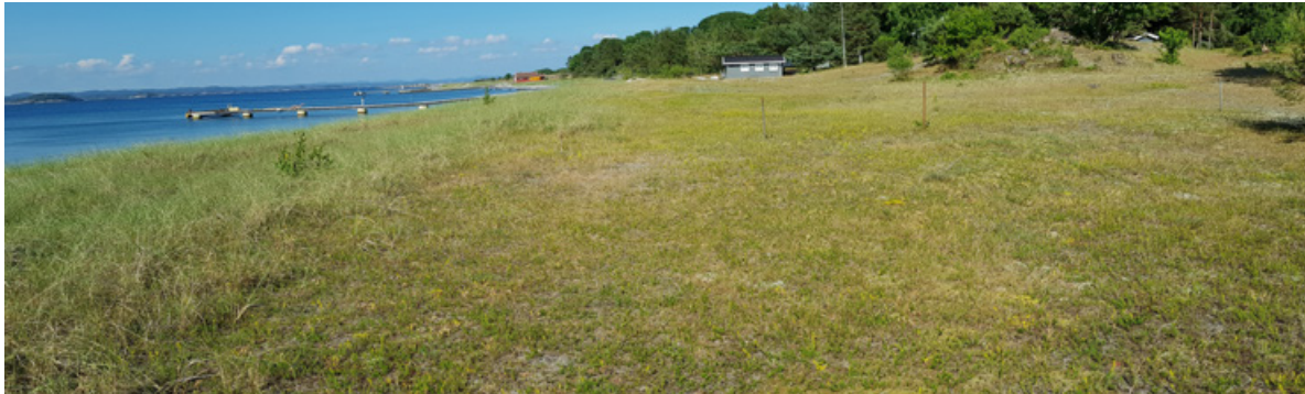
Figur 26. Dyneheia på Sandbakken, Jomfruland, er en mosaikk av tett vegetasjon av relativt lavvoksende gras og urter med åpne flekker av bar sand inni mellom. Denne sonen er viktig for mange av de spesielle artene av insekter som vi finner her, blant annet strandmaurløve, strandmurerbie og andre.

Dyneheia er dominert av arter som gulmaure Galium verum , markmalurt Artemisia campestris og sandstarr Carex arenaria ( Figur 27 ), men man finner også arter som blodstorkenebb Geranium sanguineum ( Figur 28 ), rundbelg Anthyllis vulneraria og ryllik Achillea millefolium . Her kan man også finne enkelte sjeldenheter blant karplantene, som for eksempel dvergsmyle Aira praecox ( Figur 29 ). Dette er en art som har sin hovedutbredelse på vestkysten av Norge (blant annet i dyneenger), og som er nokså sjelden fra Telemark og langs kysten til Østfold.