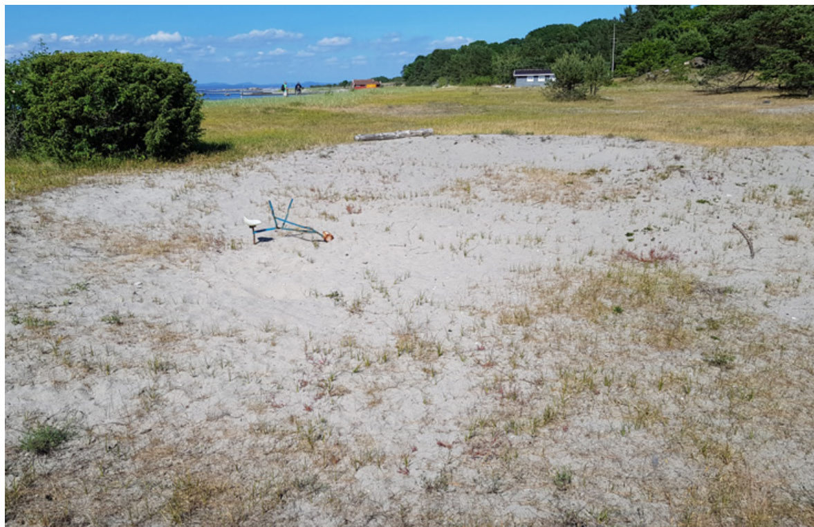
Figur 34. Et gammelt sandtak sentralt på Sandbakken, Jomfruland, 13. juni 2018. Om dette området er holdt åpent utover aktivitet fra «minigraveren» i bildet, er usikkert.