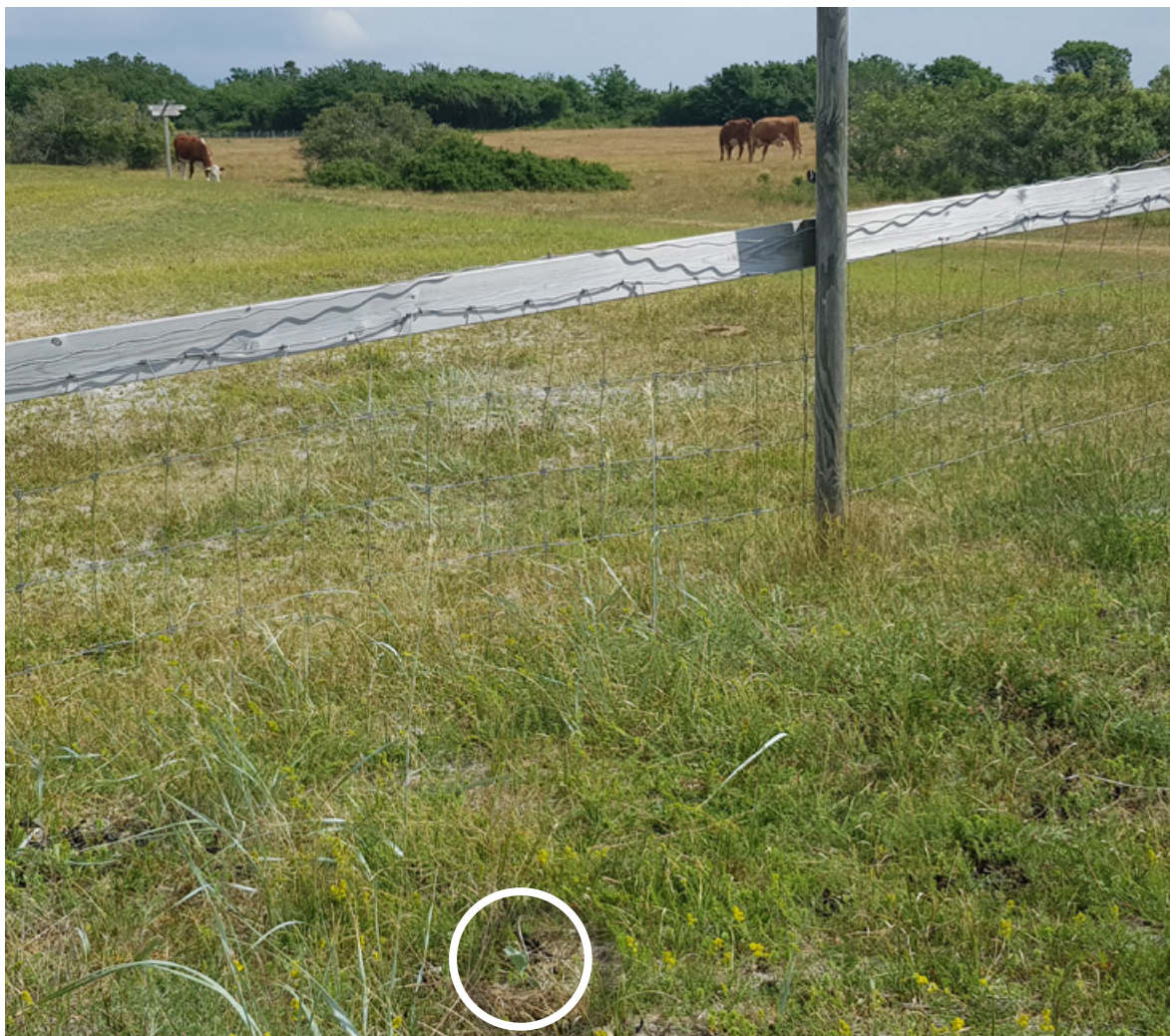
Figur 13. Strandtorn påvist helt nord ved det inngjerde beitet (i hvit ring) ved Øytangen, Jomfruland. Dette område sammenfaller med der hvor det ble plantet ut strandtornindivider i 2015. Det ble påvist fire individ der 13. juni 2018.

Vi fant den 13. juni 2018 kun 17 strandtorn over hele området ( Figurene 13–20 ). Søk etter arten 8. juli resulterte i 18. Fire strandtorn ble funnet helt nord, i nærheten av gjerde til beitet, men på sørsiden (ved 32V 535161 6527263) den 13. juni 2018 ( Figur 13–14 ). I juli ble kun tre av disse gjenfunnet. Dette er i nærheten av utplantningsfeltet 5a (K. Bjøreke upubl. data), og individene er muligens fra 2015-utplantningen. Disse ble for øvrig ikke påvist av Botanisk forening i august 2018 (B.E. Halvorsen upubl. notat). Et individ ble 31. august her påvist inntørket og antakelig dødt (M. Johannessen pers. medd.). Det ene individet som Botanisk forening påviste av de tidligere utplantede, sto for øvrig inne på beitet (B.E. Halvorsen upubl. notat).