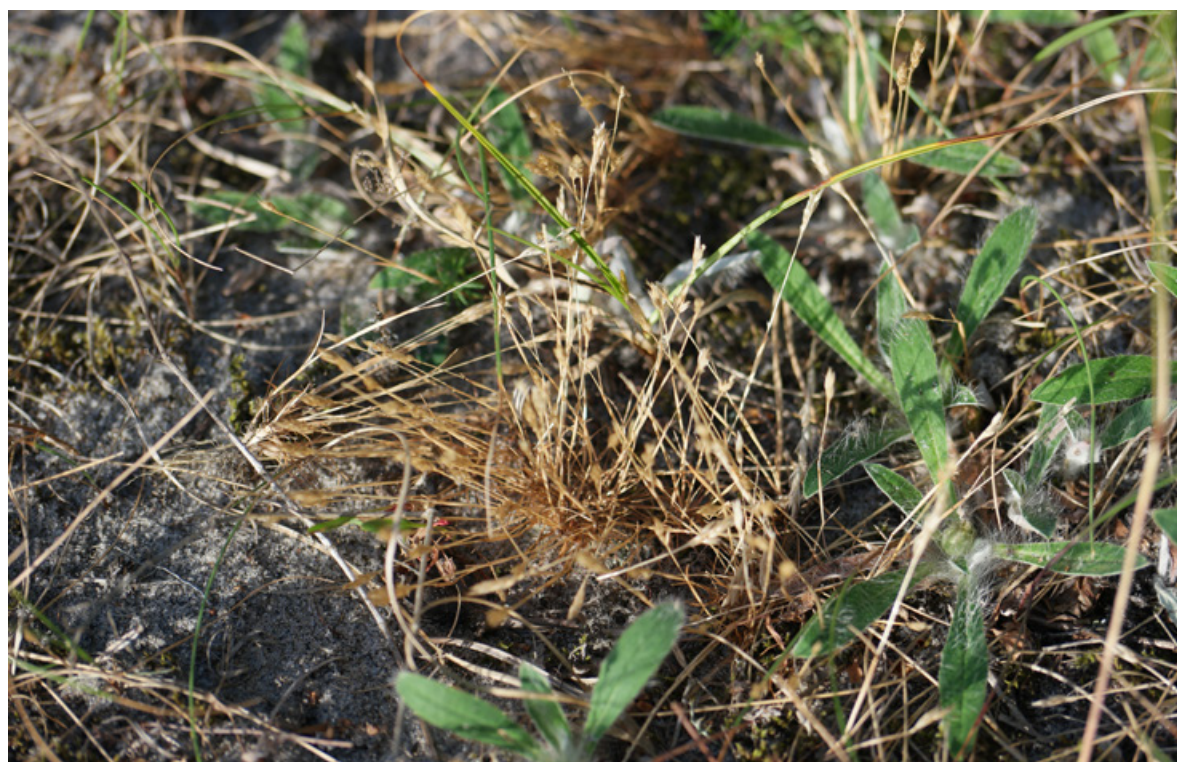
Figur 29. Dvergsmyle Aira praecox ble funnet på et par steder litt nord på Sandbakken, Jomfruland. Arten er sjelden i Telemark og videre langs kysten til Østfold, men vanligere på Vestlandet.