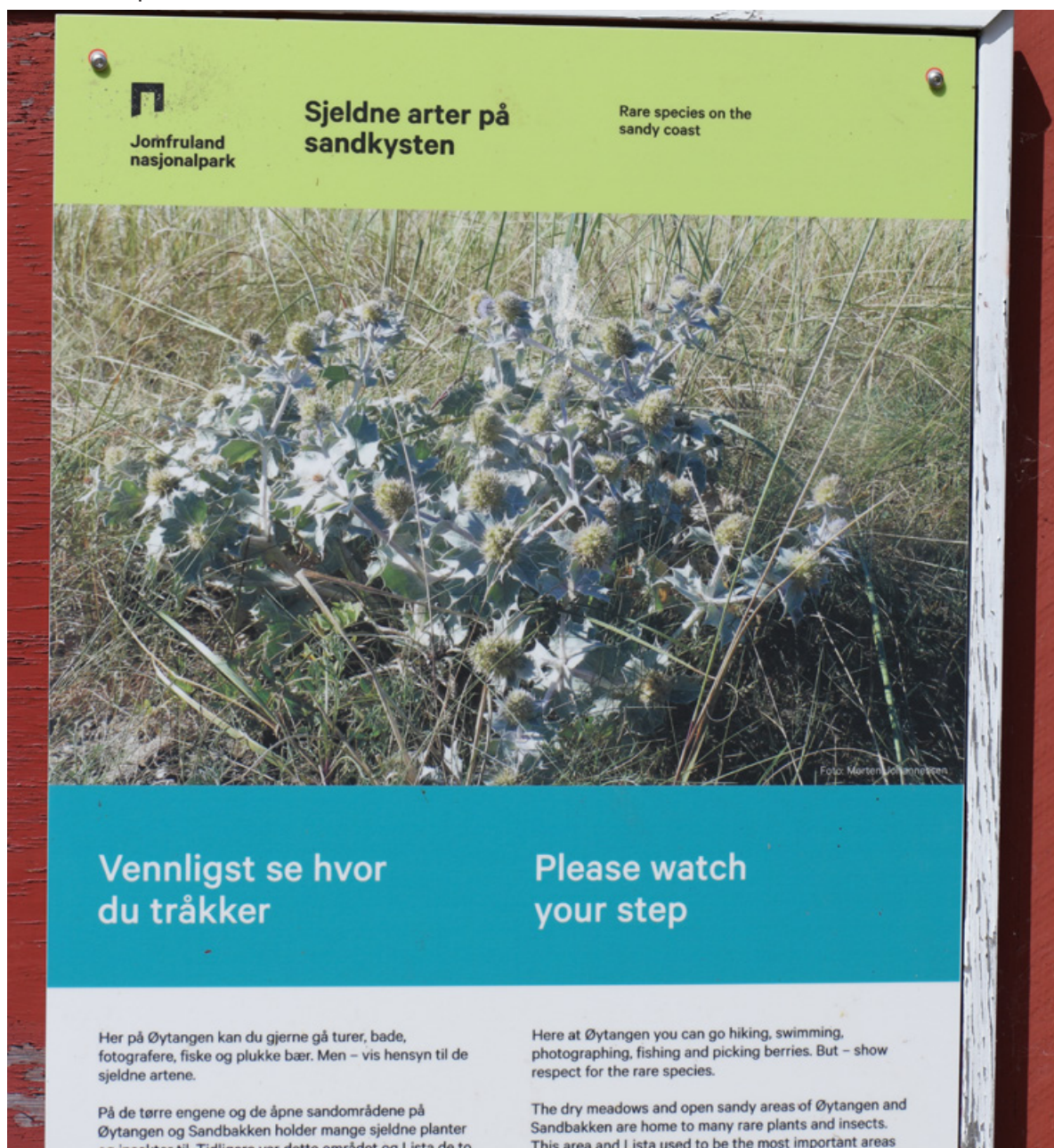
Figur 46. Informasjonstiltak er viktig, spesielt for strandtorn.

Ansvarlig for administrasjonen av tiltakene legges til nasjonalparkstyret ved forvalter. Løpende tiltak knytter seg først og fremst til fjerning av fremmede arter, hovedsakelig rynkerose og balsampoppel. Andre foreslåtte tiltak for å hindre gjengroing kan gjøres en gang, med vurdering etter eksempelvis tre år.