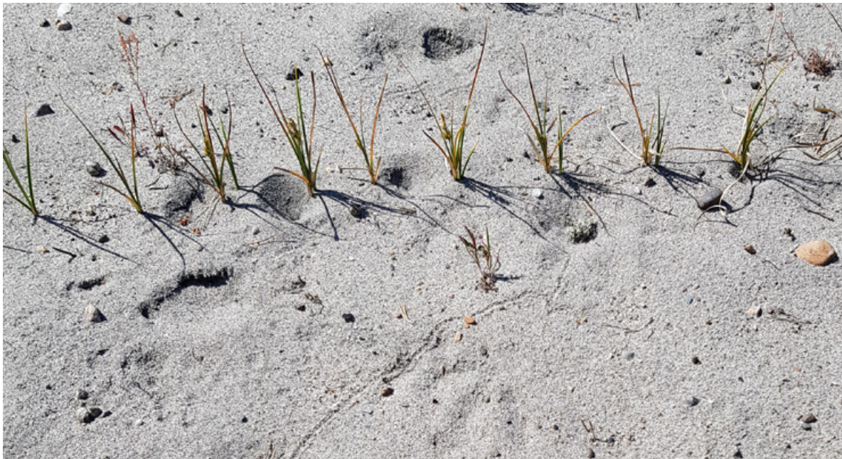
Figur 27. På de bare sandfleckene på dyneheia på Sandbakken, Jomfruland, finner vi typisk strandstarr som står på «geledd». Her finner vi også strandmaurløve, og på bildet ser vi både fangstgroper og et krypespor etter en larve som har forflyttet seg.