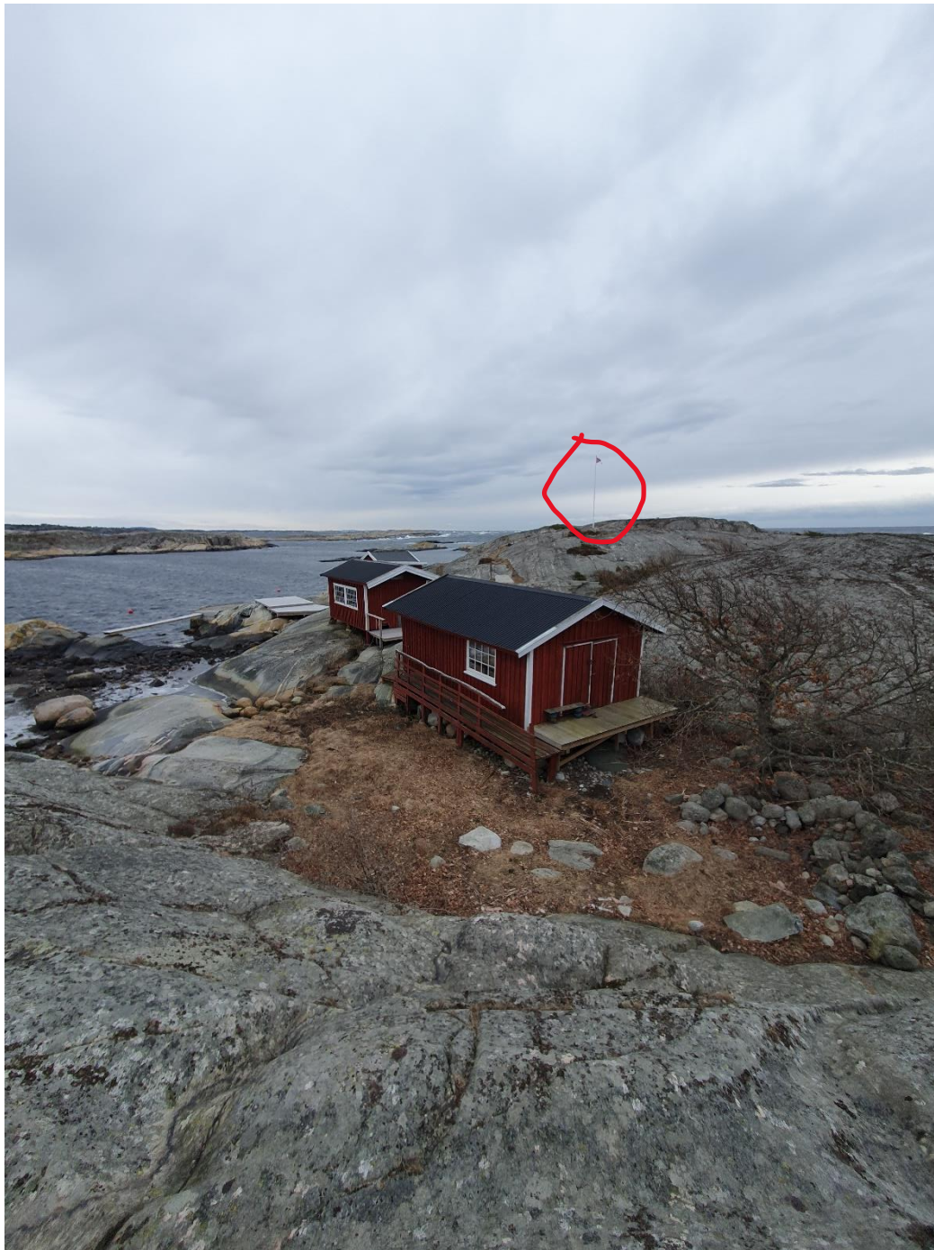
Foto tatt under befarings av nasjonalparkforvalter den 7. mars 2023. Etablert flaggstang er markert med rød sirkel.