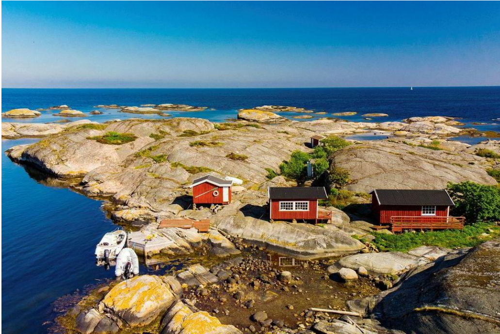
Gjengitt i Dagens næringsliv 29.05.2018.