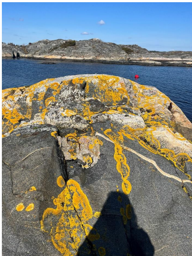
Detaljfoto tatt 2023 som viser jernfester i svaberget fra tidligere flaggstangfeste (i situasjonskart grønt punkt). Dette er i dag eneste rest fra tidligere flaggstang.

Selv om det historisk har vært flaggstang på eiendommen vurderer forvalter at ev. tidligere flaggstenger har vært nede over et så langt tidsrom at dette faller utenfor verneforskriftens