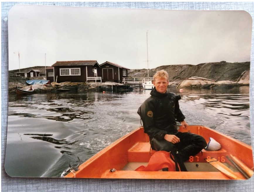
Fotografi fra 1986. Flaggstang synlig på anneks/utedo til venstre i bildet (gult punkt).