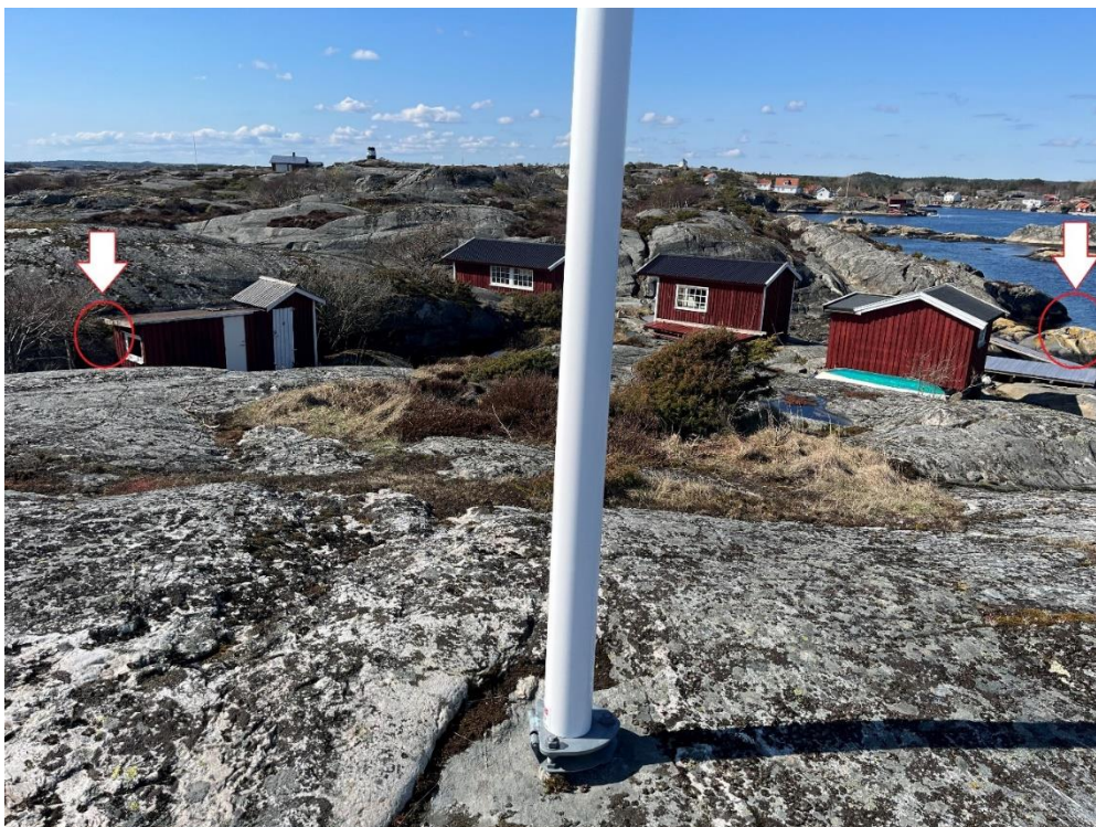
Foto av nyetablert flaggstang på nytt sted tatt av tiltakshaver. Piler og sirkler markerer tidligere fester for gamle flaggstenger på eiendommen. Ny flaggstang etablert nord-øst for bebyggelsen (rødt punkt).