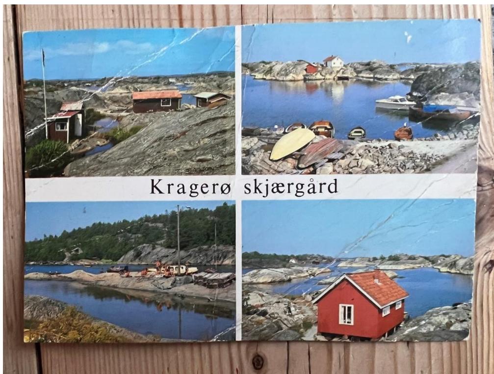
Fotografi/postkort fra 1990- tallet. Flaggstang på eiendommen synlig på bilde ved anneks/utedo (gult punkt), jf. plassering som bilde fra 1986.