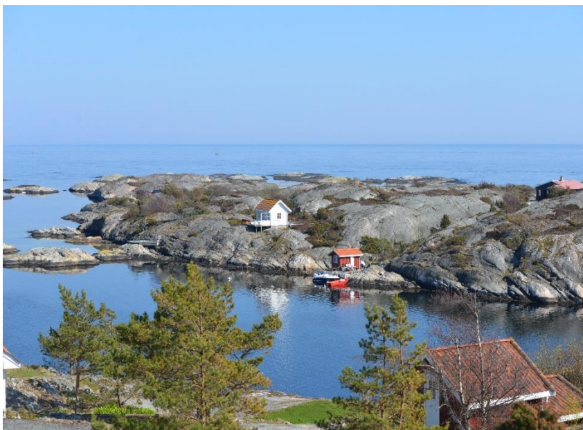
Fotografi tatt i april 2014 av tidl. nasjonalparkforvalter. Bildet er tatt fra Vakthusheia på Portør, retning Styrmannsholmen. Bildet viser ingen flaggstenger på nevnte eiendom. Eneste flaggstang på Styrmannsholmen på vernetidspunktet var på gbnr. 7/161, sør på Styrmannsholmen.

Da eiendommen ble lagt ut for salg i 2018 viser bilde fra salgsannonsen heller ingen flaggstang på eiendommen: