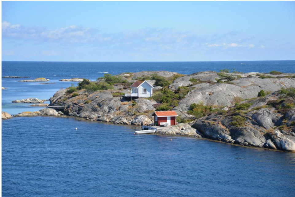
Foto tatt fra Portør retning Styrmannsholmen 15.08.2013. Det er ingen flaggstang synlig på noen av de påviste festene på gbnr. 7/163. Ev. flaggstang ville vært synlig over svabergene.

adgang til «vedlikehold». Jomfruland nasjonalpark ble opprettet ved Kongelig resolusjon i desember 2016 og utgangspunktet for vurderingen er eiendommens bygg og installasjoner på vernetidspunktet. Fotografier fra årene før og årene etter opprettelsen viser ingen flaggstang på noen av de påviste plasseringene.