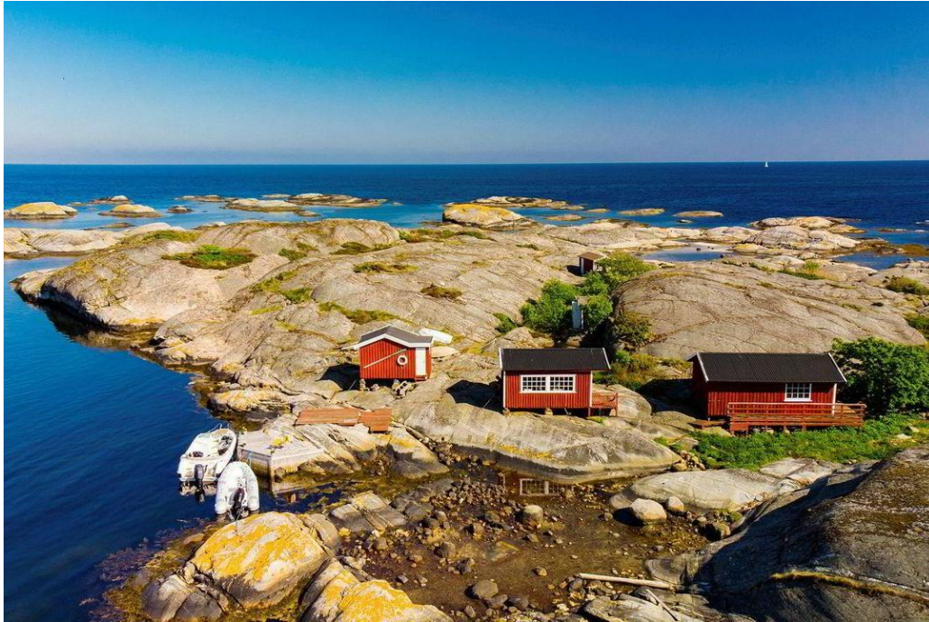
Gjengitt i Dagens næringsliv 29.05.2018.