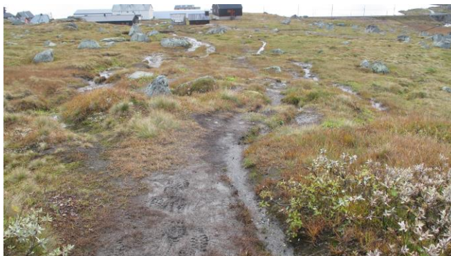
Illustrasjon nr. 1. Bildet til venstre er fra 2017. Bildet til høyre er fra 2020. Noe erosjon som følge av vann kan synes, men dette kan like godt skyldes tråkkerosjon. Kjøresporene er borte.