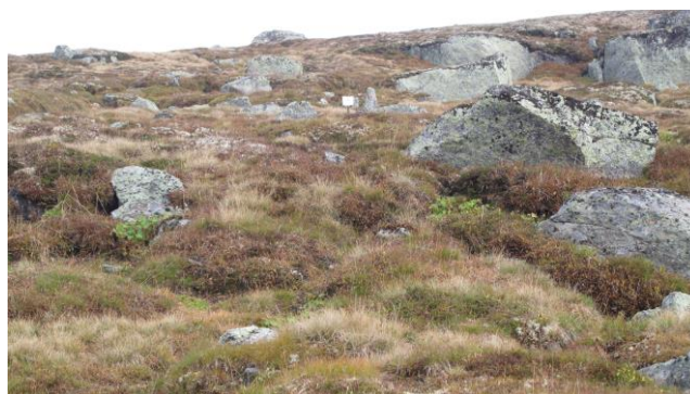
Illustrasjon nr. 2. Bildet til venstre er fra 2017. På bildet til høyre ser en at kjøresporene er helt borte.