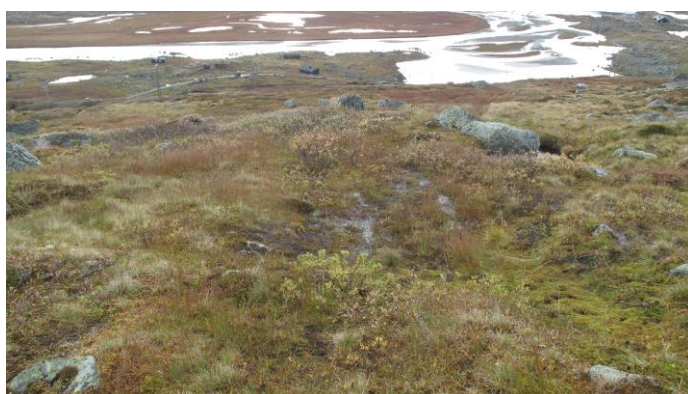
Illustrasjon nr. 4. Bildet til venstre viser kraftige kjørespor i bløtt terreng i 2017. 3 år senere er det nesten vanskelig å se at det er kjørt i området.