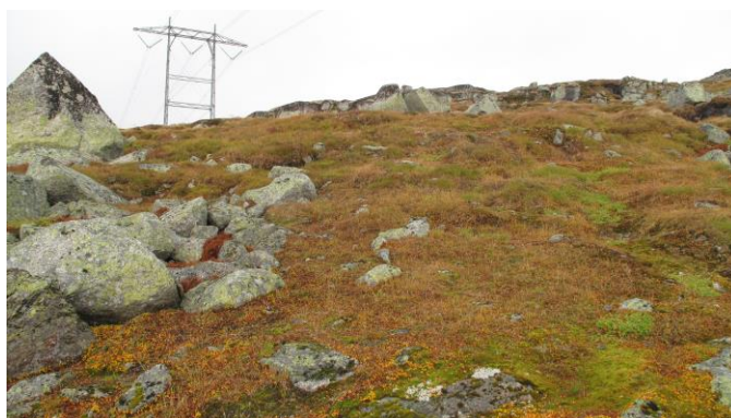
Illustrasjon nr. 3. Bildet til venstre er fra 2017. På bildet til høyre ser en at kjøresporene er helt borte.