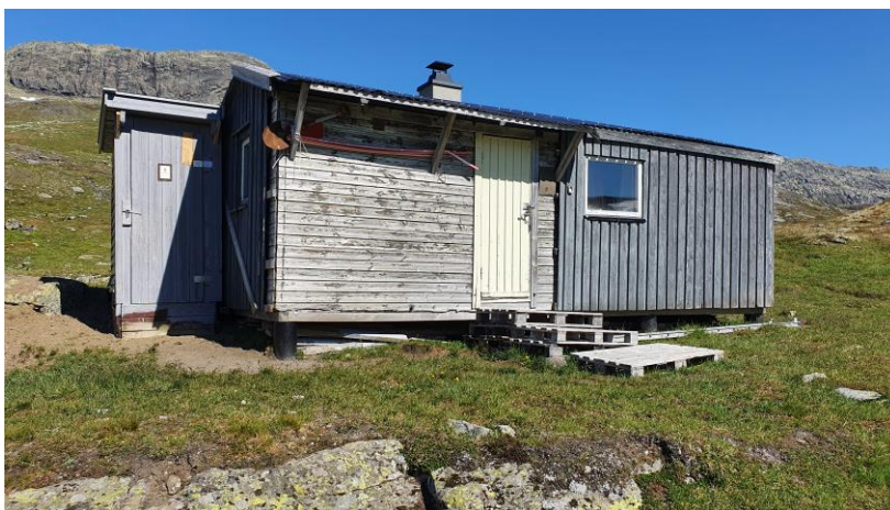
Viser hytte nr. 84A i Lengjedalen med ny(gammel) utedo.

Det er søkt om og innvilget dispensasjon til oppsetting og til helikopterflyging i forbindelse med oppsetting.