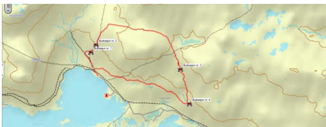
Illustrasjon som viser hvor de ulike bildene er tatt.