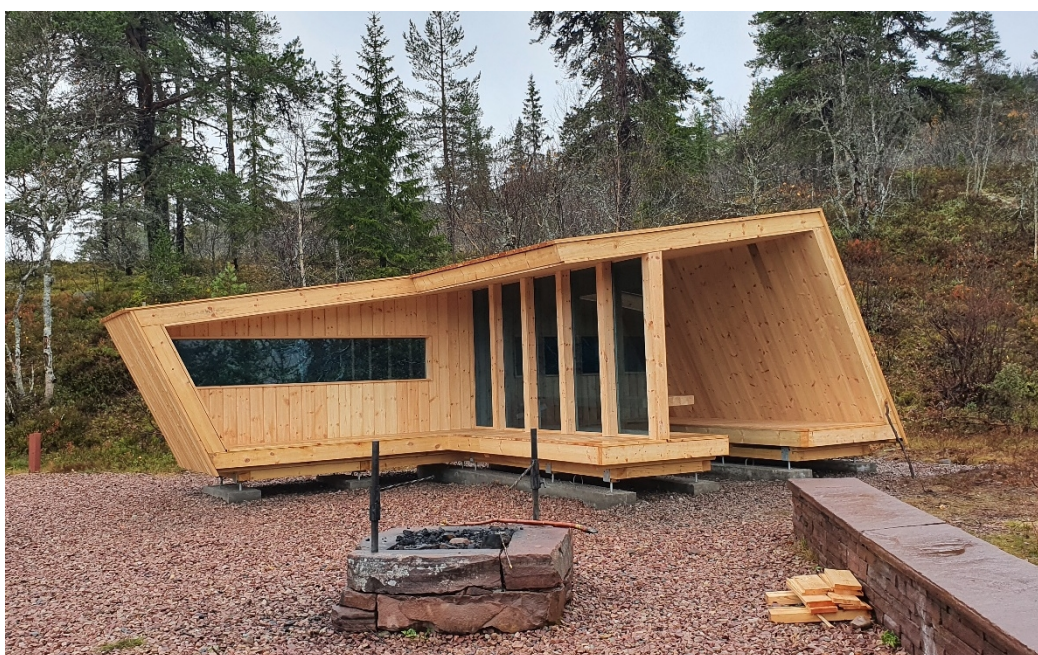
Ny gapahuk på plass på Storbekkåsen

Prosesen med oppføring av gapahuken startet i slutten av august, med utbygging av masser i forbindelse med nedgraving av fundamenter. Gapahuken ble ferdigstilt 24. september 2020.