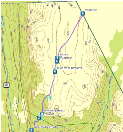
Vandring på gjengrodd stier på Skjærvegen

På grunn av restriksjoner knyttet til koronapandemien var det ikke mulig å krysse grensen inn til Sverige, for å følge stien videre inn på svensk side av grensen. Det ble ikke brukt tiltaksmidler tilknyttet dette prosjektet i 2020. Tiltaket er videreført i tiltakslisten for 2021.