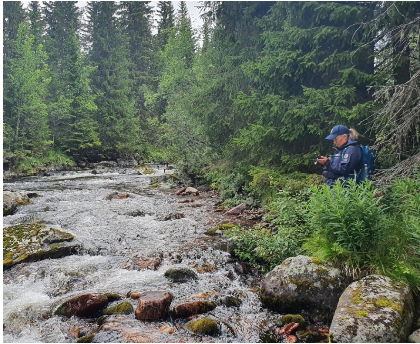
SNO v/Runa Skyrud på befaring til Bergådalen, 3. august 2020.