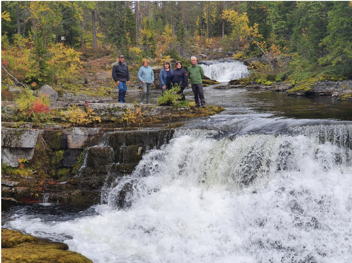
Nasjonalparkstyret på befaring til Bråtafallet 17. september 2020.