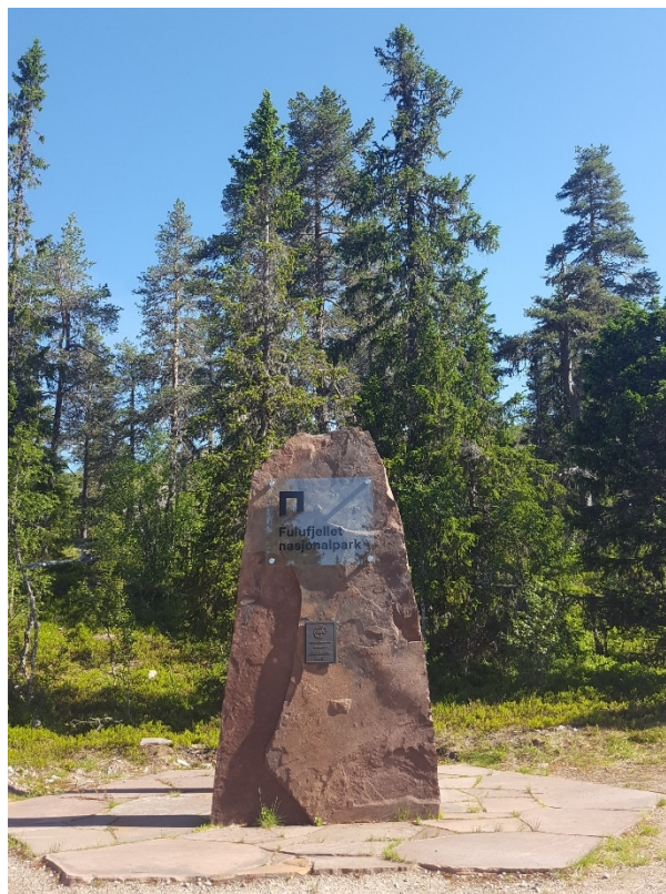
Steinportalen på Storbekåsåsen

Det er utarbeidet både en forvaltningsplan og en besøksstrategi for Fulufjellet nasjonalpark som er endelig godkjent av Miljødirektoratet. Det gjenstår imidlertid arbeid med både teknisk ferdigstilling og layout før disse kan publiseres.