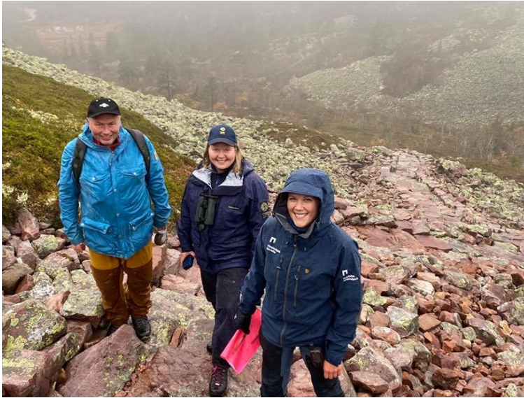
Befaring til Brynflået 6. oktober 2020.

av stitraséen opp til Brynflået. Det var tydelig behov for ytterligere stiforsterkning langs store deler av traséen og det ble etterspurt et kostnadsoverslag for jobben fra Stibbyggjaren AS. Tilsendt kostnadsoverslag tilsier at resterende stiforsterkningsarbeid må ut på ny tilbudskonkurranse i 2021.