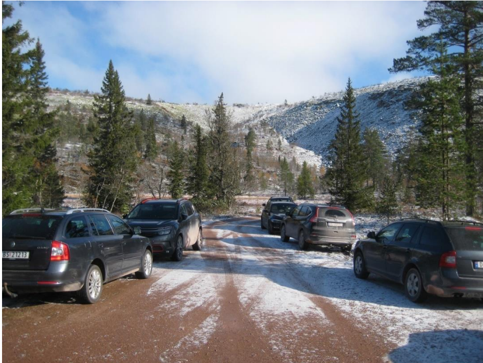
Fra parkeringsplassen på Storbekkåsen rett etter at steinsetting av sti var slutført