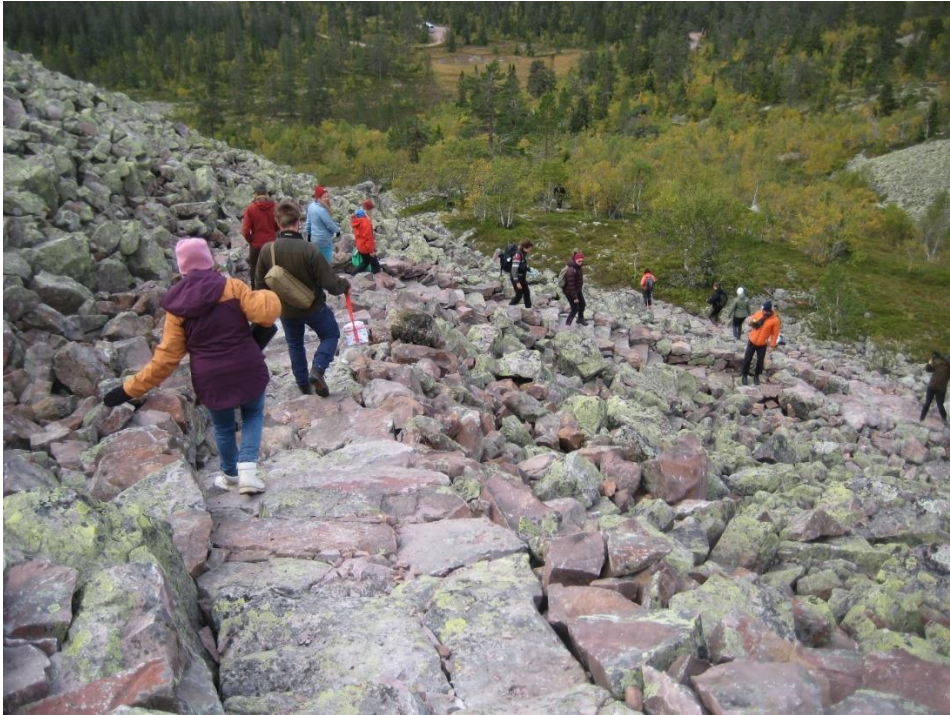
Fra steinsettingen i det bratteste partiet

Etter at sherpalaget hadde avsluttet arbeidet kunne en registrere et stort antall besøkende som gikk stien opp til Brynflået, sikkert mange av nysgjerrighet til hvordan «Fulufjelltrappa» ble seende ut og fungerte.