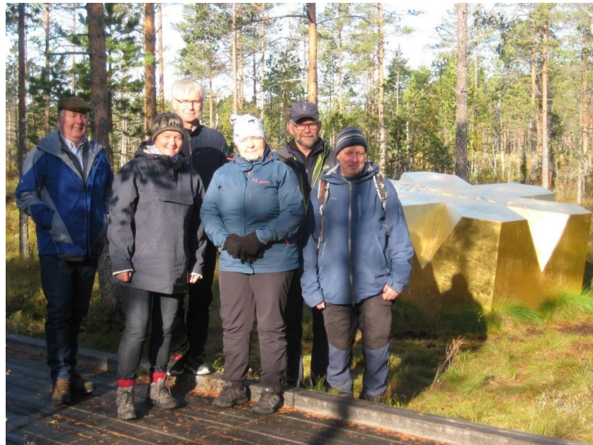
Nasjonalparkstyret på studietur 19.9.2019