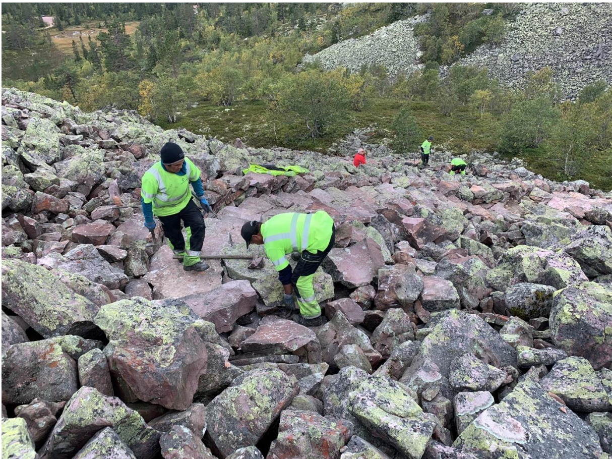
Sherpaer i arbeid i september 2019.