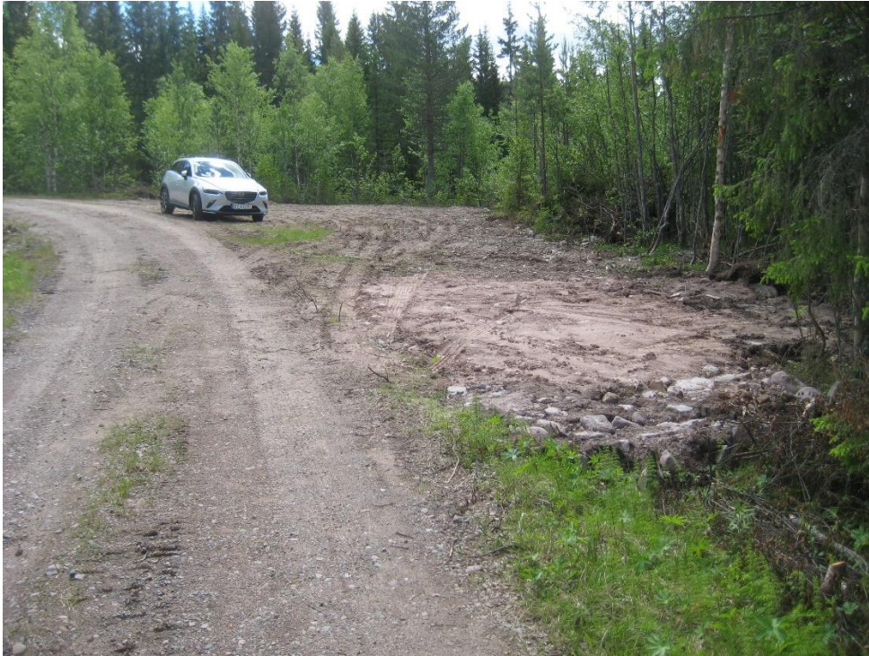
En av de to nyanlagte små parkeringsplassene langs Fregnsetervegen