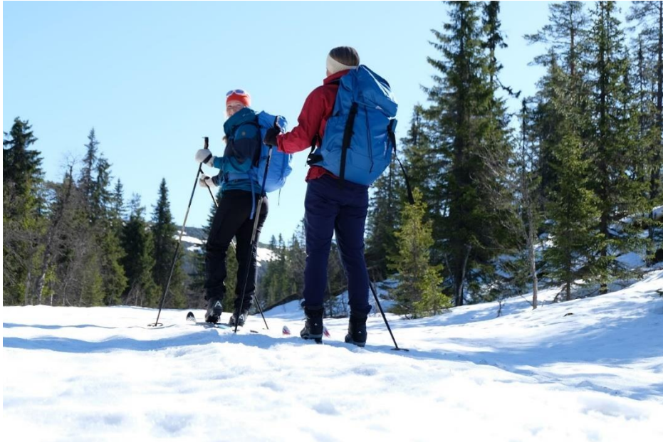
På vei inn i Fulufjellet nasjonalpark

Ovennevnte prosjekt var altoverskyggende med hensyn til nasjonalparkforvalters disponering av arbeidstid i 2018. Selv om prosjektet formelt ble avsluttet ved årsskiftet 2018/2019, har oppfølgingen av prosjektets hovedprodukt, den felles besøksstrategien, krevd en del tidsressurser også i 2019. Dette har blant annet omfattet: