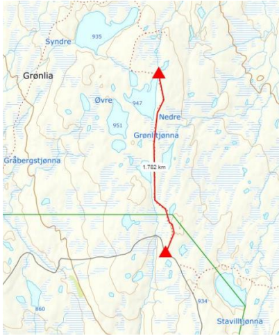
Kart 1: Kjøretrasé for snøscooter, ATV og gravemaskin.

for at dette blir gjort. Grunneier og nasjonalparkstyret skal varsles dersom det er blitt kjøreskader, og det skal redegjøres for hvordan og når skadene utbedres.