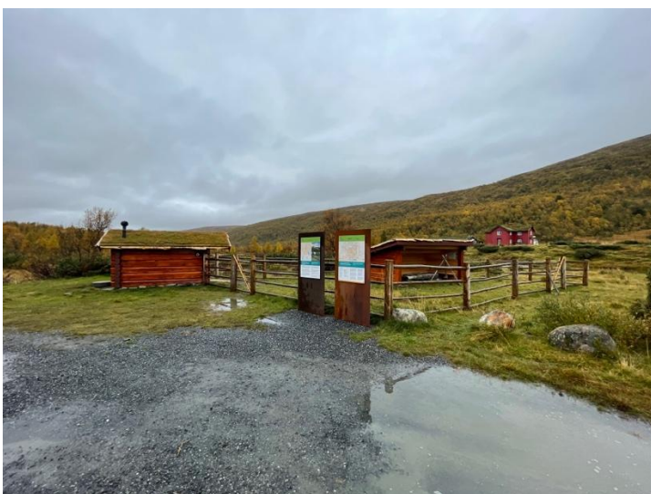
Hognarasten startpunkt i Synnerdalen, Budalen landskapsvernområde.