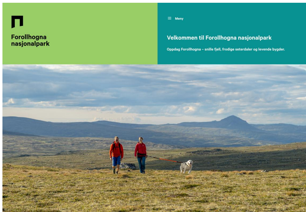
Forollhogna.info: Besøksrettet nettside for Forollhogna nasjonalpark

Denne nettsiden inneholder offentlig informasjon og er mest relevante for kommunene, grunneiere, rettighetshavere, næringsliv og reiseliv, frivillige lag og foreninger m.fl.