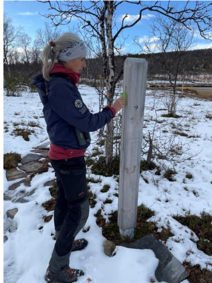
Natursti ved Svartsjøen, Kvikne.