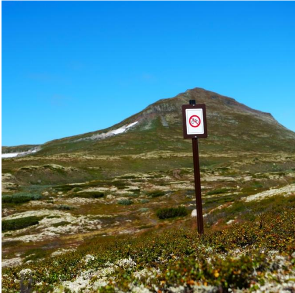
Forbudsskilt "sykling forbudt", ved stien til Forollhogna-toppen.

Ved Svartsjøen på Kvikne er det tilrettelagt med en natur- og kultursti under merkevaren. Det kan være aktuelt å opprette flere slike naturstier under merkevaren.