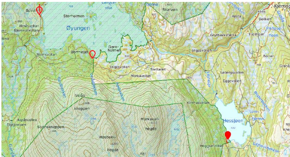
Bubekkvika markert lengst til venstre, Veldalsvika i midten og Hessjøen til høyre.