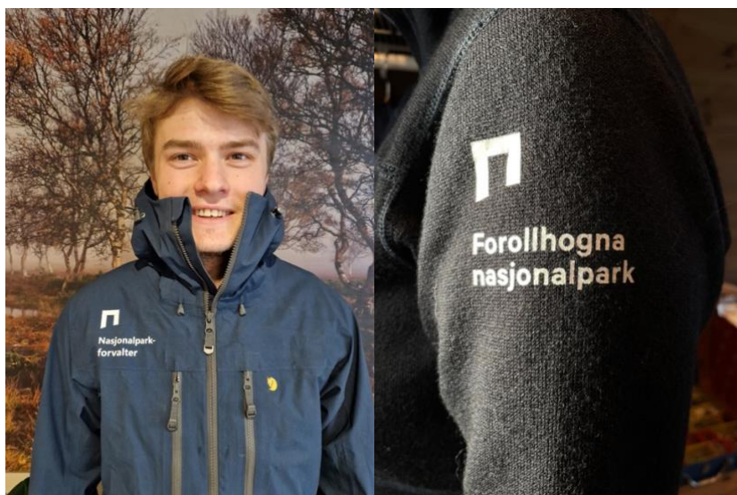
Bekledning for forvaltere, ytterjakke og erme på ulljakke.

Offisiell bekledning under merkevaren er forbeholdt nasjonalparkforvaltere, ansatte knyttet til besøksenter eller i øvrige forvaltningsmyndigheter, samt styremedlemmer. Når forvaltere eller styremedlemmer deltar på ulike møteplasser, skal de ha på seg klesplagg/profilartikkel som har logoen vår. Det kan være genser, jakke, vest, lue eller andre artikler. Vi skal ha et bevisst forhold til å bruke bekledning når vi representerer Forollhogna nasjonalpark.