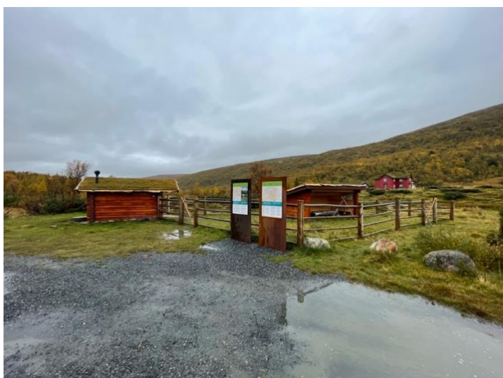
Hognarasten startpunkt i Synnerdalen, Budalen landskapsvernområde.