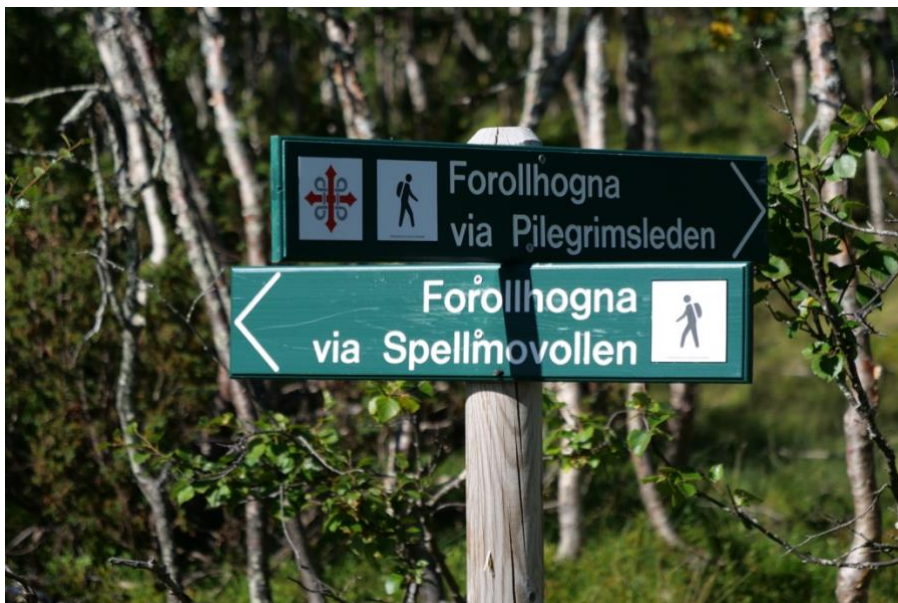
Skilting etter Merkehåndboka, ved Såttåhaugen, Vangrøftdalen-Kjurrudalen landskapsvernområde.

Skilting og merking av stier skal følge Merkehåndbok som er en nasjonal standard for tilrettelegging av stier og løyper for friluftslivet.