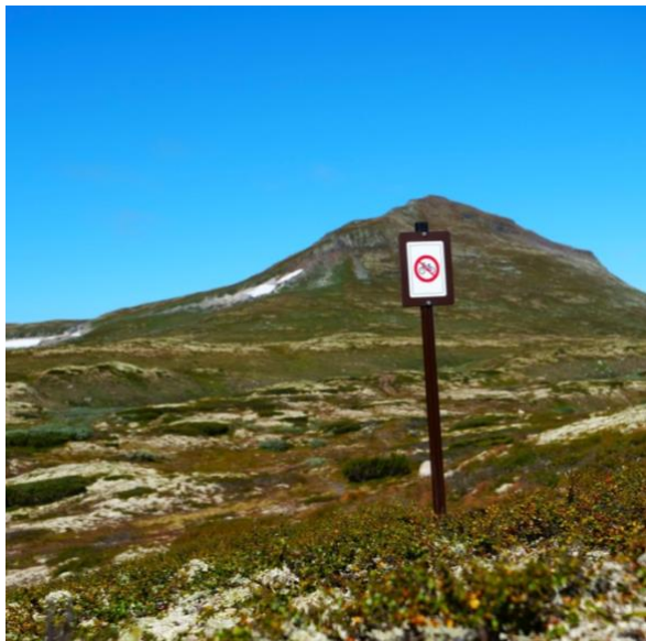
Forbudsskilt "sykling forbudt", ved stien til Forollhogna-toppen.

Ved Svartsjøen på Kvikne er det tilrettelagt med en natur- og kultursti under merkevaren. Det kan være aktuelt å opprette flere slike naturstier under merkevaren.