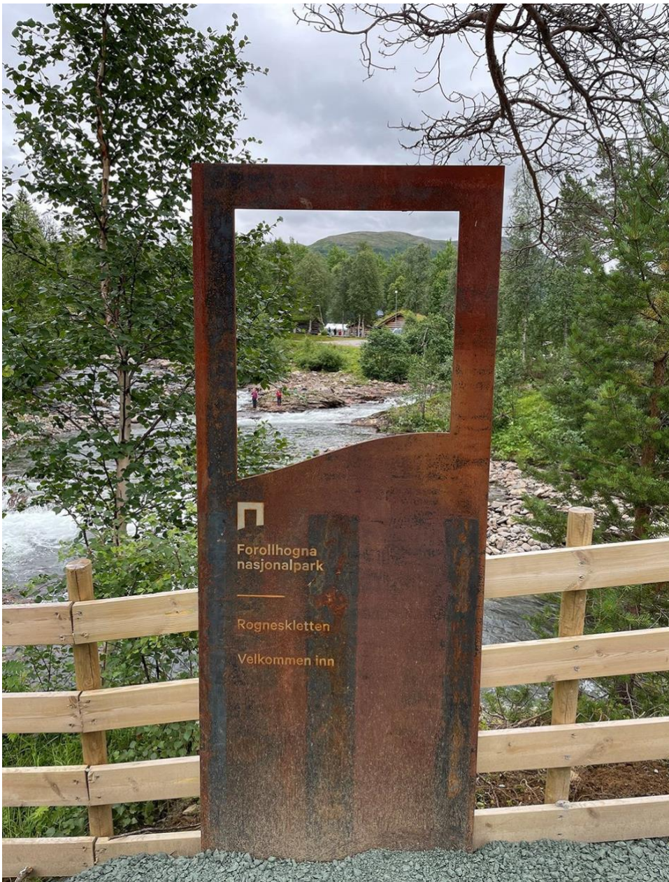
Storbekkøya, Budal landskapsvernområde.