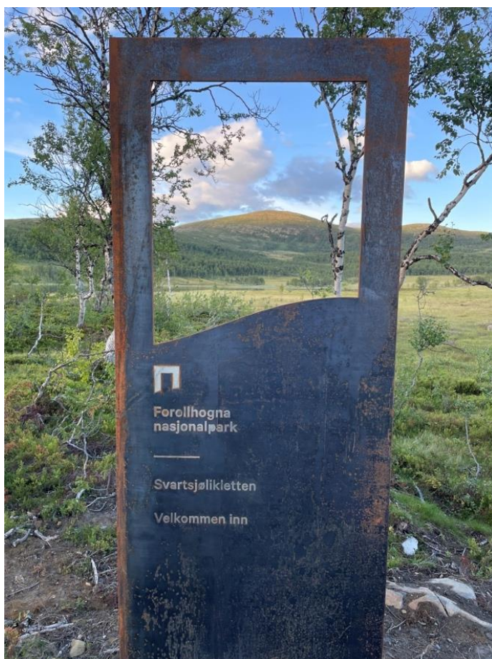
Informasjonspunkt ved Svartsjøen, Kvikne.

Vi skal bidra til å bygge lokal stolthet og eierskap til verneområdene, i samarbeid med kommunene, grunneiere, rettighetshavere og andre lokale aktører.