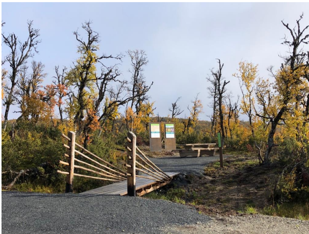
Startpunkt med informasjon ved Såttåhaugen, Vangrøftdalen - Kjurrudalen landskapsvernområde.

Her regnes frivillige lag- og foreninger som har formål folkehelse, friluftsliv og rekreasjon som sine interessefelt. Turlag og grupper/idrettslag som tilrettelegger turposter.