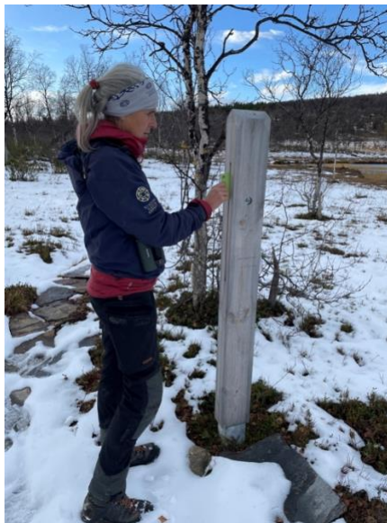
Natursti ved Svartsjøen, Kvikne.