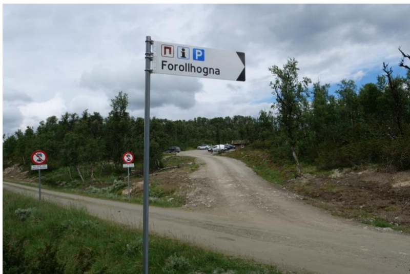
Skilting ved seterveg, Såttåhaugen, Vangrøftdalen-Kjurrudalen landskapsvernområde.

I Forollhogna-området er det et omfattende vegnett. I mange av seterdalene rundt Forollhogna er det skilting i regi av egne lokale veglag. Vi skal ha skilting til våre egne tilrettelagte parkeringer og startpunkt, og dette gjøres i samarbeid med veglagene. Skiltene skal følge standard mal for vegskilting og ta i bruk portalsymbol.