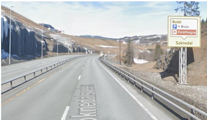
Skilting fra E6 ved Soknedal med navn på verneområdet og bruk av portalsymbol.

I dag er det skilt som viser inn til Forollhogna ved riksveg og fylkesveg som er langt fra verneområdene. For å unngå at området fremstår som en attraksjon for folk som ikke har planlagt reise hit, skal denne type skilting holdes ned på et minimum. Dette bygger opp under strategien at vi skal verne om, ikke markedsføre. Skilting langs offentlig veg er strengt regulert der skiltmyndighetene har ansvar for at skiltingen skal være i samsvar med gjeldende bestemmelser i N300 (Trafikkskilt) . Vegskilt fra hovedveger skal som utgangspunkt lede direkte til tilrettelagt startpunkt for tur, utkikkspunkt, informasjonspunkt og besøkscenter. Skilt fra hovedveg med bruk av portalsymbol og navnet Forollhogna nasjonalpark bør lede til et informasjonspunkt eller tilrettelagte innfallsporter med informasjon om verneområdene i Forollhogna.