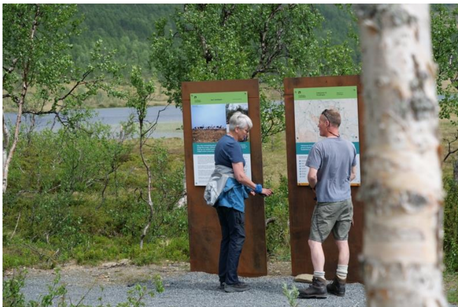
Informasjonspunkt ved Svartsjøen, Kvikne.

Kommunikasjonsplanen er utarbeidet i samarbeid med Trollbinde AS som konsulent.