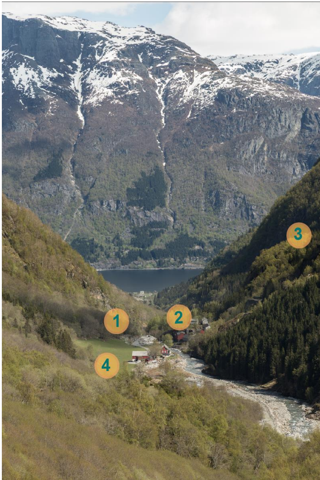
Figur 5: Viser alternative plasseringar av masta utanfor LVO. Omsøkt plassering vil vere bak punkt nr 2, om lag 30 meter lågare i terrenget. Utsikten er frå Gletthaug.

Alternativ plassering nr 1 ligg rett ovanfor parkeringsplassen i ei rasmark med store steinar. Forankring av masta her vil krevje større inngrep i terrenget då det ikkje er fast grunn. Her vil masta stå utanfor verneområdet, men høgare i terrenget og er meir synleg når ein ser ut dalen. Området er også kartlagt som ein viktig haustingsskog med fleire raudlisteartar knytt til styvingstre. Alternativ plassering nr 2 kjem tett på klyngjetunet og er difor ikkje ønskjeleg frå grunneigarane si side. Ei mast her vil ruve i terrenget og kan treffe horisonten når du ser han frå parkeringsplassen og frå tunet og brua. Alternativ nr 4 er nok det alternativet som vil ha mest