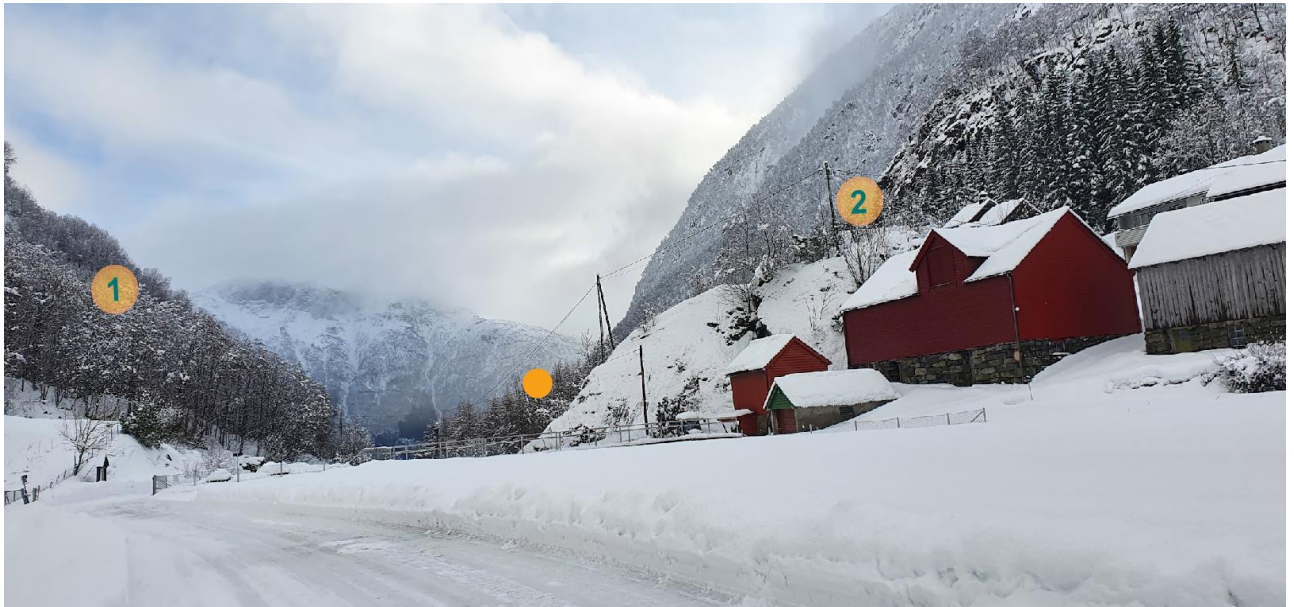
Figur 4: Viser utsikt frå vegen mot omsøkt masteplassering i oransje prikk og alternative plasseringar 1 og 2