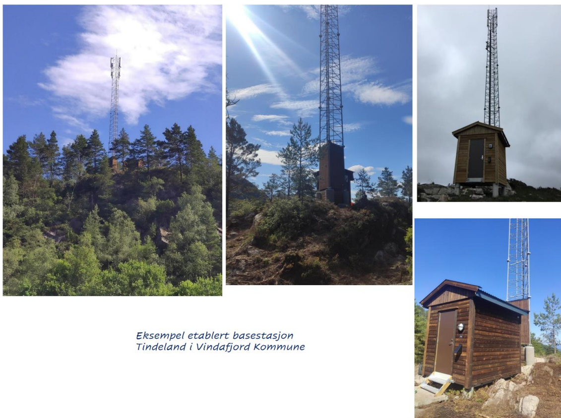
Eksempel etablert basestasjon Tindelands i Vindafjord Kommune

Sjølve masten blir 24 meter høg med mobilantennar i toppen (sjå døme frå Tindelands i Vindafjord).