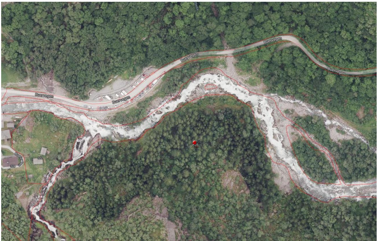
Figur 3: Flybilete av plasseringa