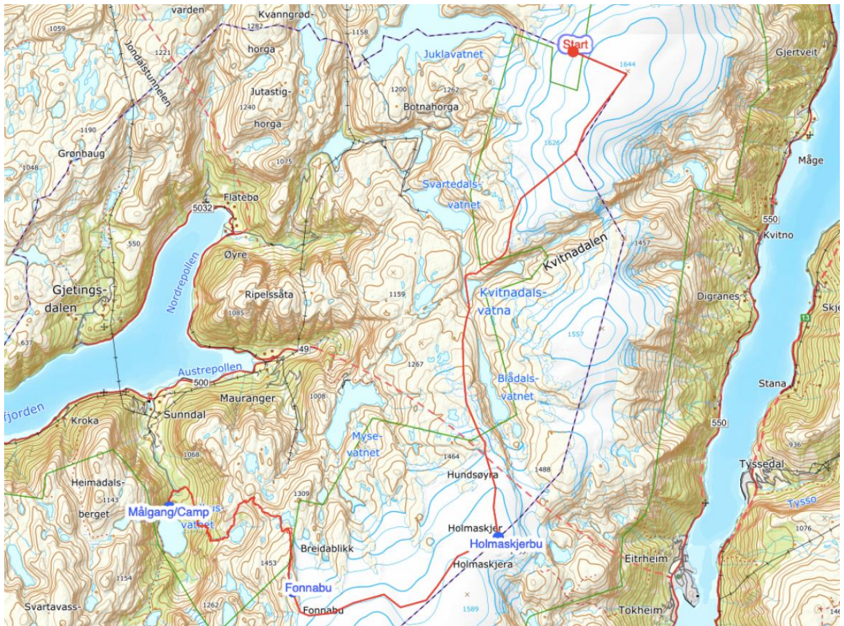
Figur 1: Traseen som deltakarane skal bruke

Det er planlagt å nytte drone 6 gongar i løpet av turen, med ein flytid på 5 minutt på kvar tur. Drona vil alltid vere innafor synsrekkevidde og på motiv som er sentrale for dekninga av programmet. Drona er av typen DJI Mavic 2 Pro på 907 gram, noe som ikke vil gi noen avtrykk eller merker i naturen, og har dimensjonane 322x242x84 mm (lengde x bredde x høyde). Drona avgir ein gjennomsnittleg støy på 74.3 dB når han letter ved sida av fotografen med ein avstand på 4 meter. Droneoperatør er sertifisert og har erfaring med sporlaus ferdsel. Det skal etterstrebast å ikkje fly med drona i nærleiken av dyr, hekkeplassar eller hi. Så langt det er mogleg vil fyking skje på vekedagar for å unngå unødig forstyrning av friluftslivet.