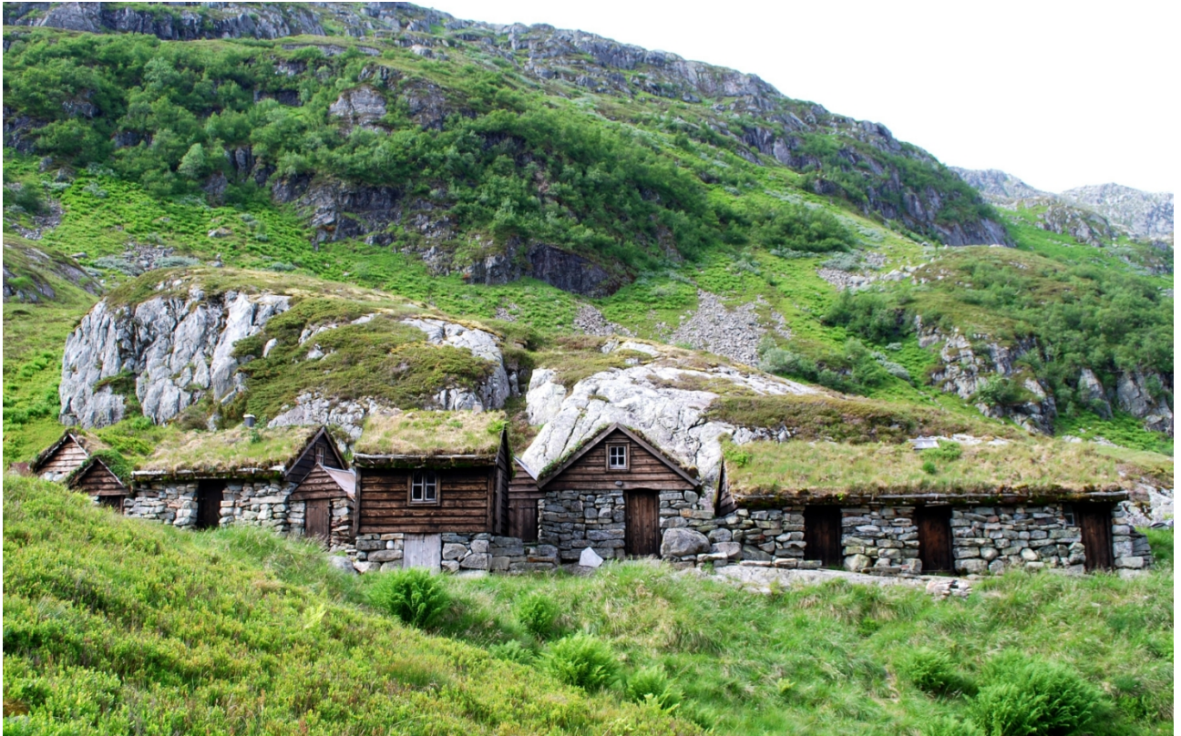
Biletet viser Bjørndalssetra, det omsøkte tiltaket er selet lengst til høyre i biletet.