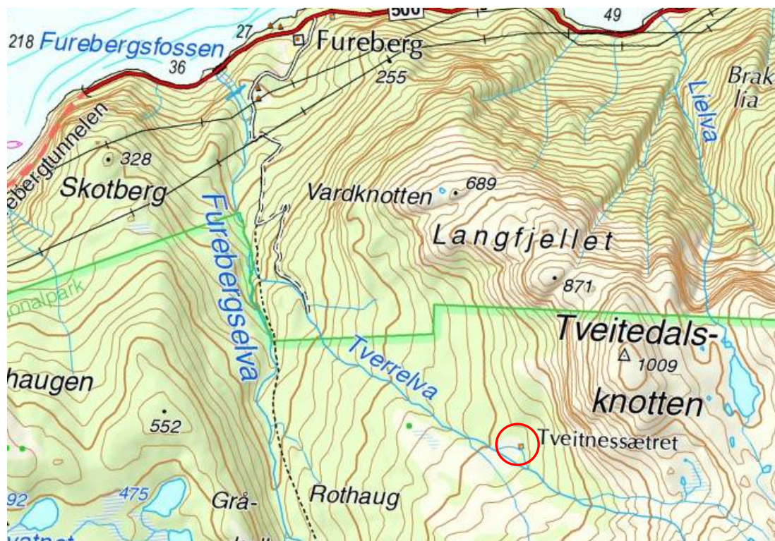
Figur 1 syner lokalisering av Tveitnesettra - Kvinnherad kommune.

Grunneigar meldte inn saka til forsikringsselskapet etter brannen. Etersom dette var ein forsikringssak vart Botakst AS engasjert av forsikringsselskapet Fremtind AS til å vera ansvarleg for søknad om nyoppføring. Botakst AS er lokalisert på Kvernaland i Sandnes kommune. Ansvarleg søker Botakst AS fekk rammeløyve frå Kvinnherad kommune til igangsetjing av tiltaket i brev datert 11.06.2020. Det vart ikkje sendt kopi til nasjonalparkstyret. Av postlista til kommunen kjem det fram at søker har hatt dialog med Kvinnherad kommune, men det vart her ikkje vist til at stølshuset låg i nasjonalparken eller at tiltaket måtte avklarast med nasjonalparkstyret.