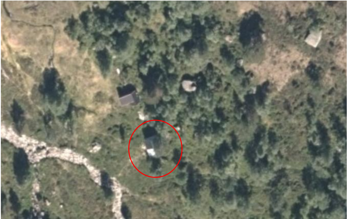
Figur 2 viser flyfoto med aktuell bygg merka med raud sirkel.