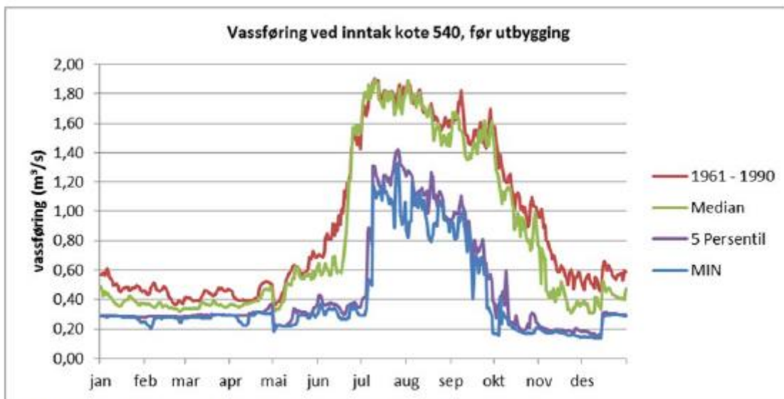
Figur 5: Plott som viser sesongvariasjon i middel/median- og minimumsvassføringer gjennom året

Figur 5 viser vassføringa i dag, der ein kubikkmeter tilsvarar 1000 l/s. Dette skriv dei i søknaden: