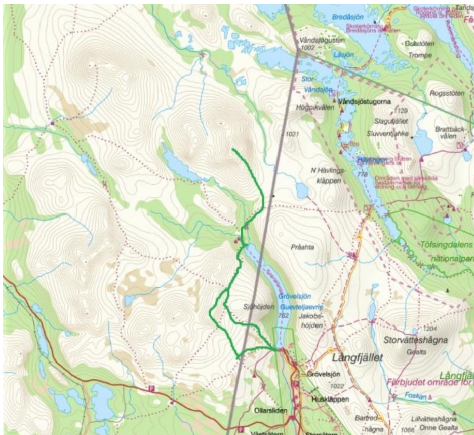
Traseer for turer på sommer/høst (grønn linje).