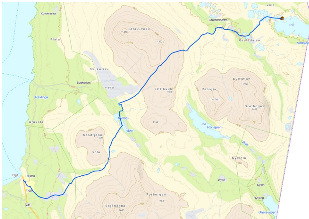
Aktuell trasé fra Elgå til Stor Vonsjøen.