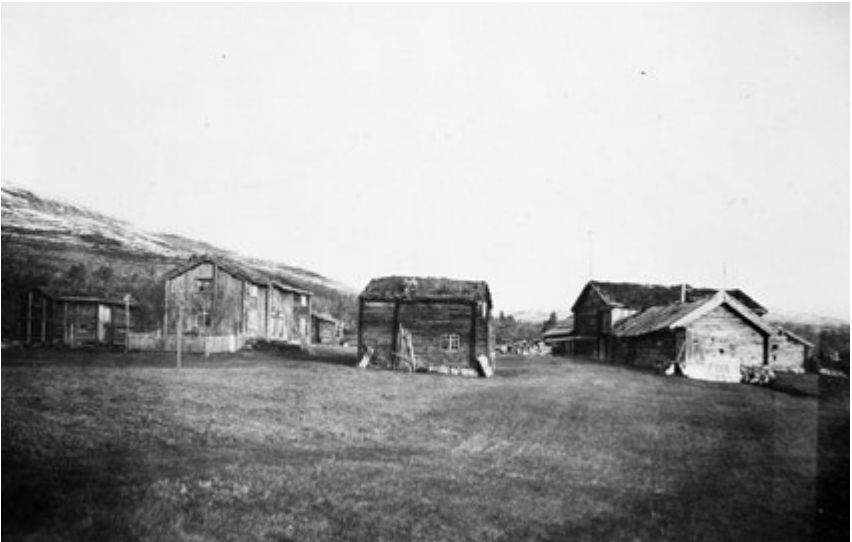
Gammelgården i Sylen.

Håpet om fortsatt fast bosetning i den lille grenda, knytter seg til et par modige svensker som vil gi nytt liv på Sylseth.