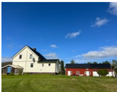
Gården Sylseth som Sylgubben bygde med sine egne hender.