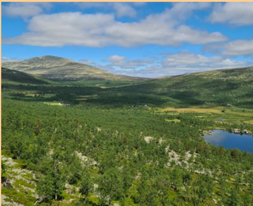
Sylengrenda har båtanløp i nordenden av Grøvelsjøen. Bak ser vi Grøthogna (1401 moh.).