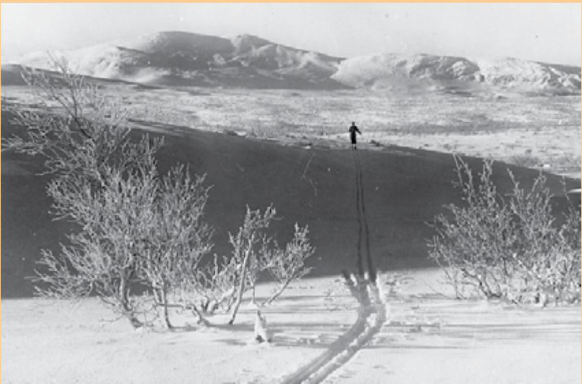
På skitur mellom Sylen og Svukuriset. Fjellet i bakgrunnen er Elgåhogna (1460 moh.).

Mangt et bymenneske som har steget i land har nok gjort seg noen tanker om hvordan tilværelsen må arte seg for dem som lever livene sine her inne året rundt. For i uker og måneder når isen fryser til om høsten, og når den tiner om våren, er folket i Sylen overlatt til seg selv.