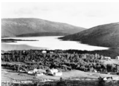
Utsikt over Sylen i 1945.

Etterhvert utover på 1900-tallet fant tre brødre ut at de ville ha hver sin gård. Eldstemann Ole Iver slo seg til på vestsida av elva Grøvla og kalte gården sin Sylseth, Johan bygde Ryvang ned mot Grøvelsjøen og den yngste, Ole, tok over farsgården, Gammelgården.