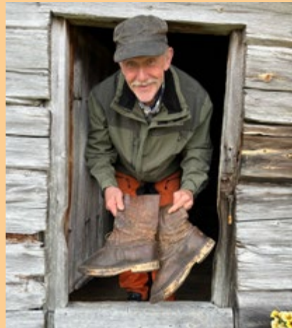
Folket på Femundshytta har vært selvhjulpne. Støvler med bjørkesåler ble laga på gården.