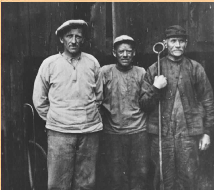
De hadde et hardt liv, arbeiderne i smeltehyttene.