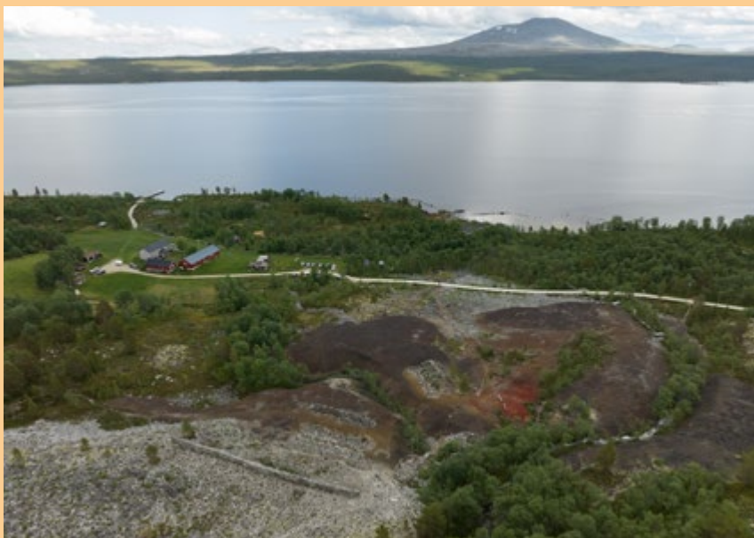
Femundshytta, ei smeltehytte innafor Circumferensen i drift fra 1743 til 1822.