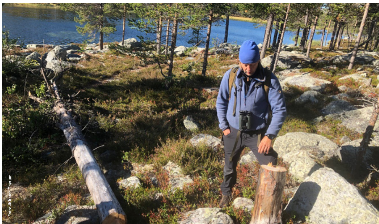
Ulovlig hogst langs Røavassdraget.

Statskog har 17 åpne buer innenfor verneområdene SNO har hatt hovedansvaret for utkjøring av ved til disse buene, samt at naturopsynet har bidratt med ettersyn og vedlikehold, sammen med Statskog sitt eget personell.