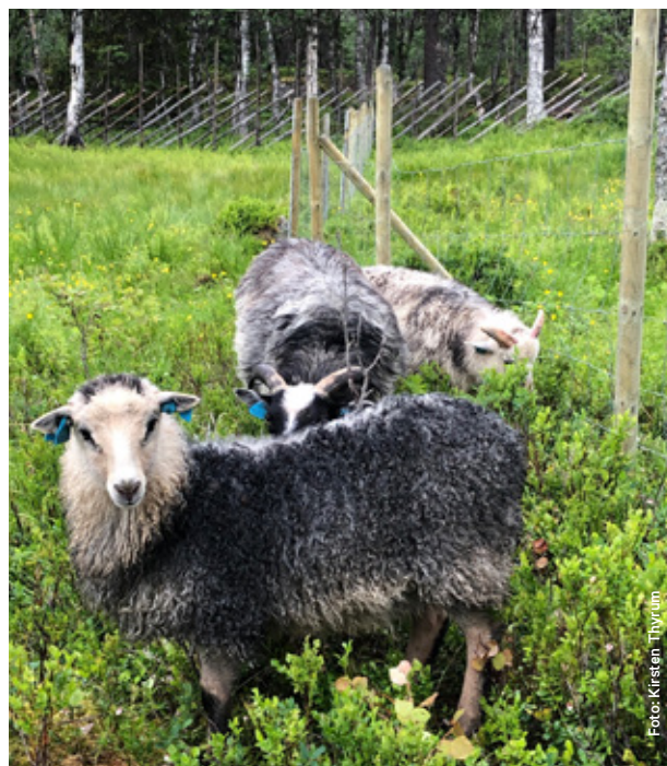
Beitende gammelnorsk spelsau på Gutulivollen.

Det gjort et omfattende restaureringsarbeide av «Vognveien» mellom Langen og Langtjønaområdet /