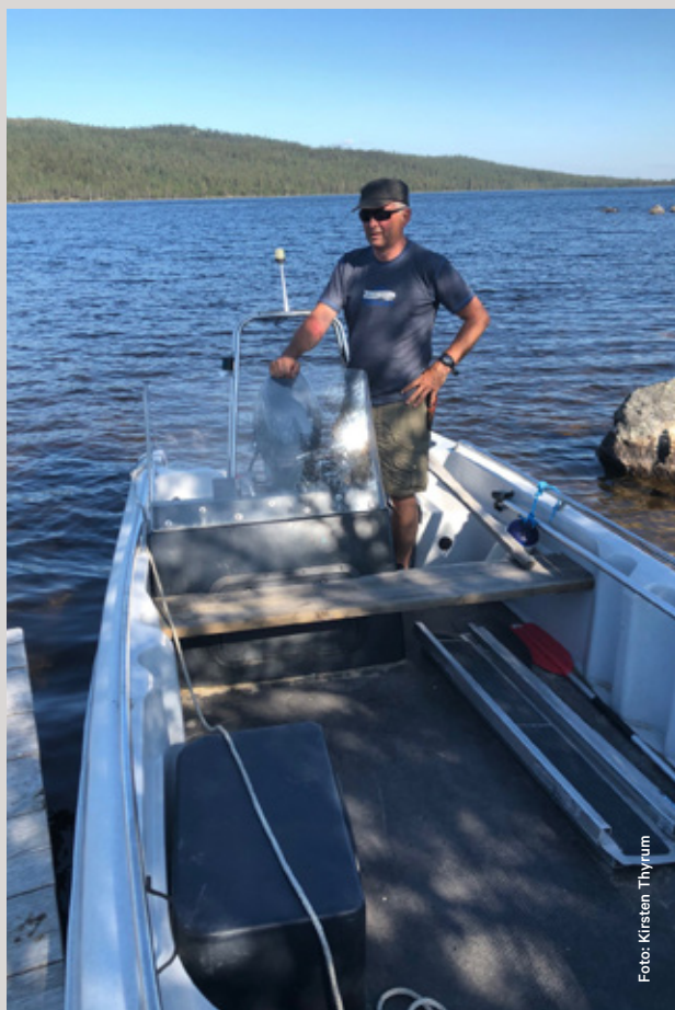
Båttransport for de med særskilte behov inn til Gutulia nasjonalpark og setrene.

Det ble ikke foretatt slått av setervollen i regi av SNO, men dette ble utsatt til sommeren 2020.