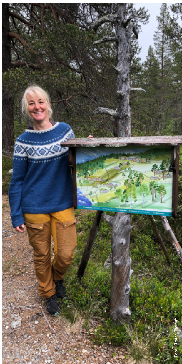
Ny oversiktstavle i Gutulia nasjonalpark.

Som skjøtselstiltak og for å skape mer dyreliv på vollen, så ble det gjerdet inn et mindre område på Nedpåvollen, der det beitet gammelnorsk spelsau.