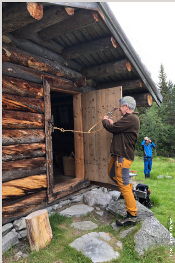
Åpning av ny utstilling om setring i Gutulia gjennom 200 år.