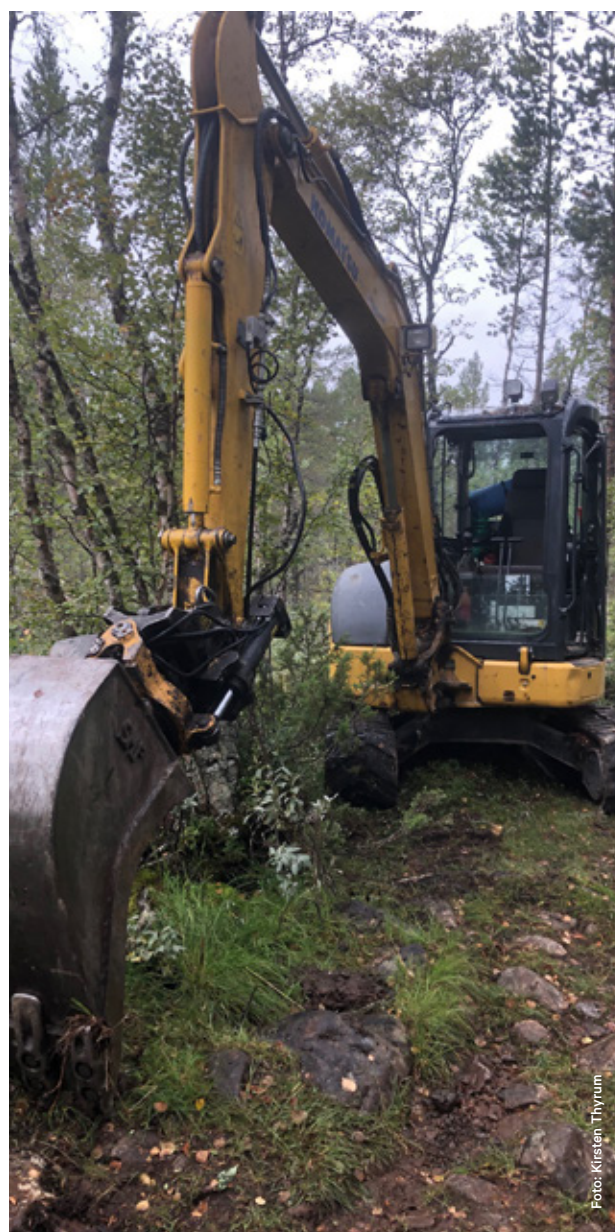
Restaurering av vognveien mellom Langen og tømmerrenene.

Det legges ut saker på facebookside for Femundsmarka og Gutulia, sånn ca en gang pr måned. På denne måten forsøker vi å henvende oss mer direkte til brukerne i området. Nasjonalparkstyrets hjemmesider blir i hovedsak benyttet til forvaltningsrelatert informasjon for å bidra til åpenhet om forvaltningen.