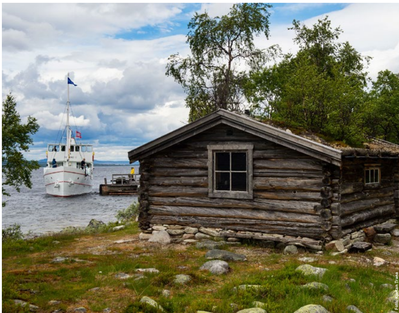
Båten Fæmund II legger til kai ved Røosen.

Det er lagt klopper på Valdalsfjellet langs stien inn fra Valdalsfjellet mot Svukuriset. Prosjektet er gjennomført i samarbeid med Engerdal fjellstyre, og er nå slutført.