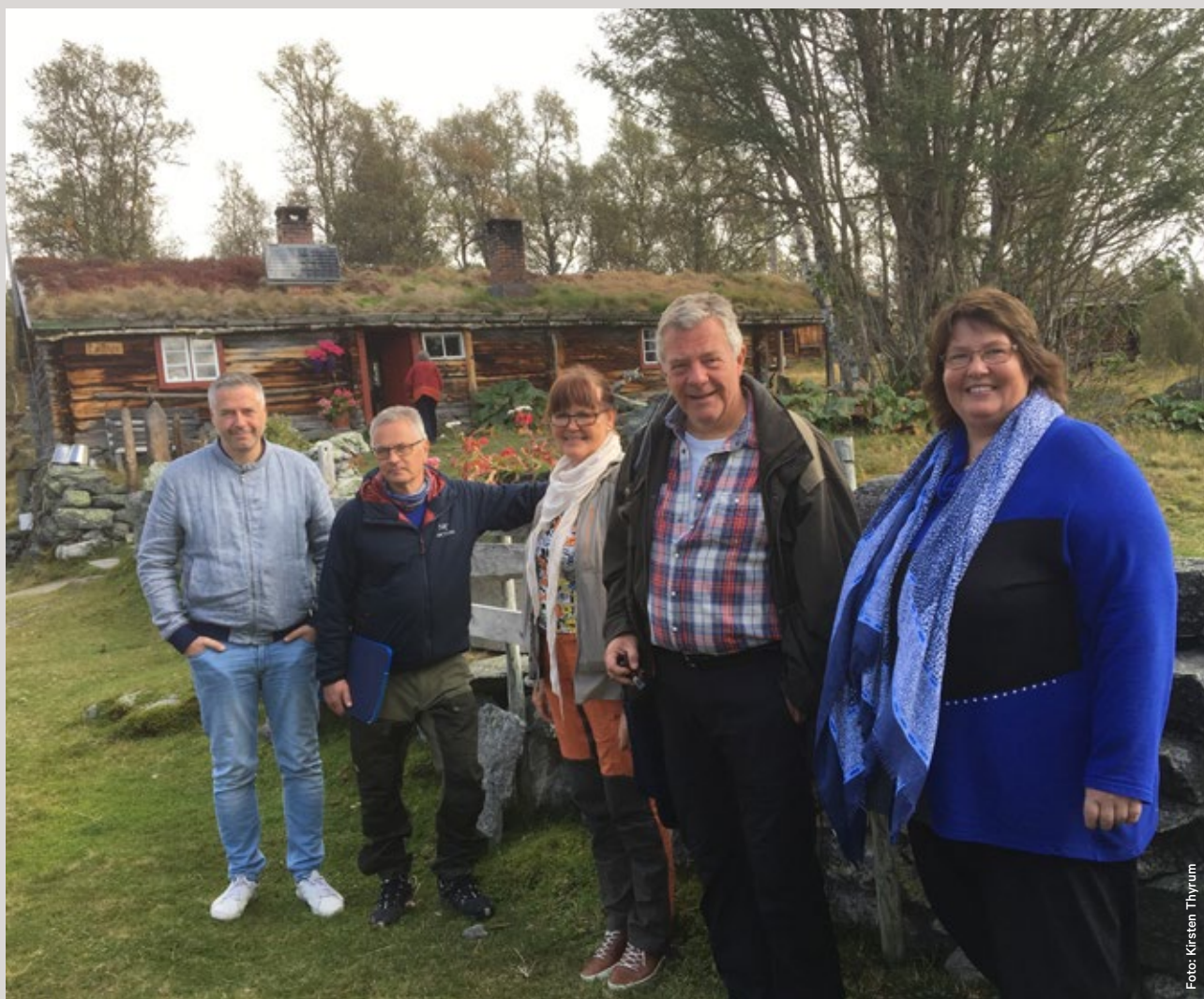
Nasjonalparkstyret på befaring til Ljøsnavollen.

Årsrapporten gir en samlet framstilling av nasjonalparkstyret og nasjonalparkforvalter sitt arbeid, og gjennomførte tiltak og møter.