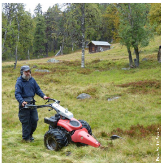
Skjøtsel i Gutulia.

Det er ikke utarbeidet forvaltningsplan for dette området.