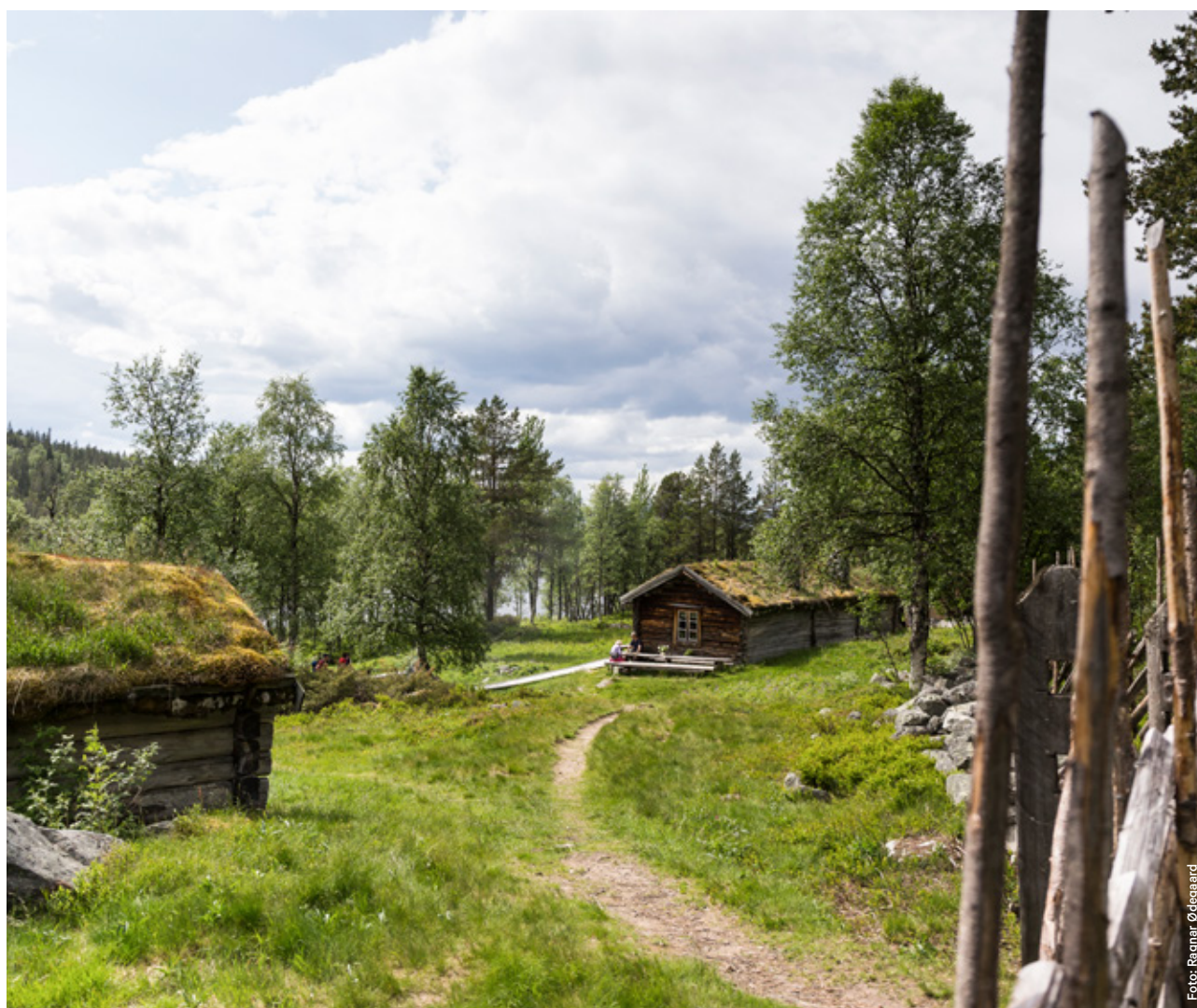
Nedpåvollen i Gutulia.