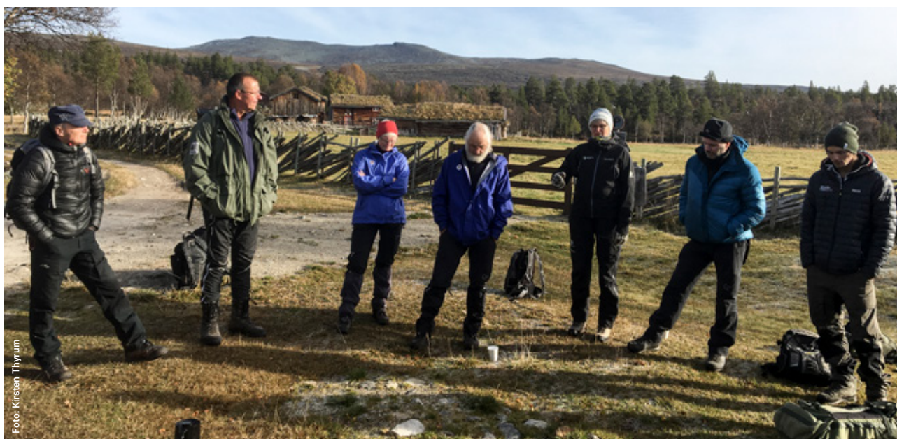
Fagdag om kløppling ved Ljøsnvollen.

Statskog har 17 åpne buer innenfor verneområdene SNO har hatt hovedansvaret for utkjøring av ved til disse buene, samt at naturopsynet har bidratt med ettersyn og vedlikehold, sammen med Statskog sitt eget personell.