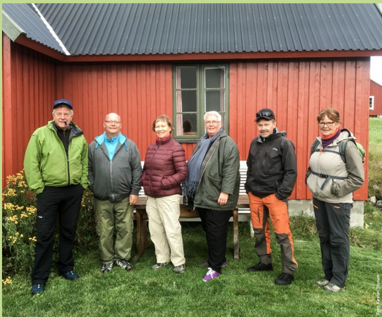
Nasjonalparkstyret i forbindelse med befarings til Svukuriset september 2016.

Årsrapporten gir en samlet framstilling av nasjonalparkstyret og nasjonalparkforvalter sitt arbeid, og gjennomførte tiltak og møter.