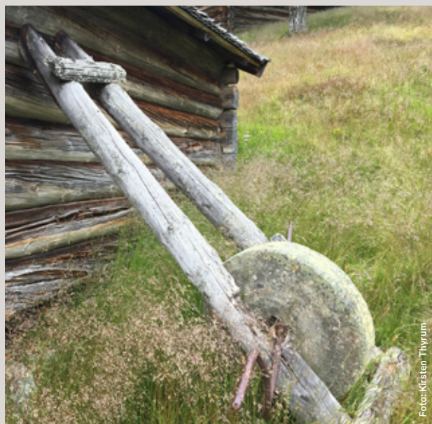
Slipstein ved Gutulisetra.