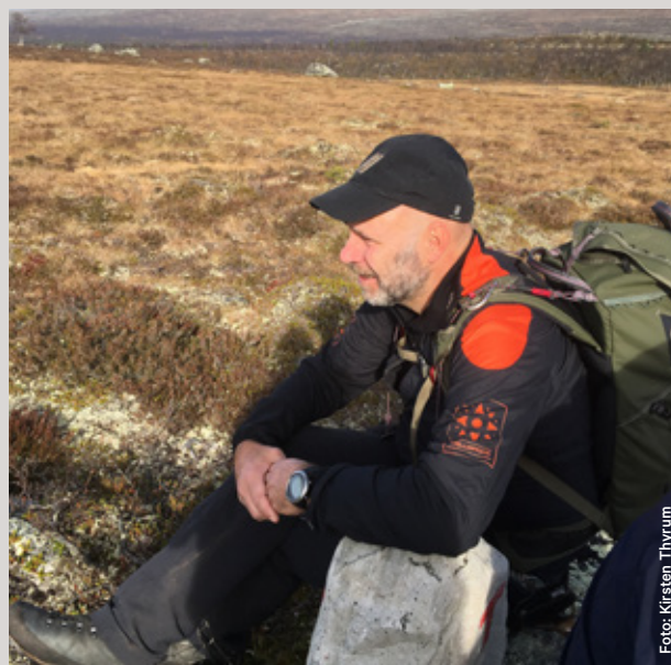
Naturoppsyn ved Engerdal fjellstyre.