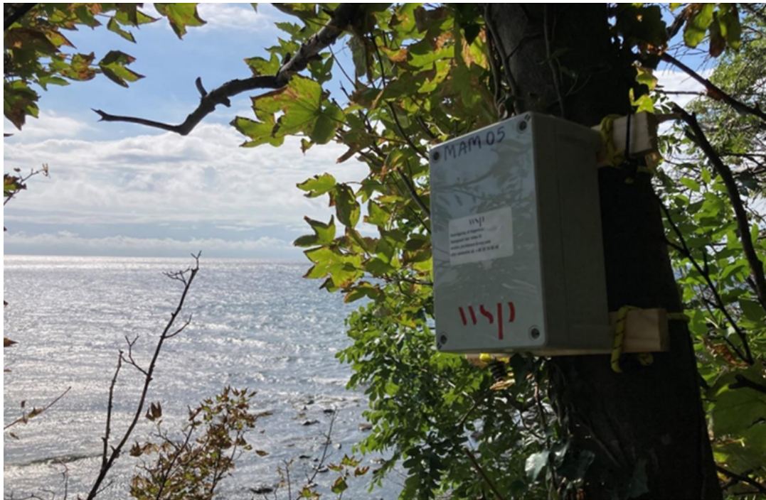
3 – Bat detector on the southern coast of Bornholm