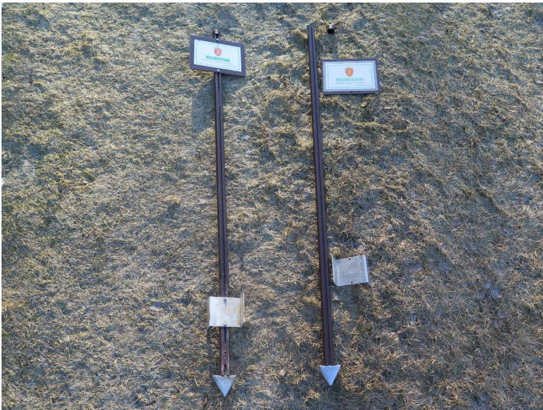
Foto: Aluminiumstang med spyd, stabilisator og hette.

Et annet alternativ er bruk av et s.k. fjellanker. Dette er en hylse i syrefast stål som er påsveiset et 20 mm jern. Aluminiumstanga er festet i fjellankeret med unbraco skruer. Poenget er at man da kan klare seg med et mindre bor og at man ikke trenger bore nytt hull dersom stanga må skiftes ut.