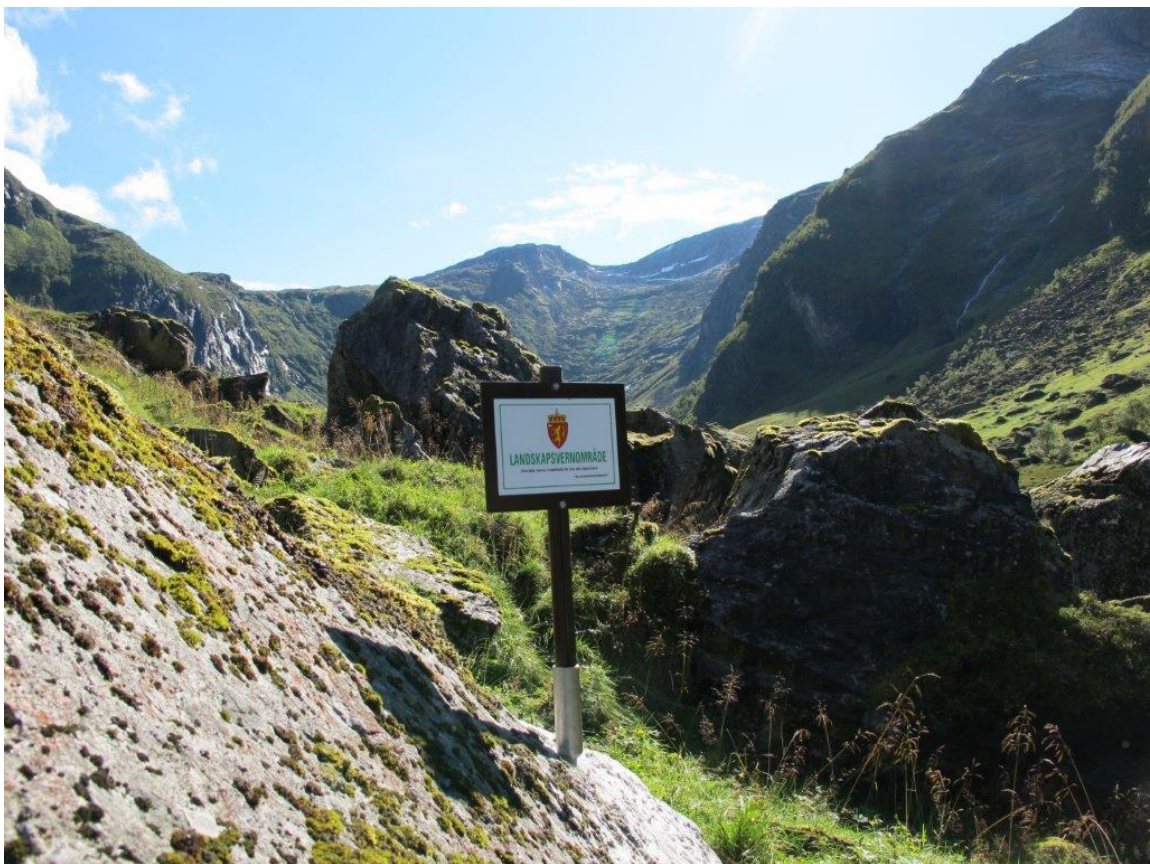
Aluminiumstang festet til fjellanker.