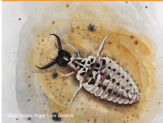
Illustrasjon: Inger Lise Belsvik

Oppmøte på Besøkssenteret kl. 12. Gratis arrangement