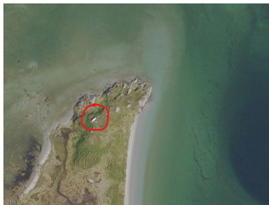
Flyfoto tatt 13.07.2024. Rød ringer markerer opplagt båt.

Namsskogan fjellstyre søker om dispensasjon fra vernebestemmelsene for utlegging av ny båt ved Jengelskardvatnet i Børgefjell nasjonalpark. Fjellstyret har hatt båt ved Jengelskardvatnet til allmenn benyttelse i mange år. Denne har vært plassert på tange i vestre del av vannet. Gammel båt ble transportert ut høsten 2025 og ønskes erstattet med ny båt.