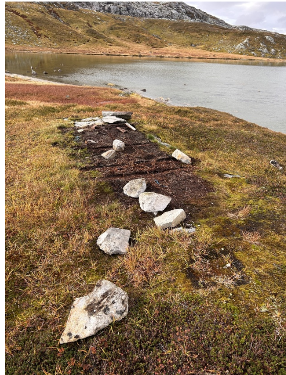
Eksisterende båtopplagsplass ved Jengelskardvatnet som ble ryddet høsten 2025