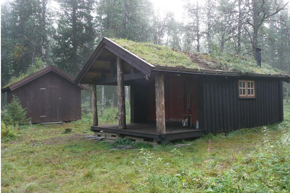
Bilde 1: Tak med røykrør pr d.d. Mest sannsynlig tilpasset av blikkenslager. Ukjent diameter men antas å være 12-15 cm. Høyde over tak antatt 0,8 m.

Branntilsyn 2025: Krav om bytte av røykrør