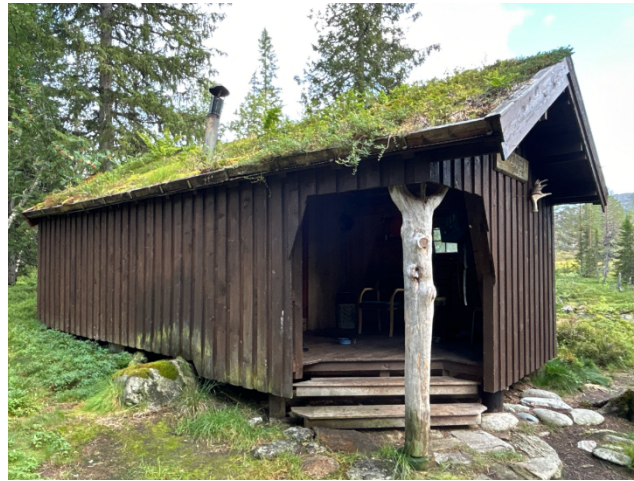
Namskrokhytta august 2024

Etter § 11 legges det til grunn at eventuelle kostnader knyttet til å hindre eller begrense skade på naturmiljøet skal bæres av tiltakshaver. Etter § 12 vurderes tiltaket opp mot miljøforsvarlige teknikker og driftsmetoder. Utskifting av eldre røykrør til nye isolerte piper som tilfredsstillende gjeldende branntekniske krav anses som en nødvendig og sikkerhetsmessig forsvarlig oppgradering. I tråd med forvaltningsplanens føringer for bygg og anlegg skal tiltaket utformes slik at visuell påvirkning reduseres mest mulig, blant annet gjennom valg av farge, utforming og begrenning av høyde. Arbeidet forutsettes gjennomført på en måte som i minst mulig grad påvirker omgivelsene.