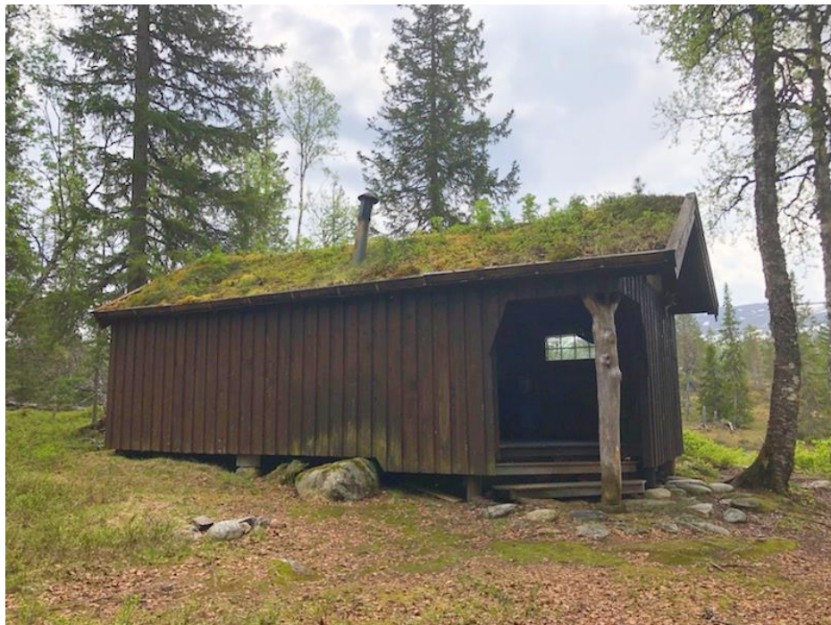
Bilde 1: Tak med røykrør pr d.d. Mest sannsynlig tilpasset av blikkenslager. Ukjent diameter men antas å være 12-15 cm. Høyde over tak antatt 0,9 m.

Branntilsyn 2025: Krav om bytte av røykrør