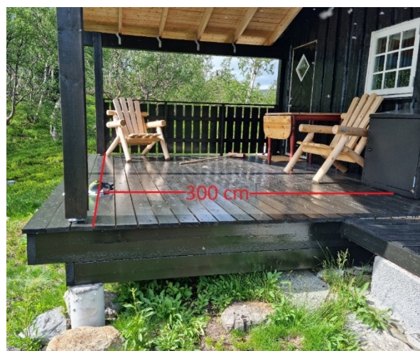
Rød strek marker godkjent lengde på gulv og tak