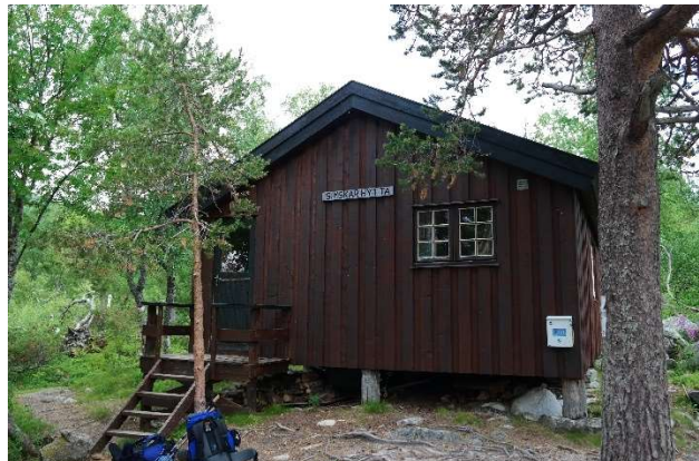
Vestre vegg hvor det søkes om å bygge ny trapp, skifte dør og sette inn ekstra vinduer. Trappen er tenkt å dekke hele hyttens bredde og skal fungere som sitteplasser.

De andre punktene som er beskrevet i søknaden med rehabilitering av eksisterende vinduer, maling og ny ytterdør regnes som vedlikehold og trenger ikke særskilt dispensasjon. Dette under forutsetning av at hyttas utseende ikke endres i vesentlig grad. Det vil si at fargebruk og materialbruk skal være tilsvarende som i dag. Bygningsmessige endringer som påvirker areal eller høyde er søknadspliktig.