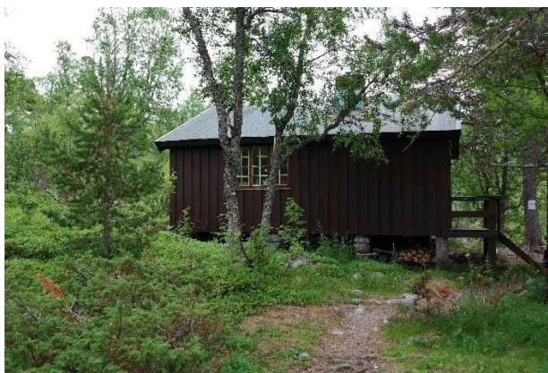
Nordre vegg, uthus med nytt utedo er planlagt satt opp til venstre for bildets ytterkant.

Grane nasjonalparkkommune planlegger, sammen med Statskog og nasjonalparkforvaltningen en større oppgradering av innfallsporten ved parkeringsplassen i Simskardet. Noe som kan øke kvaliteten på området og gi de besøkende bedre opplevelser enn det som tilbys i dag. Tilgangen til ulik informasjon vil bli langt bedre. Tiltakene som planlegges gjennomført i Simskardet er i tråd med besøksstrategien og beskrevet i tiltaksplanen, deler av tiltaket finansieres av Miljødirektoratets tiltaksmidler (bestillingsdialogen)