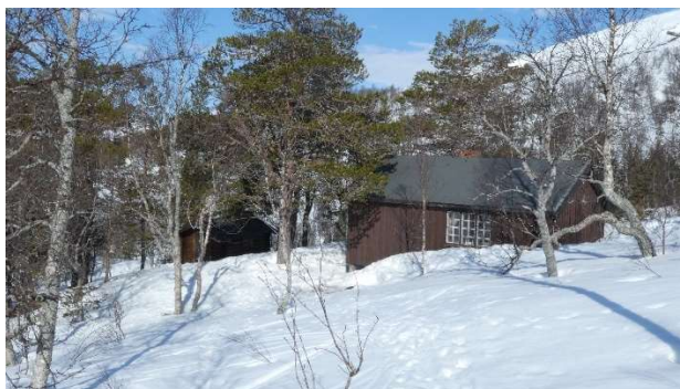
Vegg mot sør hvor det planlegges å sette inn ekstra vindu. Til venstre for hytta vises uthuset som skal flyttes til høyre for hytte. Det vil si at uthuset blir mindre dominerende enn i dag.