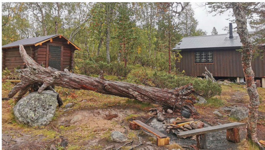
Bål plass vises nederst til høyre på bildet. Frittstående utedo planlegges plassert på sørøstsiden av uthuset (på «baksiden» av uthuset sett fra bål plassen)

Ut fra dette søker Statskog SF nå om å få endret dispensasjonen til å sette opp frittstående utedo i samme område. Det vil si på siden av uthuset. Tiltakshaver har en prefabrikkert utedo de ønsker å transportere inn på vinterføre for montering på barmark. Endelig plassering vil bli foretatt innenfor den rammen som følger av dispensasjon.