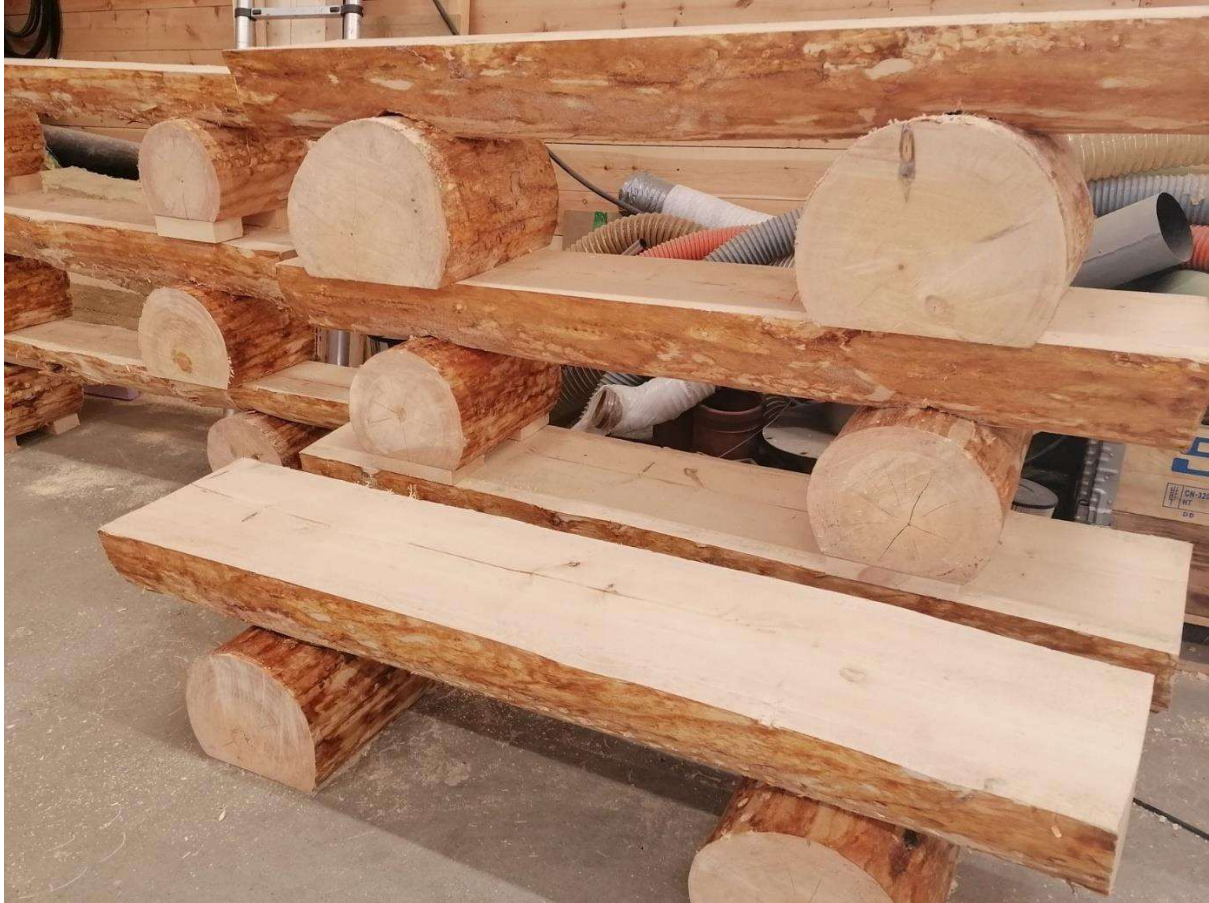
Bålbenkene, «halvkløyvinger», er ca. 160 cm lange

Benkene rundt bålet er lite tiltalende og stort sett laget av restmaterialer o.a. Vi har gått til innkjøp av flere bålbenker fra Susendal sag som vi ønsker å plassere ut ved ulike hytter. Vi ønsker å kunne plassere to av disse benkene ved bålplassen utenfor Simskardhytta. Benkene kan eventuelt fraktes opp med skuter i vintersesongen. Benkene ser slik ut: