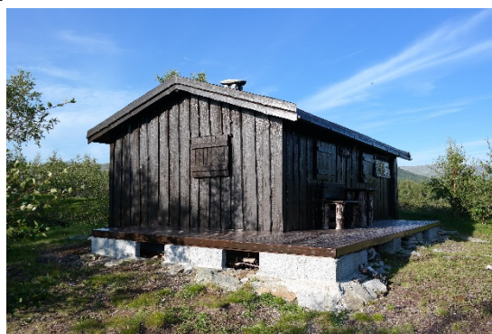
Status hytte 2015 før iverksetting av tiltak

Som det fremgår av både søknad og vedtak er det tydelig at taket ikke skulle stikke mer enn 3 meter utover plattung.