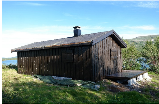
Status hytte 2015 som viser størrelse på platting på tverrvegg

Når det gjelder etablering av gulv/terrasse svarte tiltakshaver følgende i brev av 26.01.2021: