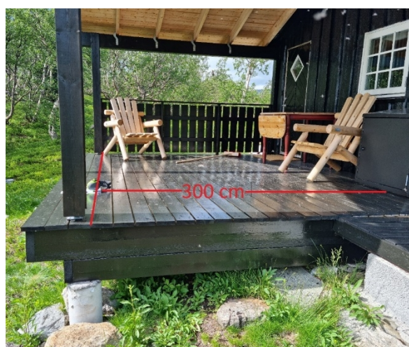
Rød strek marker godkjent lengde på gulv og tak