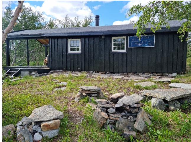
Status juli 2023

Oppsummert betyr dette at nasjonalparkstyret er gitt myndighet til å gi dispensasjoner for tiltak i et verneområde så lenge disse er innenfor rammen til forskrift og naturmangfoldlovens bestemmelser. I landskapsvernområder skal tiltakets påvirkning på landskapet, alene eller sammen med andre tiltak, vurderes ved avgjørelsen om det skal gis dispensasjon. Det er altså ikke bare det enkelte tiltak/bygningsselement som skal vurderes. Vilkårssetting kan brukes for å avgrense tiltakets påvirkning på landskapet. Statens naturoppsyn skal utføre kontroll på at gitte dispensasjoner er