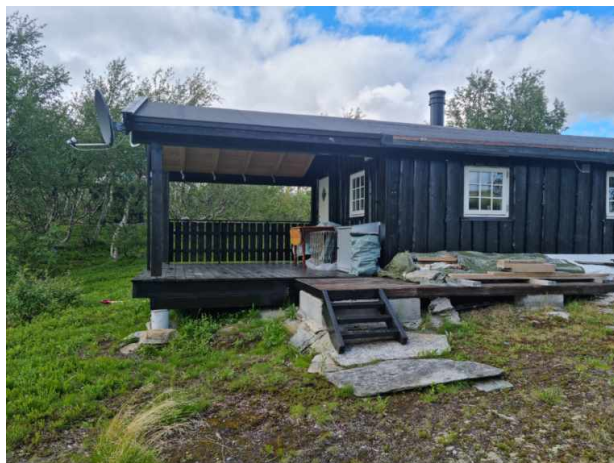
Status juli 2022

Når det gjelder vilkårssetting om utforming og fargebruk kan dette kun settes ved godkjenning av tiltak. En kan ikke komme og kreve endret fargebruk på eksisterende installasjoner så lenge disse er godkjent. Om andre hytter har annen fargebruk er derfor irrelevant i denne saken, vilkårsbehandling omfatter tiltakshavers objekt og vurderinger opp mot dette ift. visuell effekt på området. Andre hytteeiere kan bli stilt overfor de samme vilkårene hvis de søker om bygningsmessige endringer.