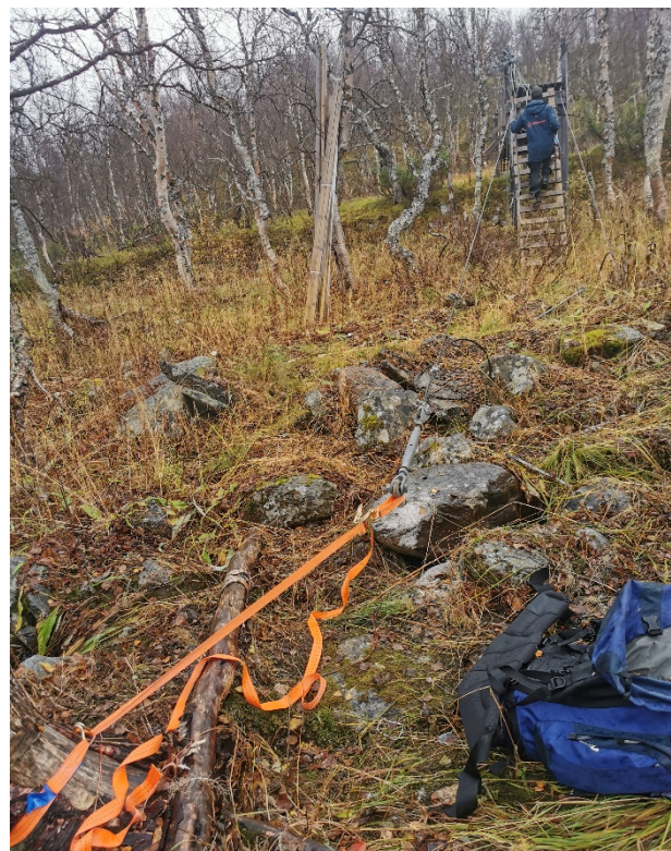
Oktober 2023 – forankring av bru midlertidig «forsterket» med lastestropper.