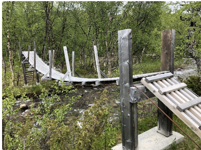
Status bru 2019.