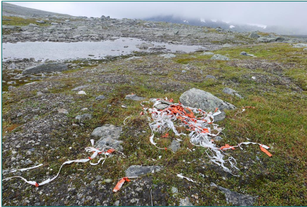
Søppel langs konvensjonsgjerdet.