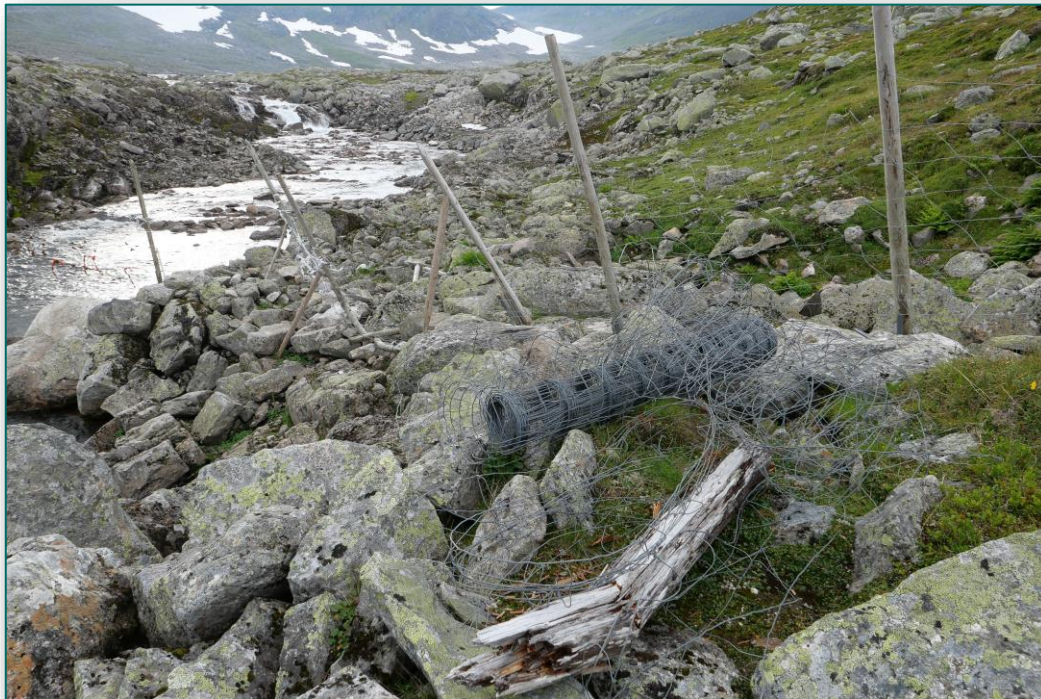
Konvensjonsgjerde vest for Jetnamen.

SNO oppfordrer nasjonalparkstyret å vurdere om eier/ansvarlig for gjerdet skal pålegges krav om retting - dvs opprydding.