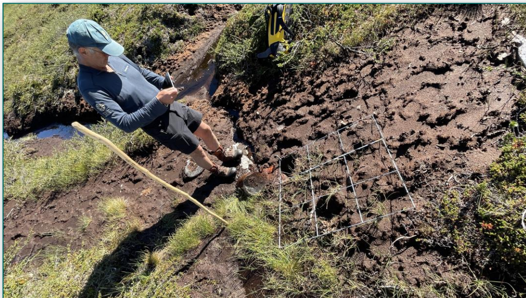
Effektmåling/bevaringsmål. Overvåkingsposter for revegetering.