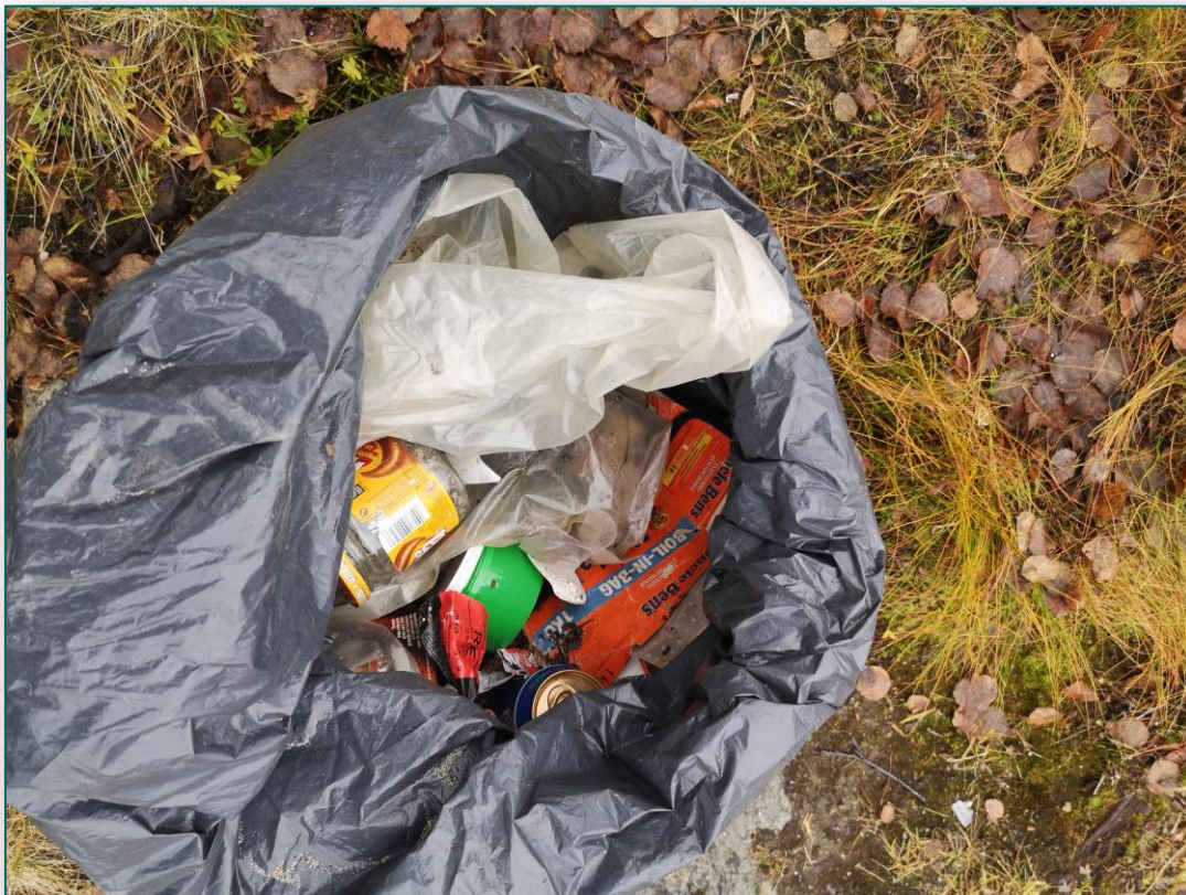
Rydding av søppel etter turfolk.

Statskog fjelltjenesten og fjelloppsynet har i tillegg brukt tid i verneområdene på direkte oppdrag for nasjonalparkstyret. Dette har hovedsakelig vært forskjellige typer tilrettelegging. Det er brukt betydelig tid på registreringsarbeid for SNO i nasjonale overvåkingsprogram på jerv, fjellrev og kongeørn. Fjelloppsynet og Statskog fjelltjenesten er dessuten tilstede i verneområdene i forbindelse med oppdrag for grunneier og oppgaver i statsalmenning (drift av hytter, jakt-/fiskeoppsyn osv). Samlet tilstedeværelse i verneområdene av personell med oppsynsmyndighet fra Statskog fjelltjenesten, fjelloppsynet og SNO utgjør anslagsvis nesten ett årsverk.