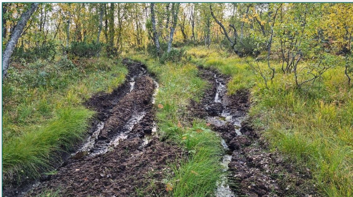
Kjørespor fra Øyum.

Langs disse traseene kan det være aktuelt med avbøtende tiltak i form av markforsterkning og reparasjoner.