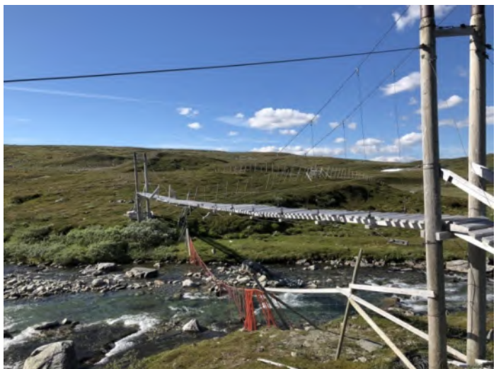
Ranserbrua sett fra sør