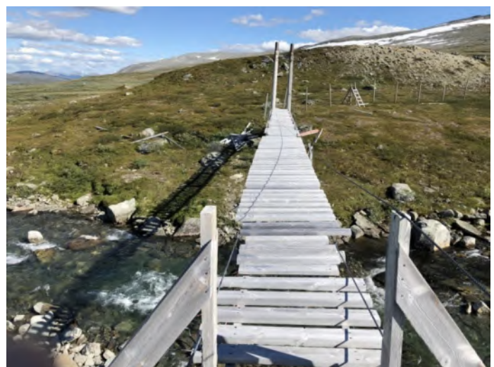
Ranserbrua sett fra nord