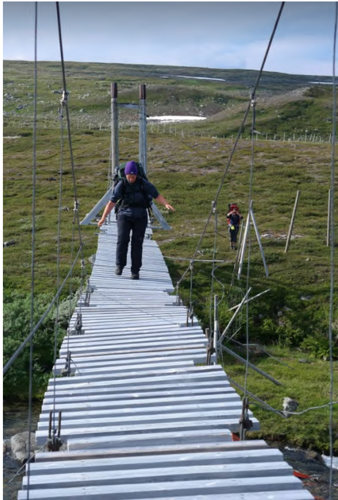
Balansering på Ranserbrua i 2015