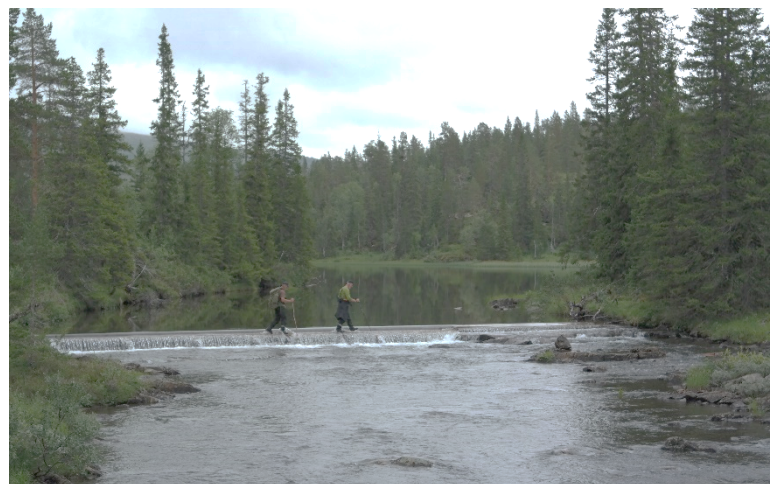
Terskel i Nerflya 2014

Søknaden er sendt Tjåehkere Sijte til orientering. De har kommet med tilbakemelding om at det ikke er ønskelig at dispensasjon gis etter 25. april pga. reinkalving i området.