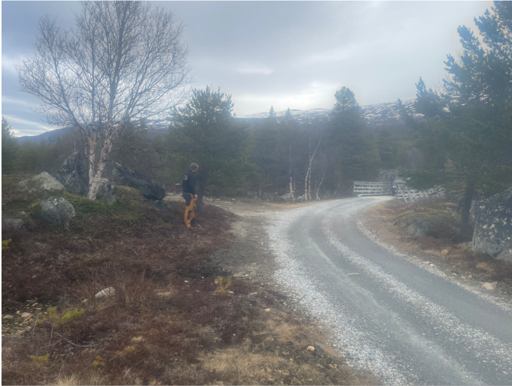
Svingen sett frå vest.