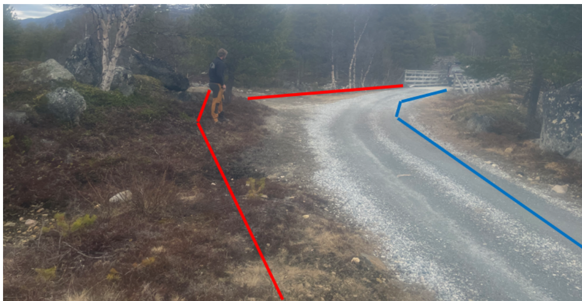
Vegetasjon og masse blir fjerna på høgre sida av den raude streken. På høgre sida av den blå streken blir det plassert stein eller laga ei grøft.