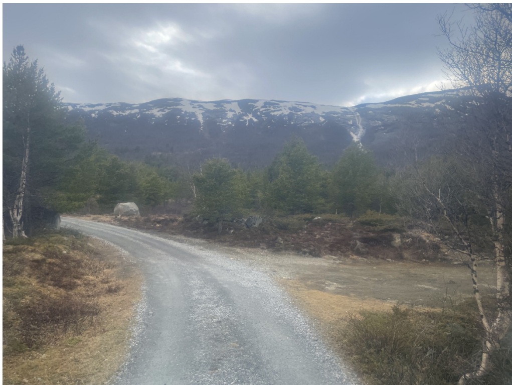
Svingen sett frå aust.