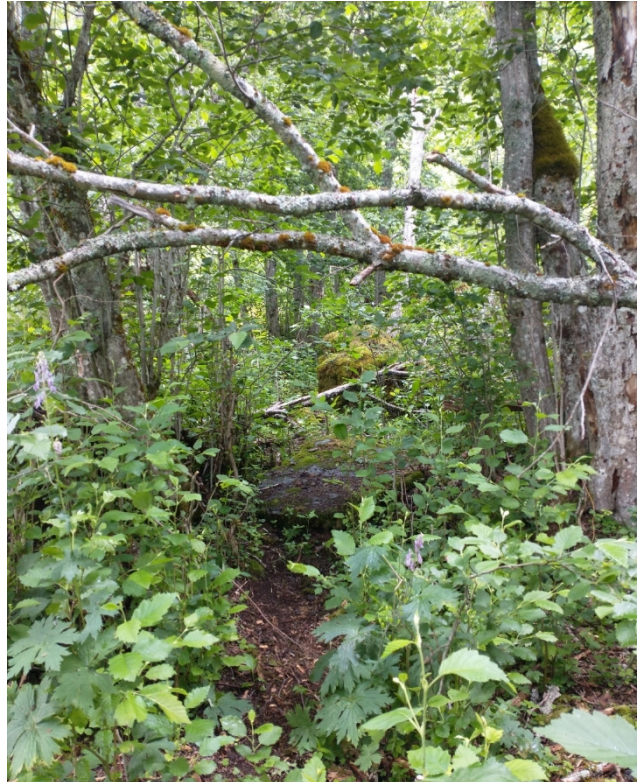
Figur 3 Bilete er teke frå støshuset/postkassen mot utedoens plassering.

Det er i dag eit tråkk inn i skogen mellom selet/postkassen og inn mot kor utedoen vert plassert. Mest truleg er tråkket laga av hjort.