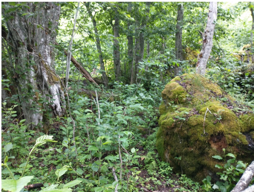
Figur 4 Plassering av utedoen.

Utedoen skal plasserast ved den store steinen til høgre i bilete under.