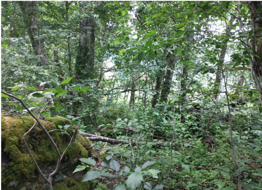
Figur 5 Bilete er i frå den plasseringa utedoen får og mot stølshuset på Berget

Det er mykje småskog og noko større skog i det området som utedoen vert plassert. Tiltakshavar må hogge litt skog for at helikopteret skal klara å setje utedoen på plass.