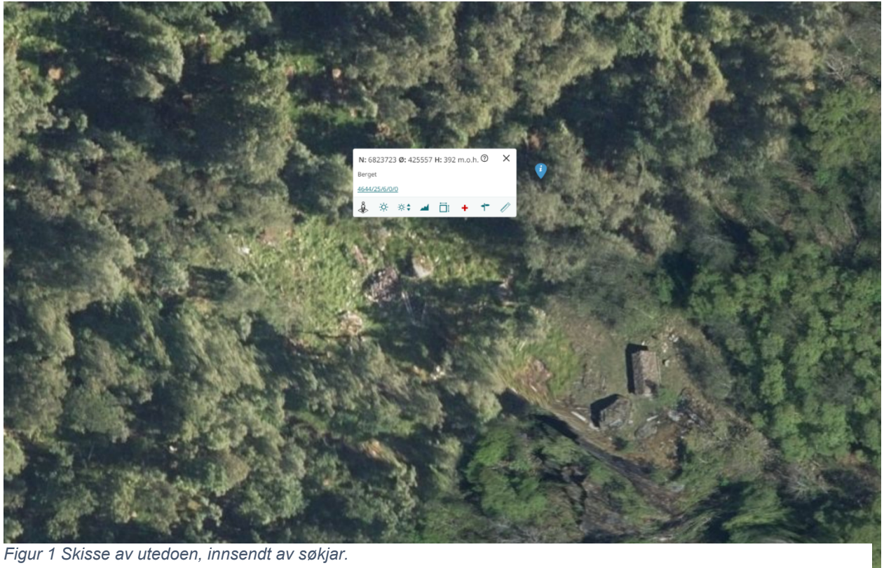
Figur 1 Skisse av utedoen, innsendt av søkjar.

For å sjå på rett plassering var forvaltar og søkjar på Berget 7 juli 2023.