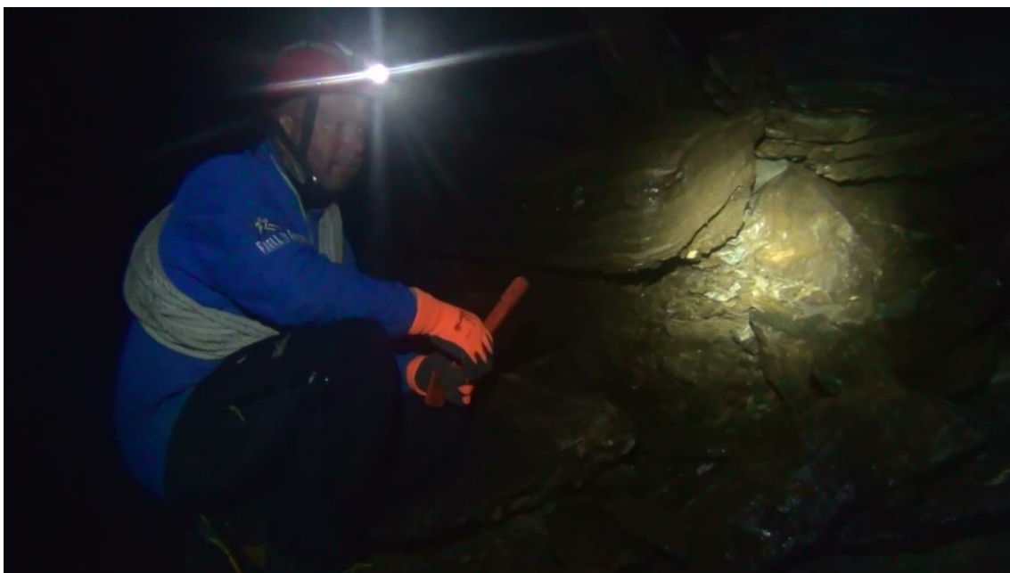
Frå ein tur i grottene i sommar.

I Dumdalen har det også i år stått oppe ein ferdselsteller for å måle omfanget av fotturister inn til grottene. Tala på ferdselen i Dumdalen for i år er enno ikkje klare, avdi at avlesinga av teljaren har stoppa opp. Ser ein på ferdsel basert på observasjonar, er det vel på det jevne med trafikk. Det er leirskulane som er dei desidert største brukarane, og også dei vi har mest kontakt med i fjellet. Det er ei prioritert oppgåve å få opp informasjon om bruken av grottene ved inngangsporten. Vi må fortsetje dialogen mellom brukarane, forvaltninga og SNO for å lage ei smidig ordning som vil tjene både vernet av grottene og brukarane.