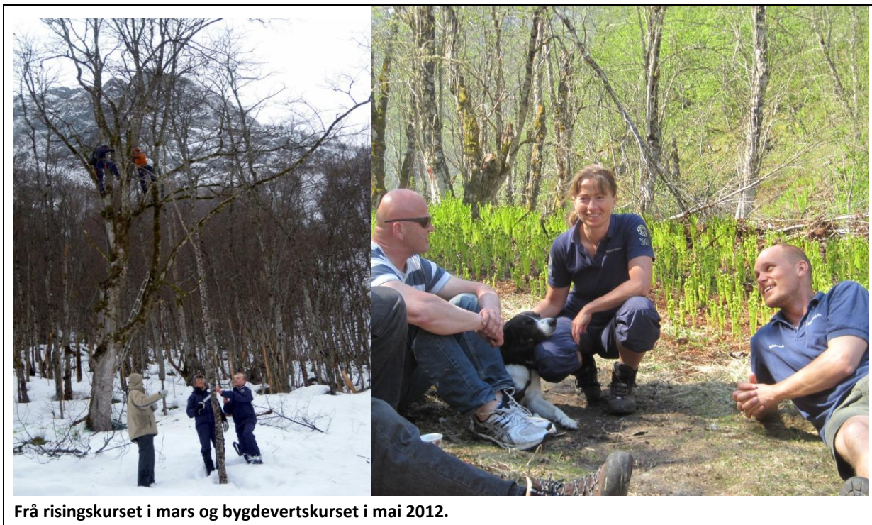
Frå risingskurset i mars og bygdevertskurset i mai 2012.

SNO- Luster deltok også på Lærdalsmarknaden med SNO-lavvoen.