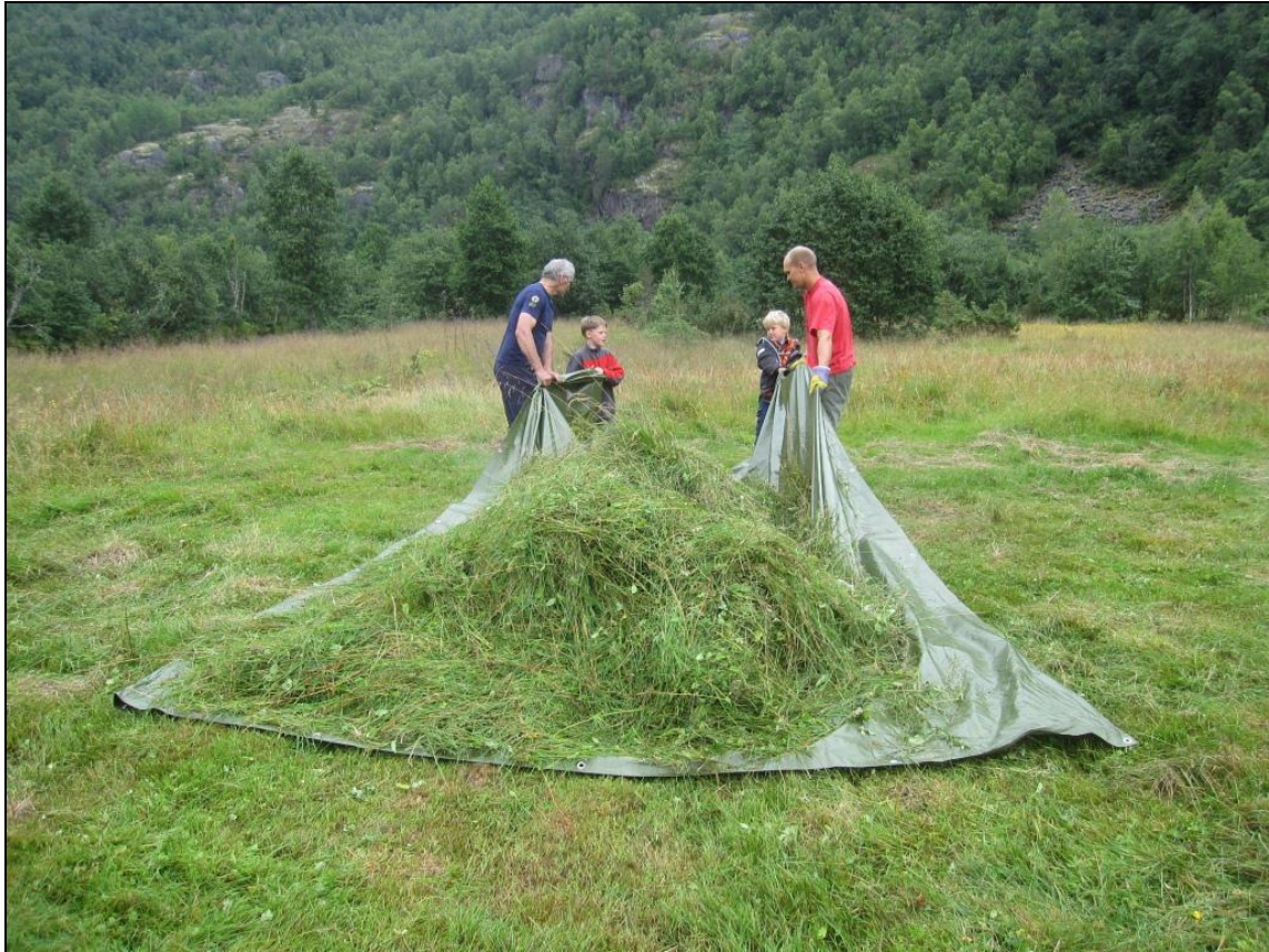
Graset veret fjerna frå enga.