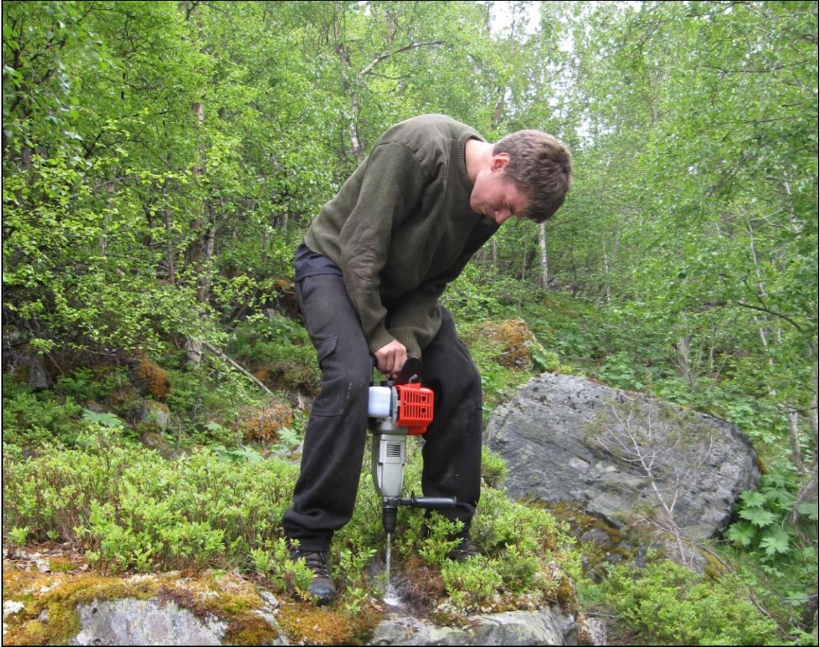
Skiltinga i Luster vart utført av Kjetil Ruud.