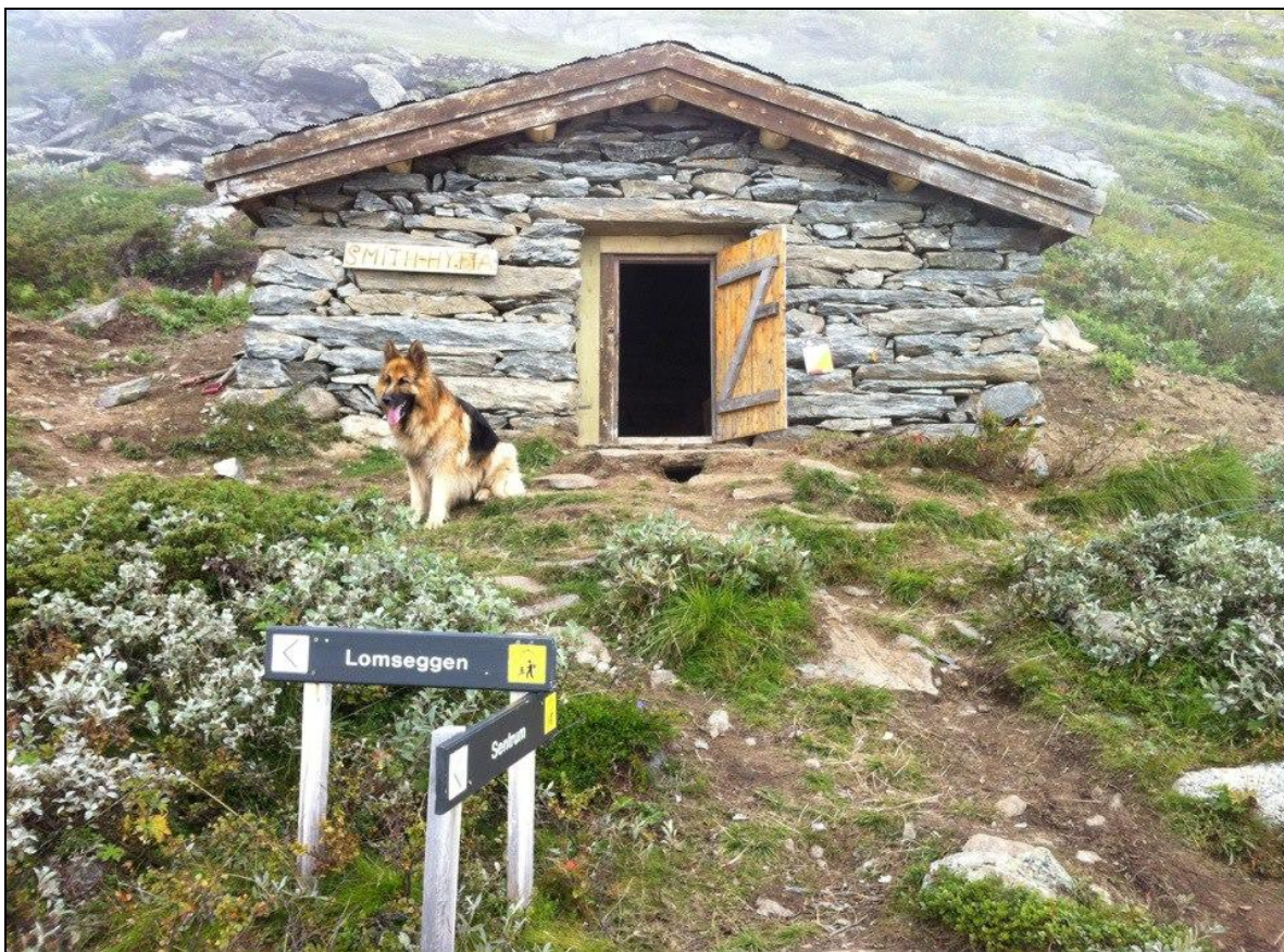
Smithbue etter restaurering.