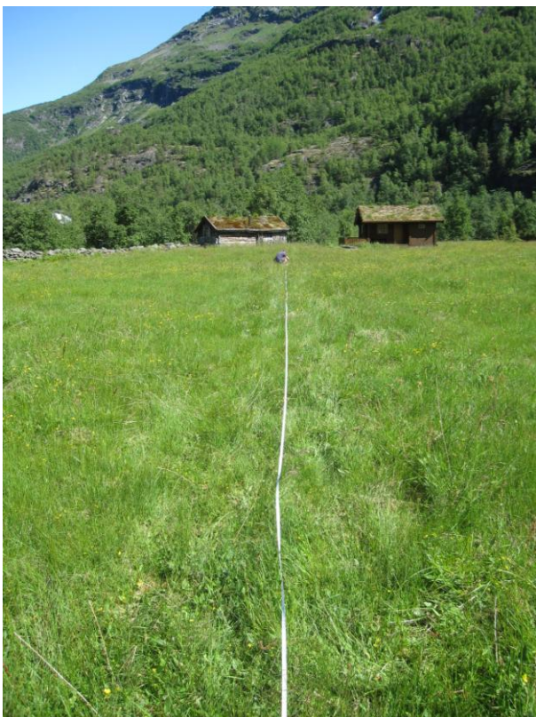
Frå strukturert befaring på Dulsete.

Strukturete befaringar på Dulsete og Knivakkgjerdet bør halde fram årleg. Likeeins bør ferdselsteljaren måle bruken av stien årleg. Stislitasjen på stien mellom Mørkri og Fast målast med jamne mellomrom. Det er viktig å få lange måleseriar som seier noko om utviklinga.