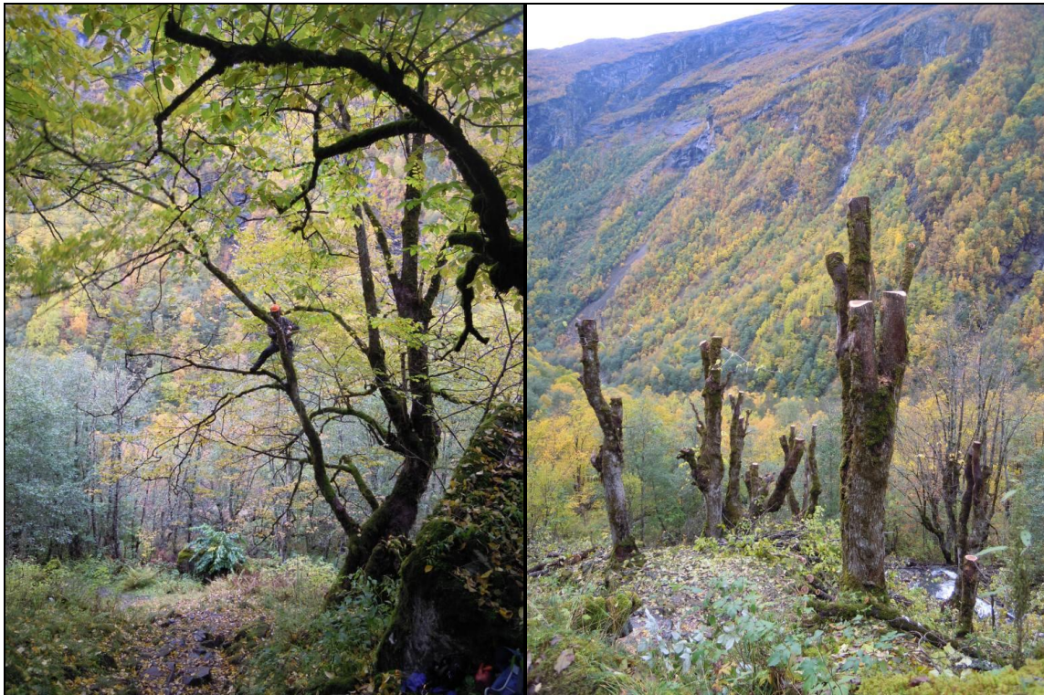
Restaurering av desse store almane krev god ekspertise, her utført av økolog Steinar Vatne.