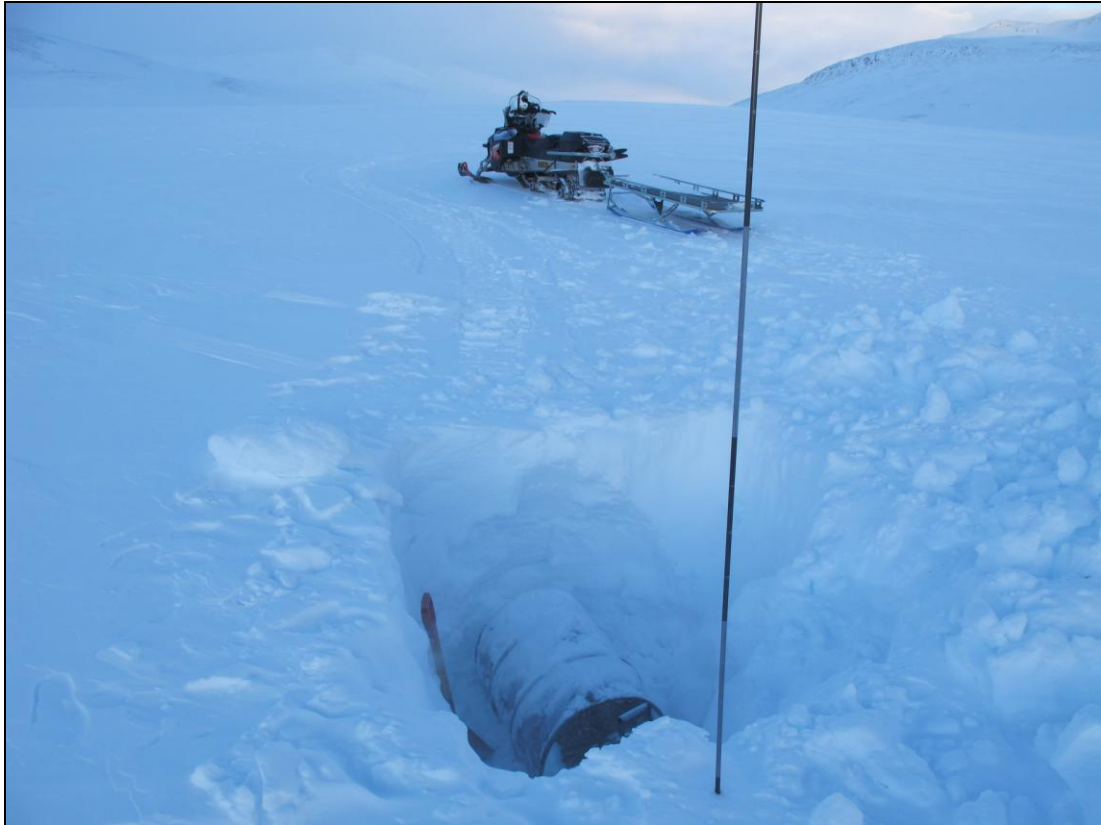
Nedkøring av søppel frå fjellet, her gamalt dieselfat.