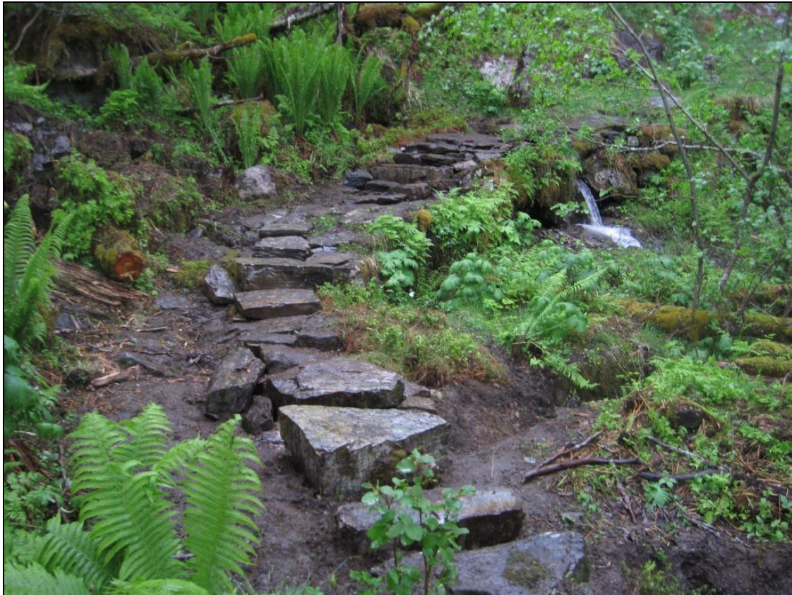
Stien i Dalsdalen etter tiltaket.

I Dalsdalen som er inngangsporta til Vigdalen landskapsvernområde, har stien blitt utbetra vesentleg frå parkeringsplassen i Dalsdalen til stølen Kilali.