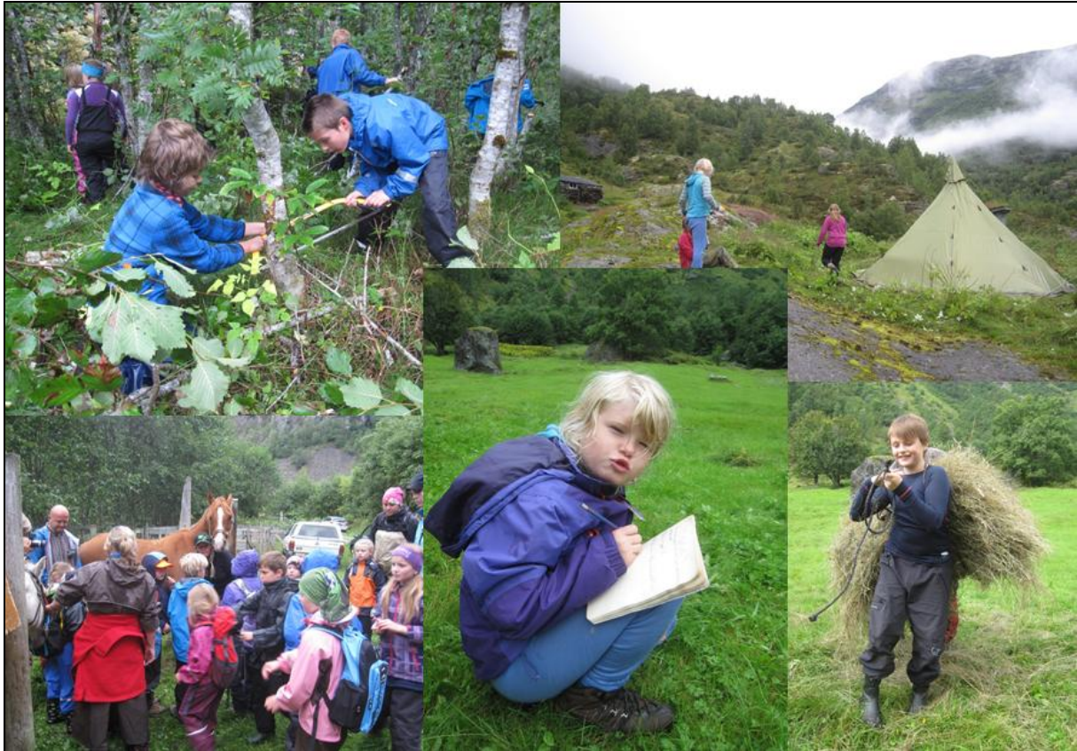
Glimt frå skuleopplegget i Mørkridsdalen. Her er tema kulturlandskap og korleis dette er forma av tidlegare bruk.

På Dønfoss i Skjåk har vi vore med i ei prosjektgruppe som har jobba med ei utstilling om Reinheimen og Breheimen NP. Dette er ein informasjonsportal til desse verneområda, der ein treff bygdefolk, hyttefolk og andre turistar. Informasjonssenteret ligg i tilknytning til ein Coop-marked butikk, og fylgjer opningstidene der.