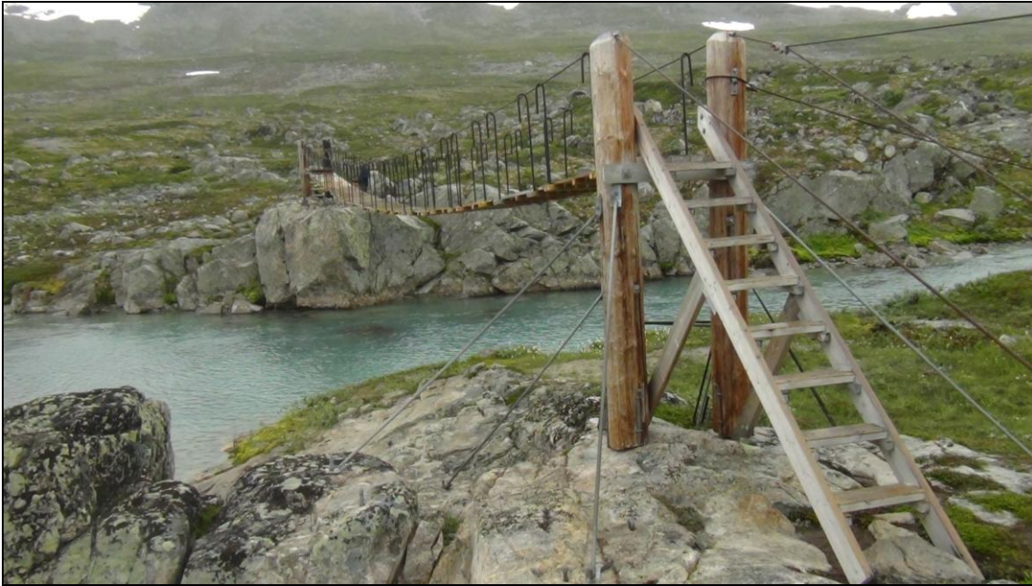
Brua i Tundradalen etter ombygging.