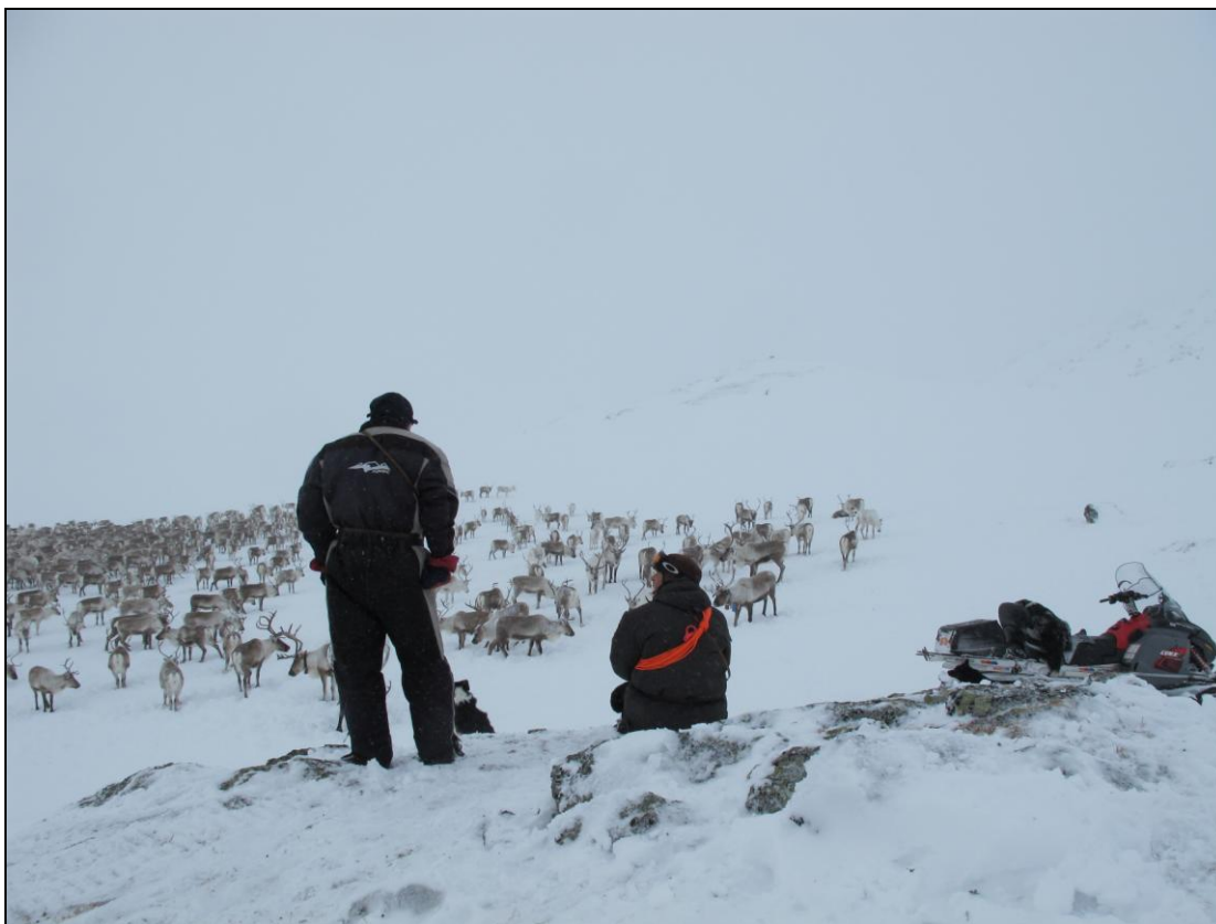
Lom tamreinlag med delar av flokken sin i Krosshøe.