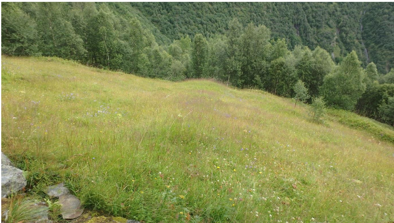
Figur 2. Nedre teigen ved Vollasetra, før slått. I nerkant ser ein blåbærfelt, elles ser teigen no mest ut som setervoll.