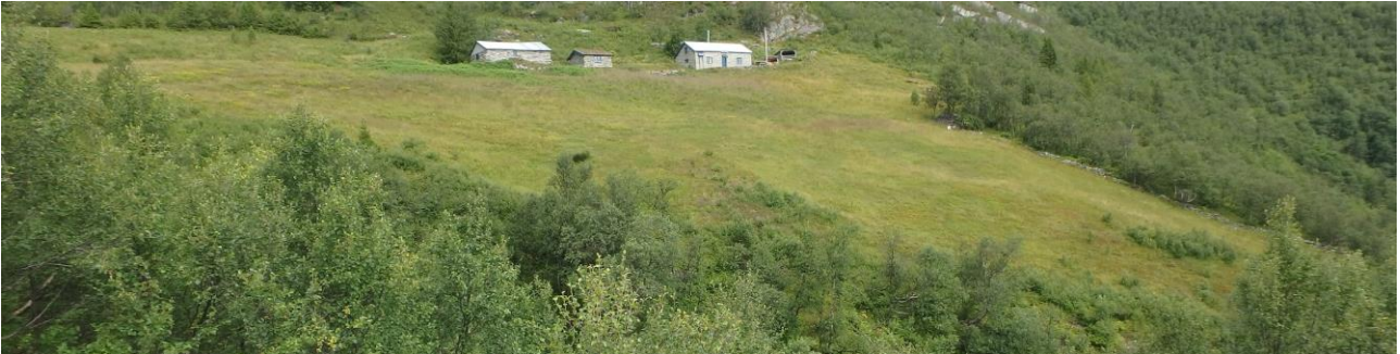
Figur 16. Langbakksetra, før slått i 2017.