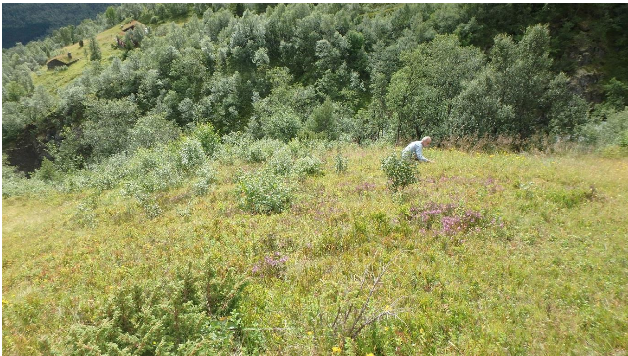
Figur 10. Same område som i figur 9. Einerbusken i framkant syner øvst på figur 9.