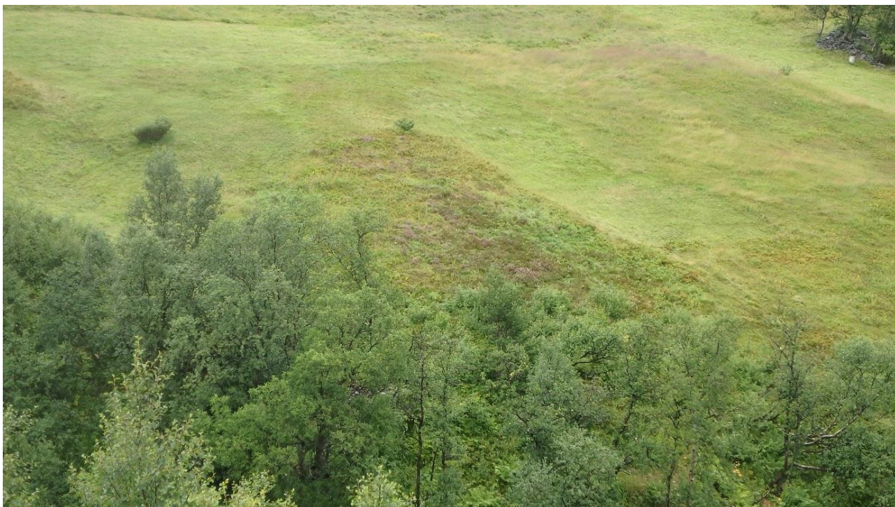
Figur 14. Omtrent same areal som i figur 9, etter at det er rydda og delvis slått. I overkant i høgre halvdel ser vi eit felt med fiolett farge av kvein, og på oversida eit uroleg felt med mykje sølvbunke. Det er slått noko i sølvbunkeområdet tidlegare, men lite i år.