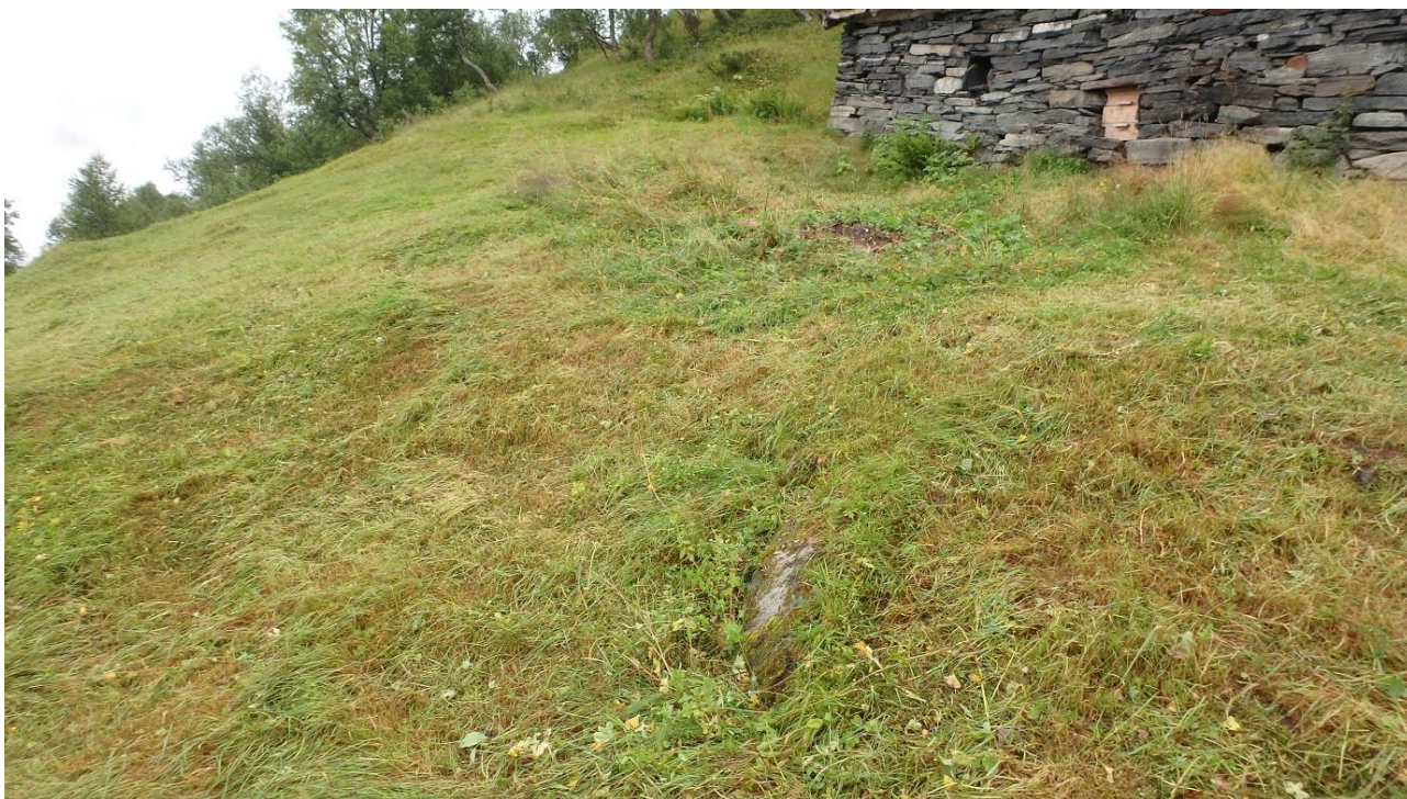
Figur 5. Det er synd for resten av arealet at ein ikkje får til å rydde «utstillingsarealet» nedanfor fjøset.