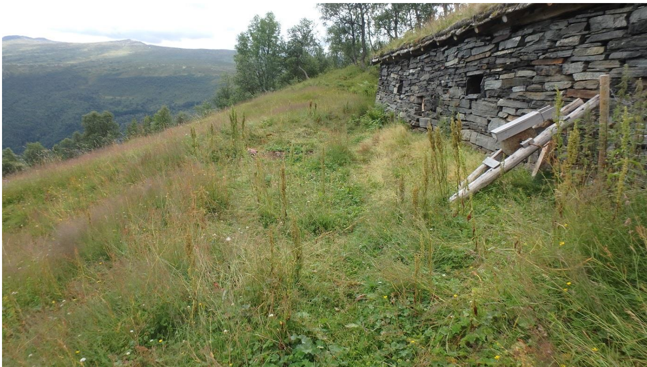
Figur 4. Nedanfor fjøset er det eit areal nesten like stort som fjøset som KNT har rota med. Dette har tapt sine biologiske verdiar og det er slåttemessig ulendt, så vi prioriterer andre areal først, men fjernar høymole for å unngå spreing til resten av areala.