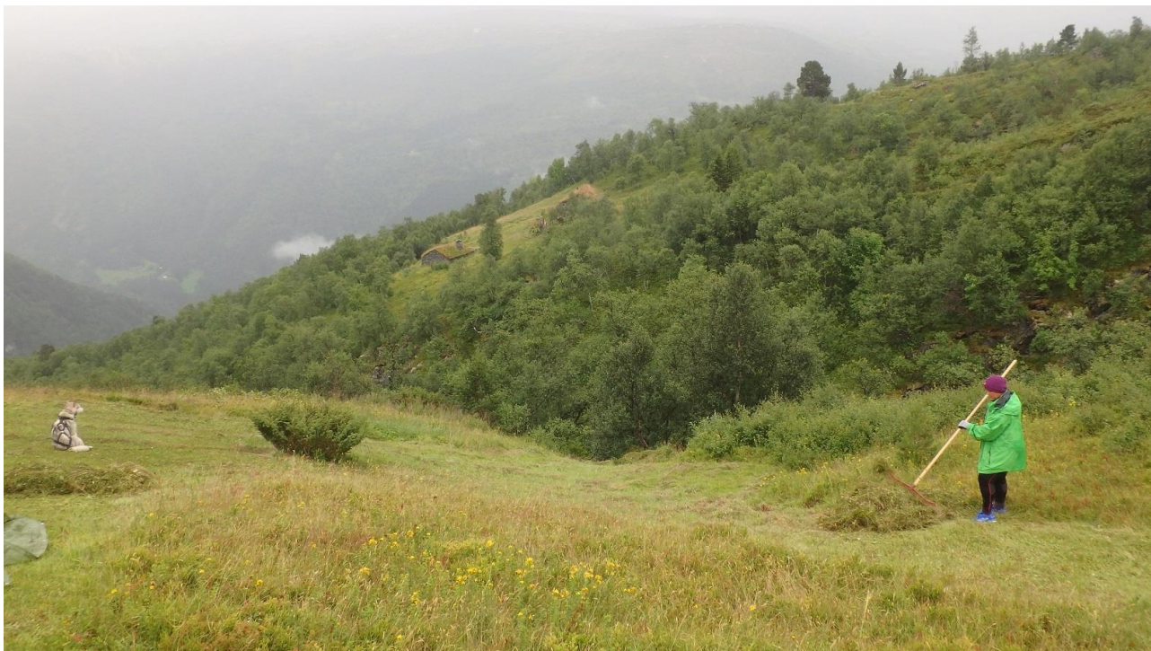
Figur 13. Graset blir raka av. I år var det ikkje tørt, så det blei raka av etter kvart som vi rakk det. Det er ikkje mangel på frøbank enda i dette restaureringsprosjektet.