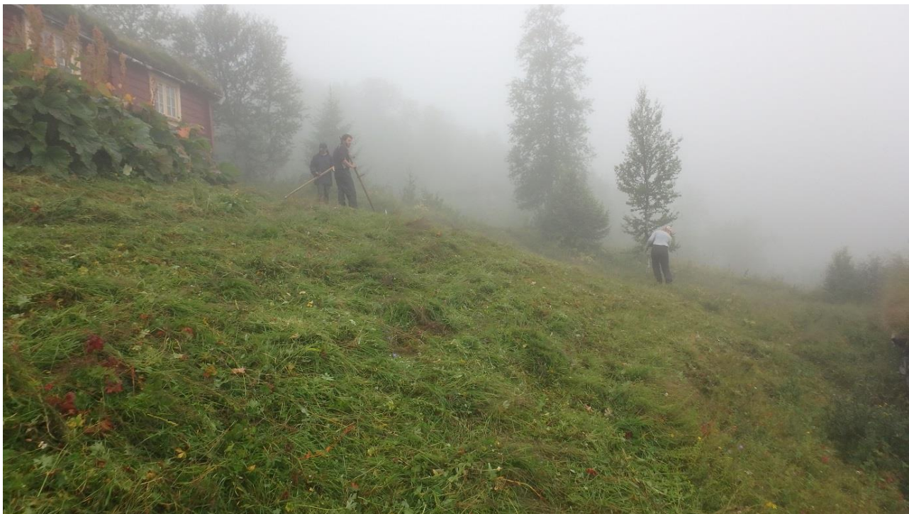
Figur 1. Ljåen bit godt, men elles er 100% luftfuktigheit mest til bry.

På dagen fredag og på morgonen laurdag og søndag var det så vidt opplett. Resten av helga var det meir og mindre vått. Det var ikkje tørk på noko av slåttegraset.