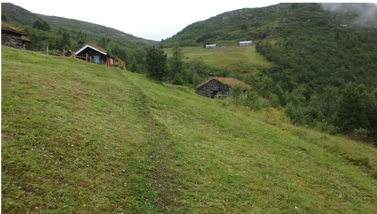
Figur 7. Det blei tatt noko mindre lauvtre nedanfor stien til høgre, men elles er det same areal som tidlegare som blei slått.