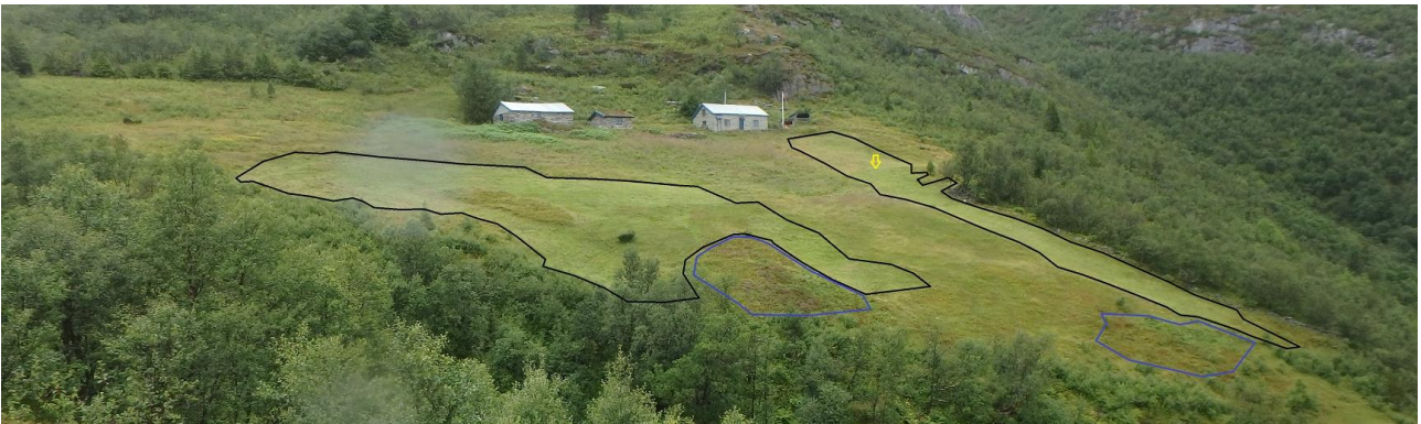
Figur 17. Langbakksetra, slått areal 2017 innramma omtrentleg med svart. I vestre felt er det eit mindre blåbærareal som ikkje er slått. I nerkant to område med blått der det er fjerna bjørk i år. Gul pil viser ein overgang mellom areal slått i 2015 og det som no truleg er slått for første gong sidan 1956 på oversida.