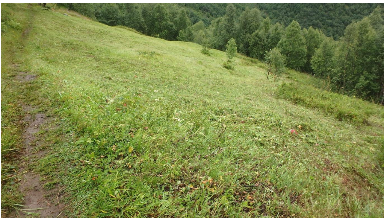
Figur 3. Nedre teigen sett heilt frå enden. I framkant eit område som har vore prega av blåbær og fugletelg, slått dei to siste åra. Framleis ser ein at grasartar og urter manglar. Difor har ein tatt litt av slåttegraset frå andre stader og lagt på, slik at ein får frøing. Litt over midten av biletet og til venstre kan ein sjå flekkar som ikkje er slått, rundt kvitkurler. Dei små bjørkene sto ein gong i overkant av blåbærfelta. Fleire av blåbærfelta i høgrekanten av biletet er no øyer.