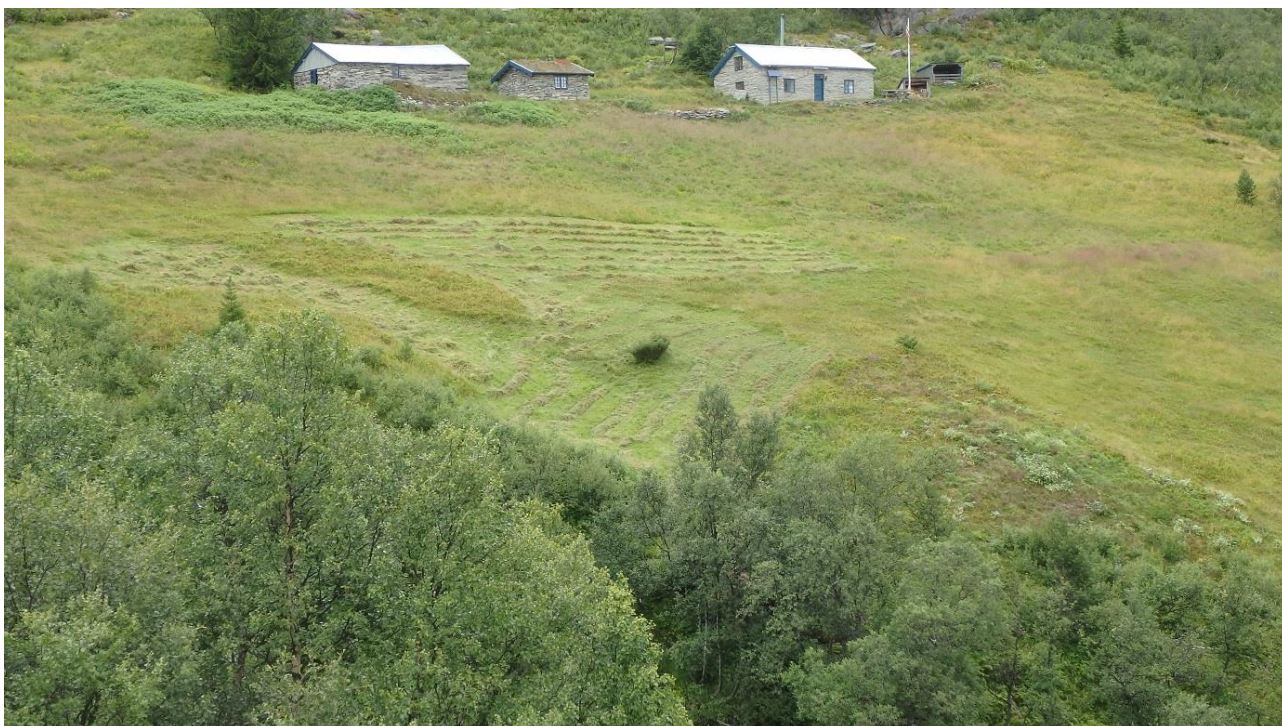
Figur 11. Resultat av 3,5 timar slått og 3,5 timar arbeid med bjørk, på fredag. Slått areal utgjer ca. 500 m 2 . Einerbusken som syner på figur 9 og 10 er her til høgre for midten. Fjerna bjørk og gras blir lagt i nerkant av skjøtselsarealet, bak dei kraftigaste bjørkene midt i biletet.