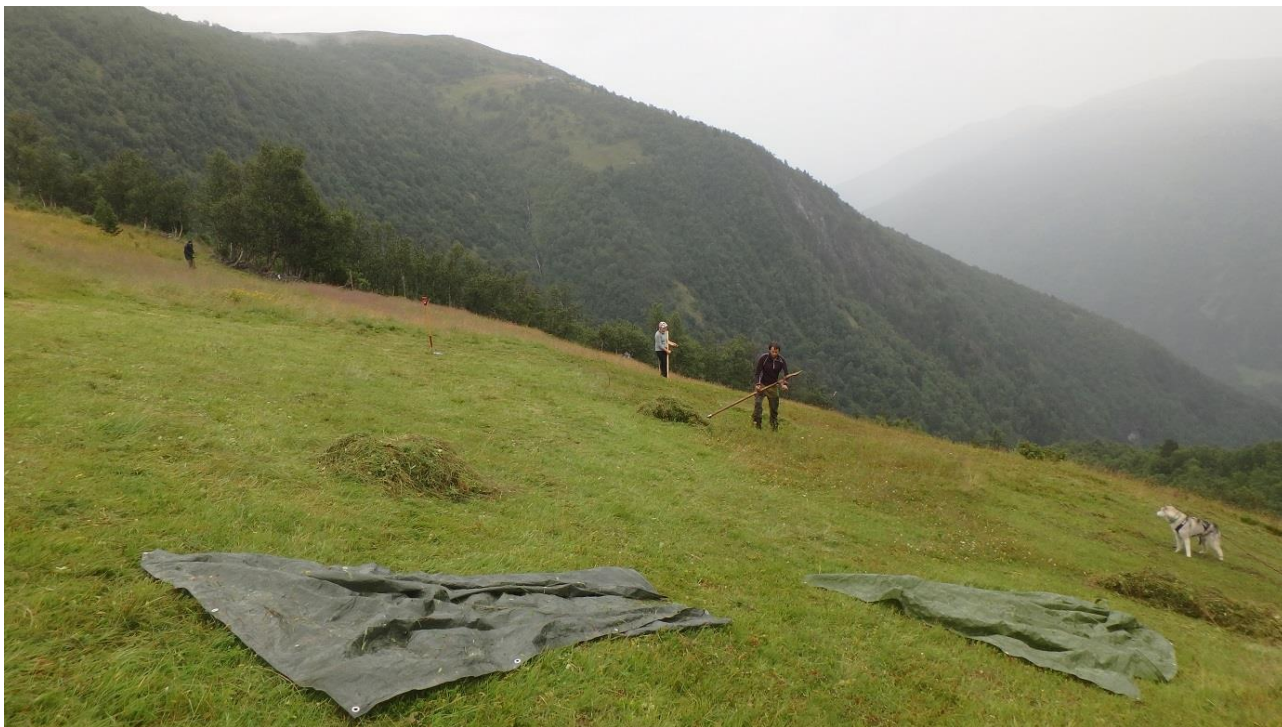
Figur 12. På det meste var det 5 ljåer i sving samtidig dette året. I venstre kant er det eit større område med sølvbunke, på nedsida av fjøset, elles er det no mykje areal med grei slåttestruktur, men område med innslag av blåbær.