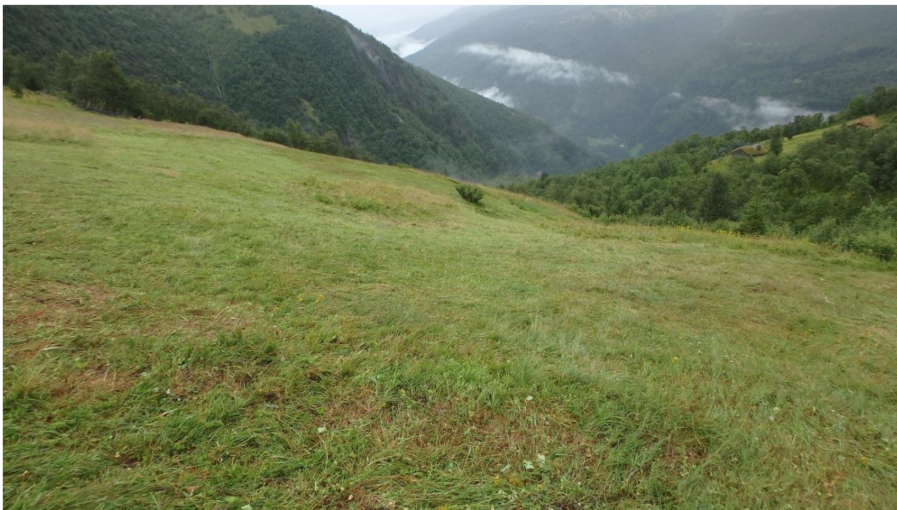
Figur 14. Biletet er tatt så langt nordvest som vi fekk slått, mot søraust. I framkant ser vi litt brunare felt der det har stått firkantperikum og truleg begynnande blåbæroppslag. Midt på biletet ei øy med blåbær som vi gnagar litt av kvart år. I høgre kant ser vi også blåbærfelt som vi reknar med å gnage litt meir av framover.