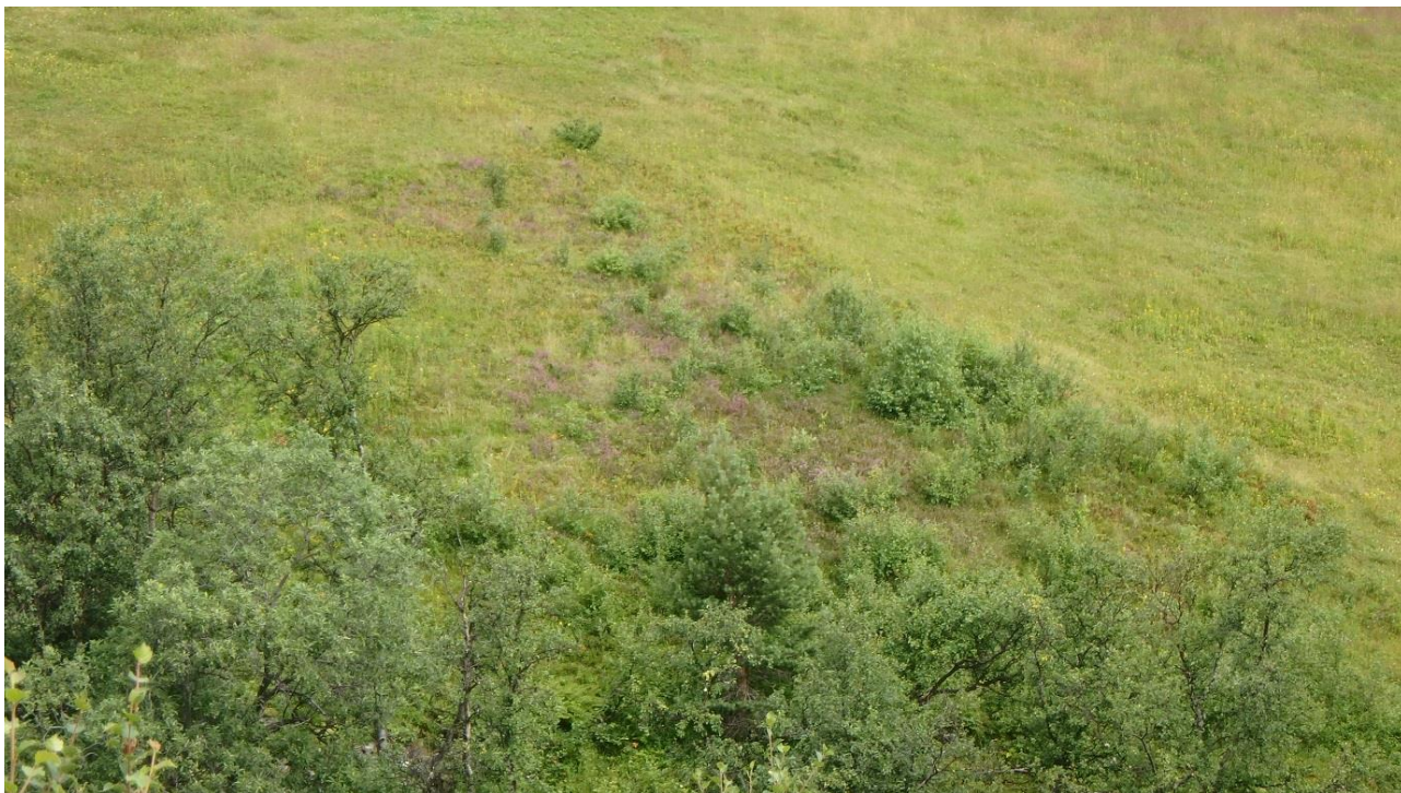
Figur 9. Eit område på ein liten rygg nede på vestsida på Langbakksetra, der det er bjørk med blåbær og røslyng under, før slått 2017.