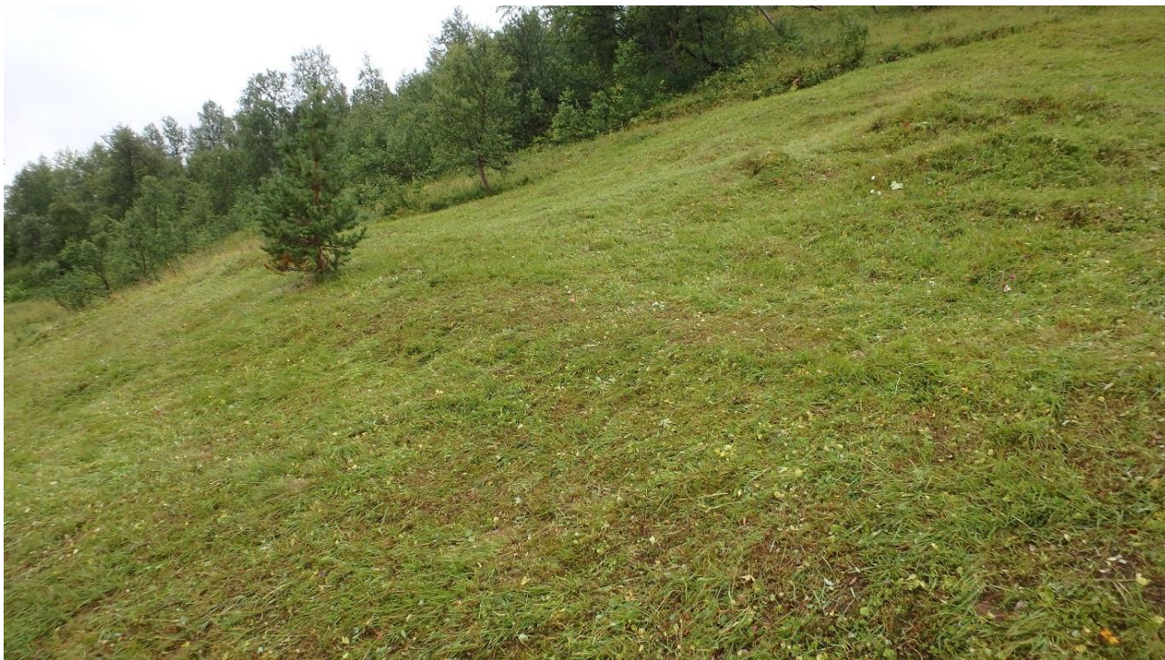
Figur 8. Fotografen står på stien, fjøset ligg litt utanfor biletkanten oppe til høgre. Alt som ein ser er slått på dette biletet hadde ulik grad av blåbærinnslag og ein del småbjørk og vier i 2011. På heile området finn vi no marinøkkel, og ein del engbakkesøte. Det lugger framleis litt i blåbær, men slåttestrukturen er i ferd med å vende tilbake.