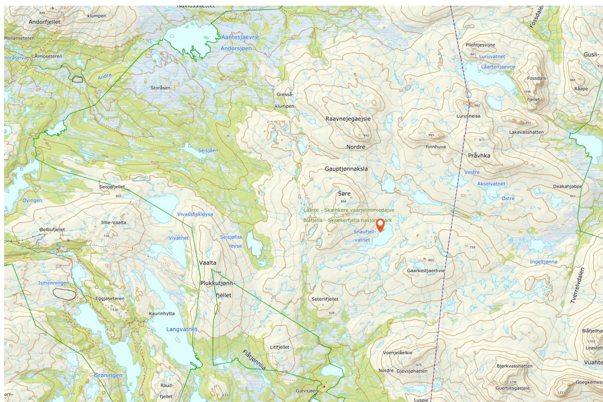
Fig. 1: Kart som viser hvor Snaufjellvatnet i Snåsa kommune ligger.